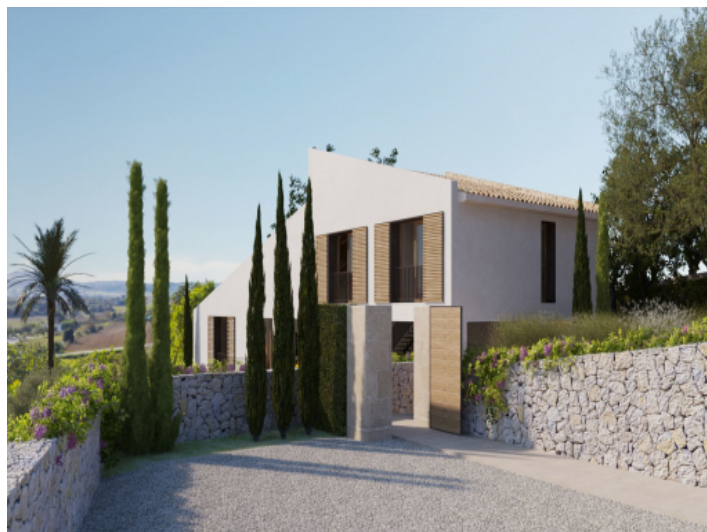
Zufahrt zur Finca