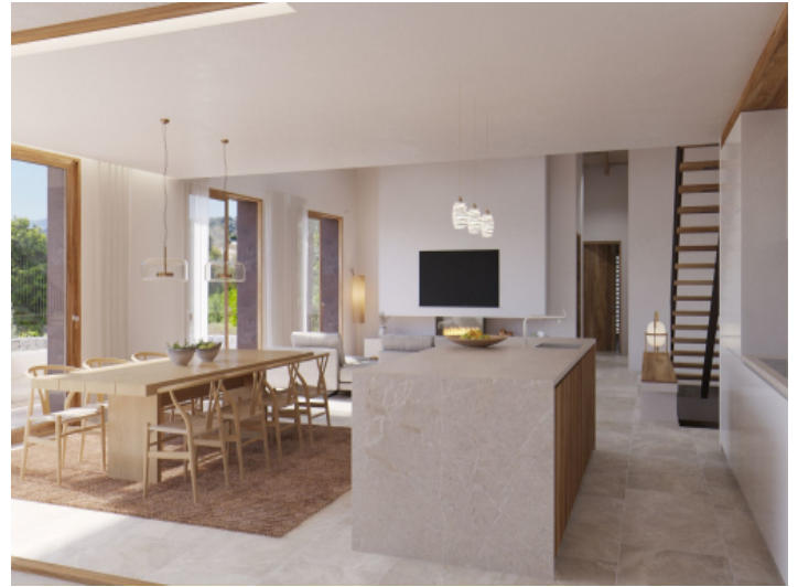
Wohn- und Essbereich mit Küche