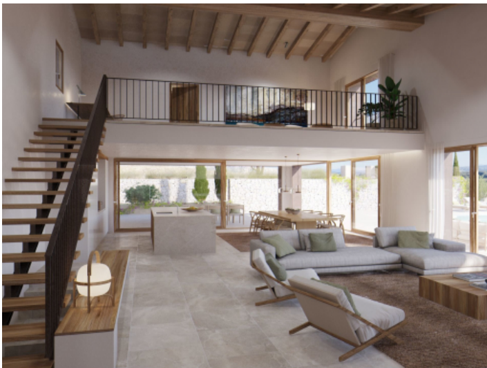
Wohnbereich und Galerie