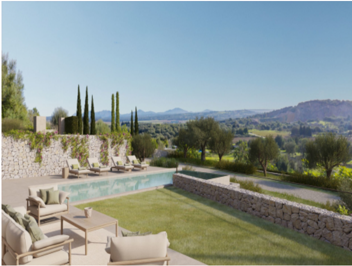
Poolbereich mit Weitblick