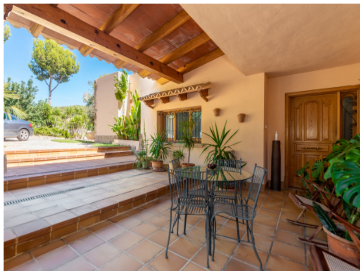
Vordere Terrasse am Eingangsbereich