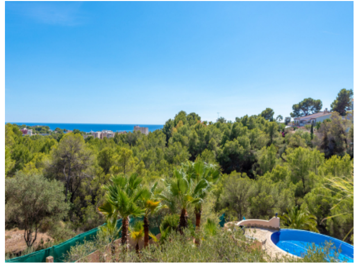
Meerblick vom Balkon aus