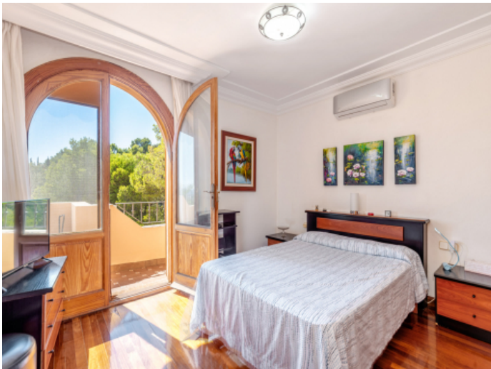
Schlafzimmer mit Balkonzugang