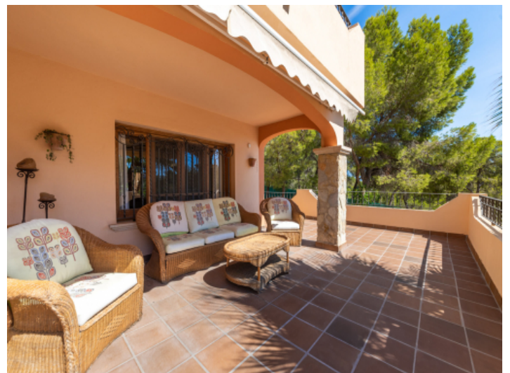
Überdachte Terrasse mit Loungebereich