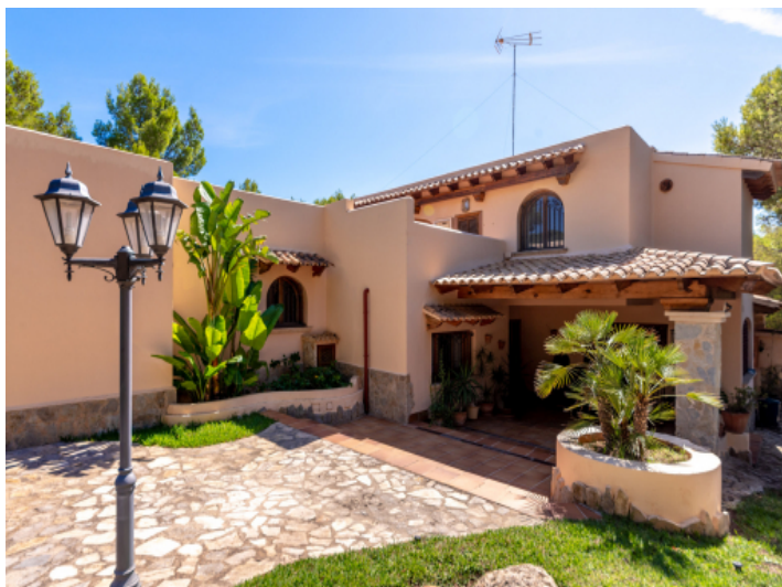
Frontansicht der Finca