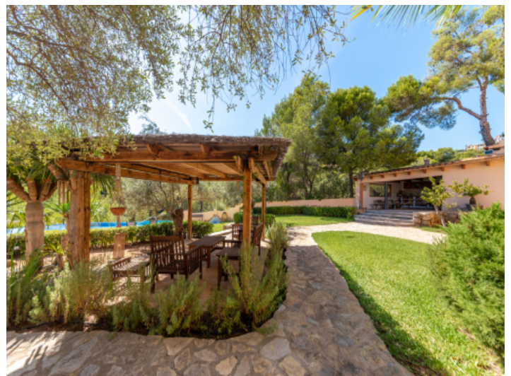
Garten mit überdachter Terrasse und Poolblick