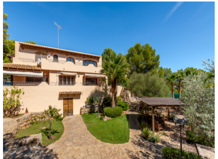
Blick vom Garten zur Finca