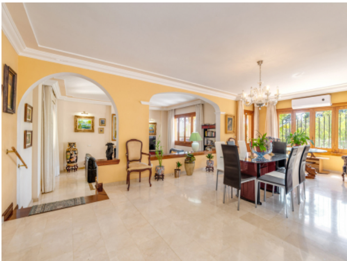
Essbereich mit Blick zum Wohnbereich