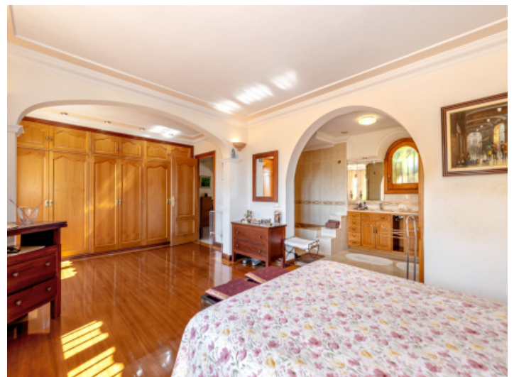
Schlafzimmer mit Badezimmer en Suite