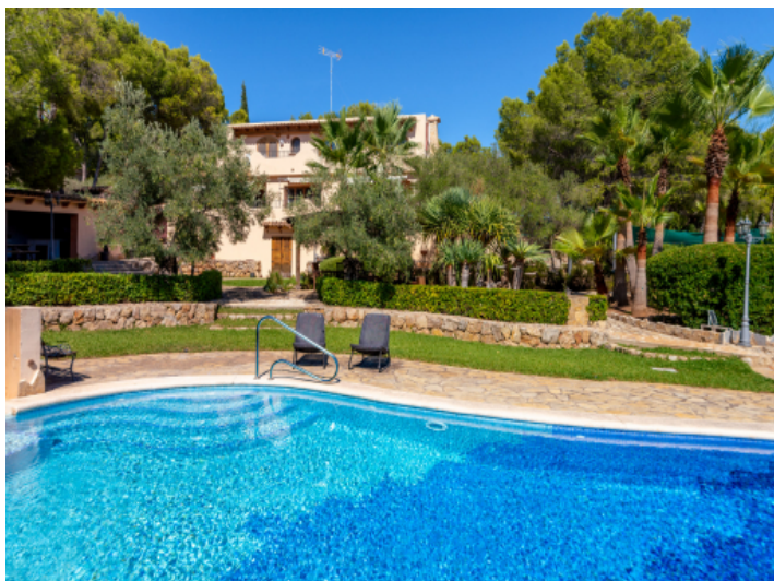
Pool mit Blick zur Finca