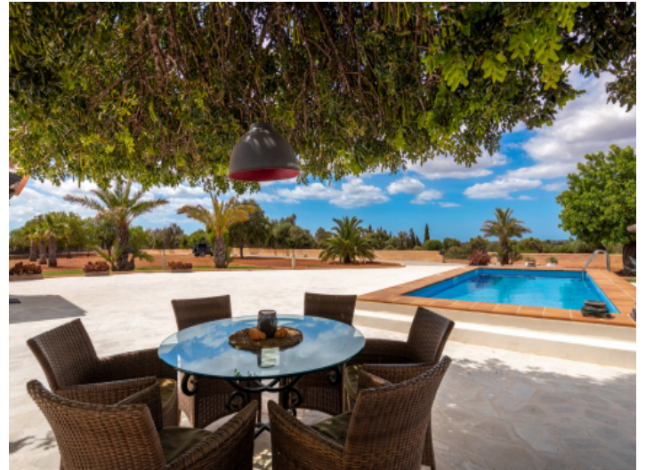
Schattenecke am Pool