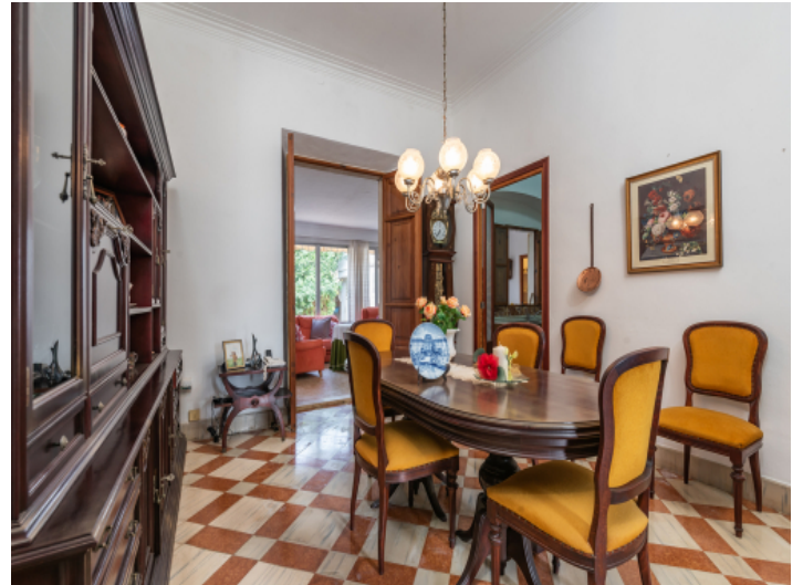
Zugang zum Essbereich