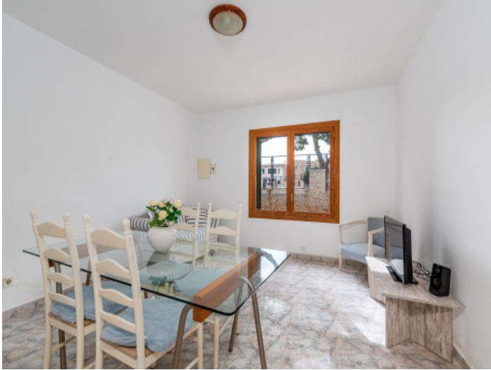
Wohnbereich im Obergeschoss