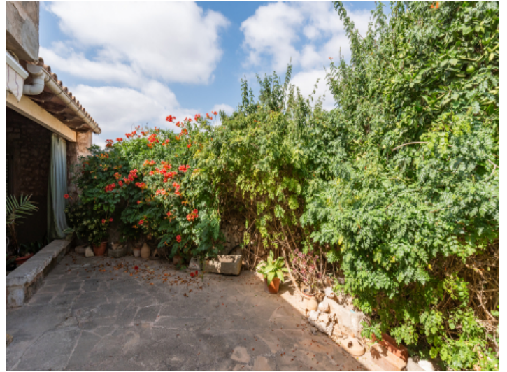
Angrenzende Terrasse im Außenbereich