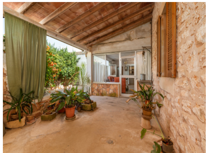
Große, überdachte Terrasse