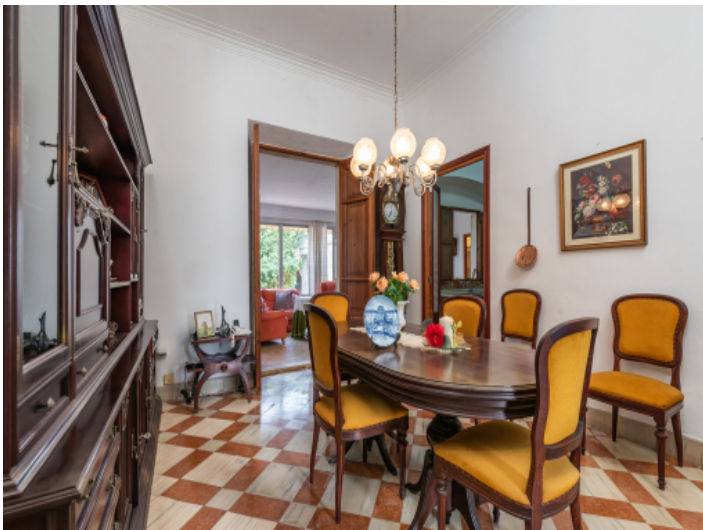
Zugang zum Essbereich