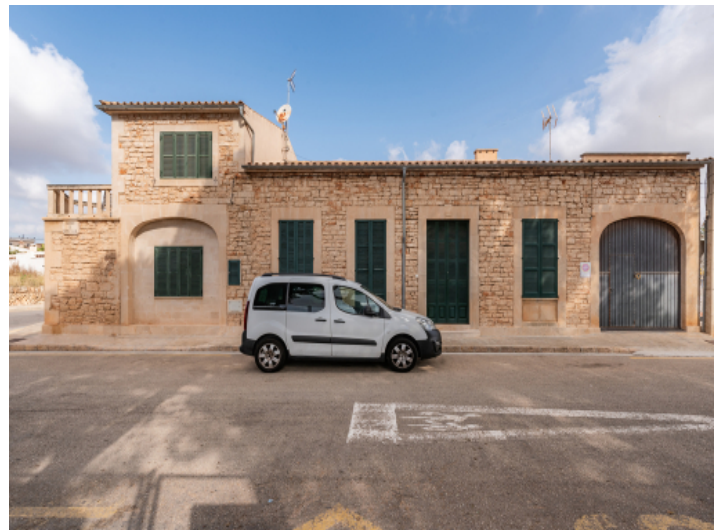
Außenansicht des Dorfhauses