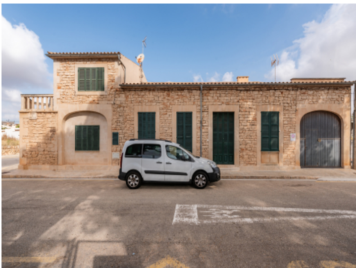
Außenansicht des Dorfhauses