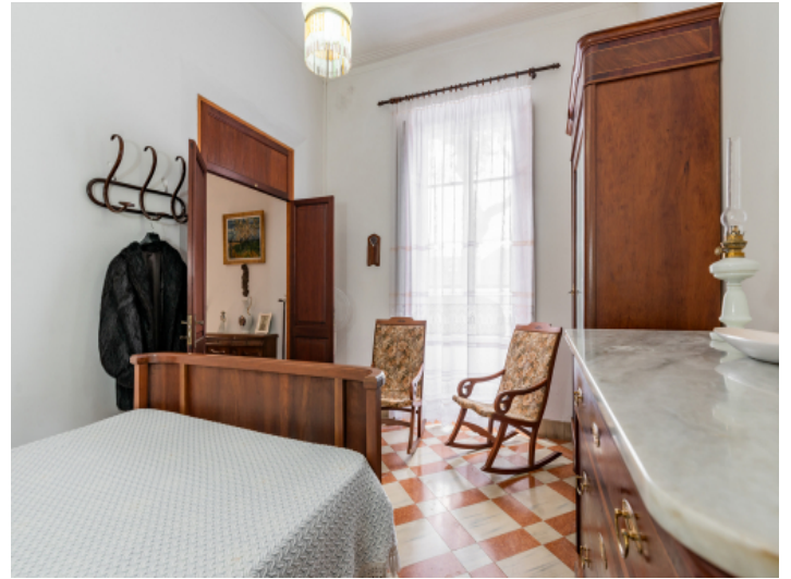
Schlafzimmer im Erdgeschoss