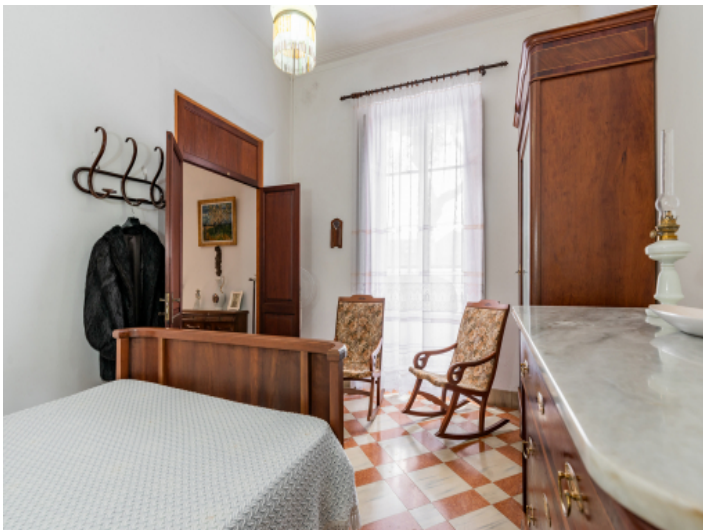
Schlafzimmer im Erdgeschoss