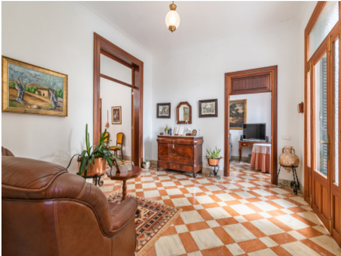
Traditioneller Eingang zum Haus