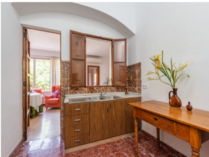
Zugang zur kleinen Küche