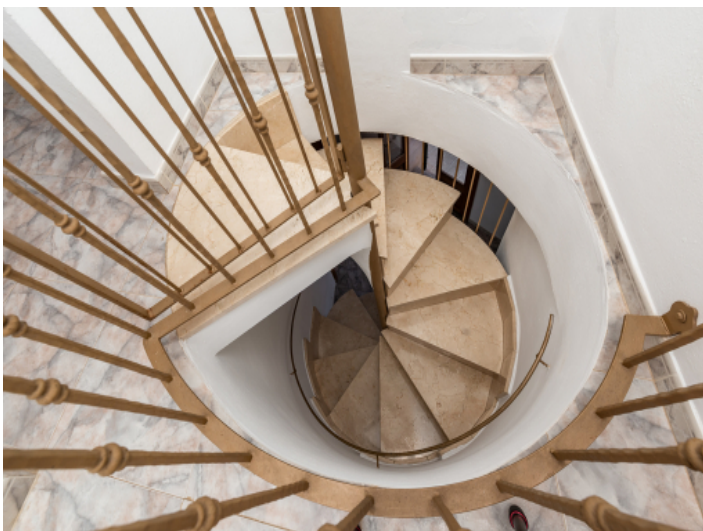
Treppe ins Obergeschoss