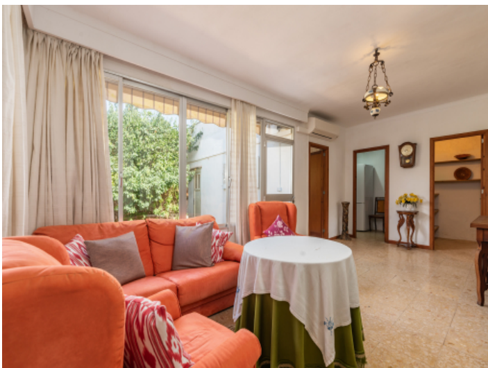
Heller Wohnbereich mit Patiozugang