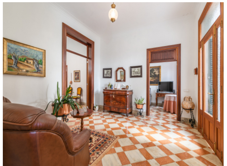
Traditioneller Eingang zum Haus