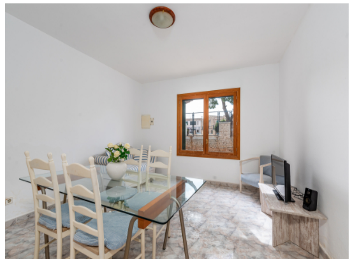
Wohnbereich im Obergeschoss