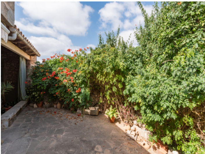
Angrenzende Terrasse im Außenbereich