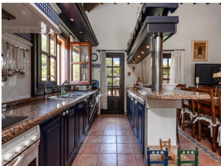
Komplett ausgestattete Küche