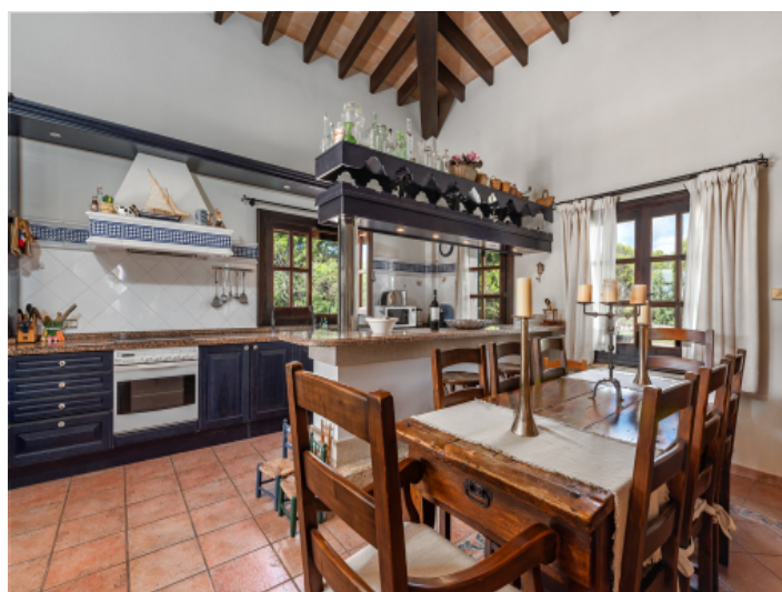
Amerikanische Küche mit Essbereich