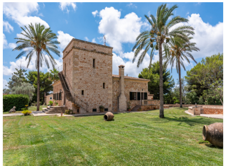
Blick auf die Natursteinfassade