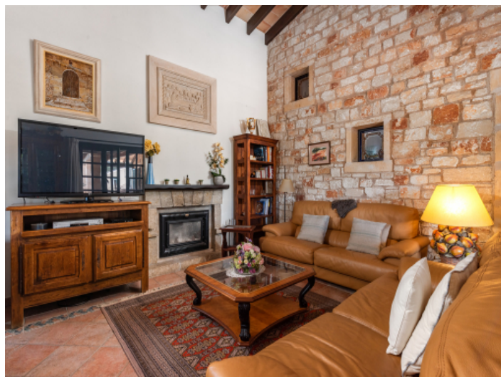
Rustikaler Wohnbereich mit Kamin