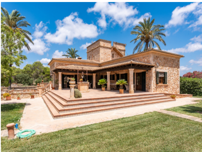
Blick zur Terrasse