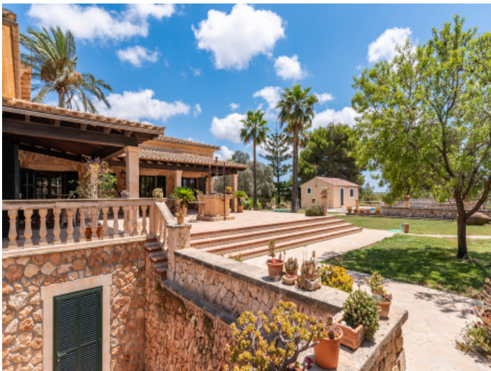
Sehr gepflegter Garten