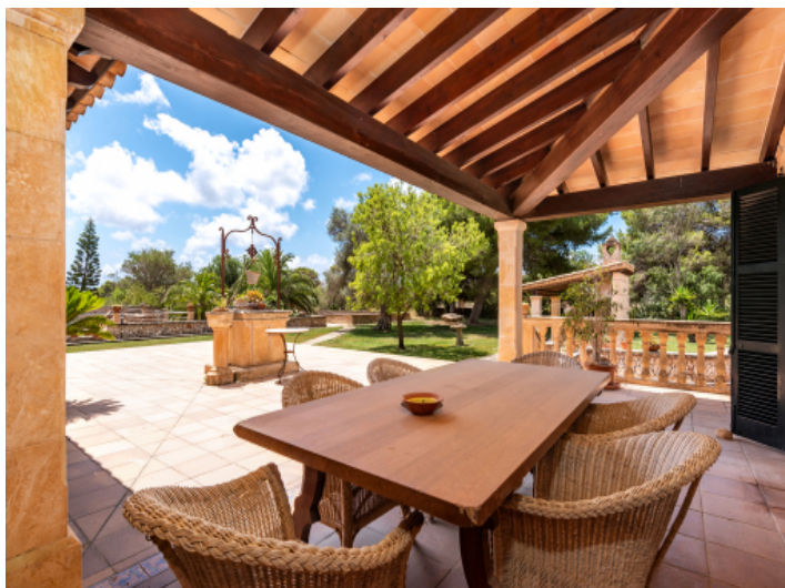
Essbereich im Freien