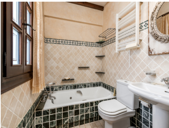
Eines von 3 Badezimmern