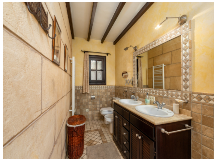
Eines von 3 Badezimmern