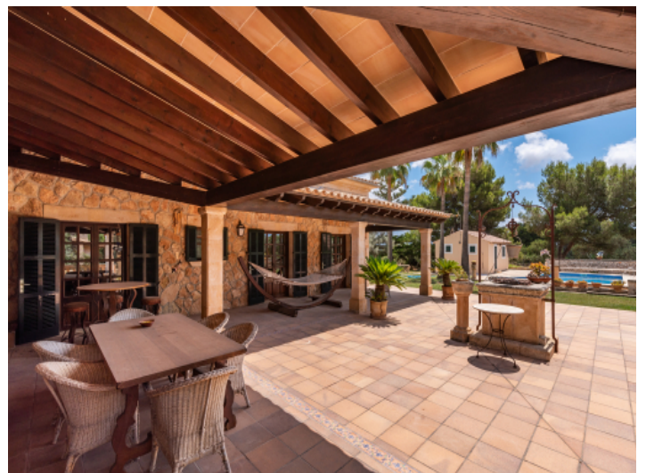
Teilweise überdachte Terrasse