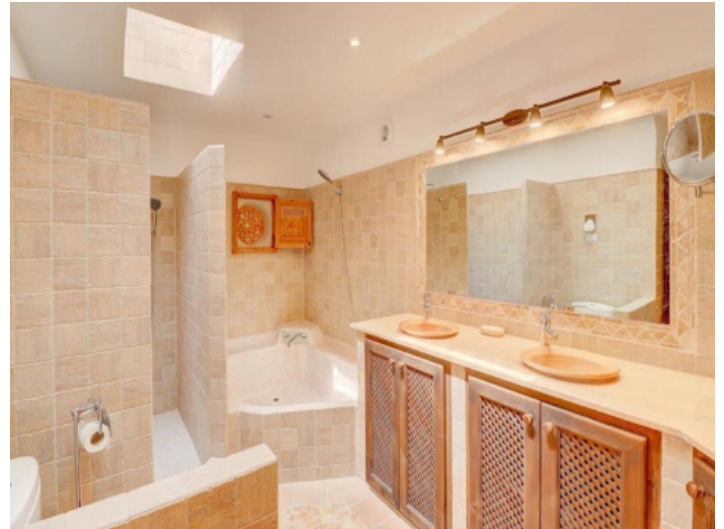
Eines von 5 Badezimmern