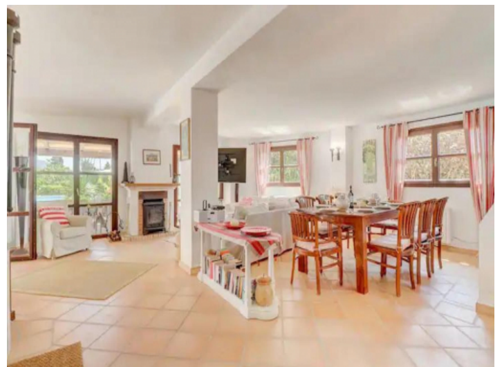
Geräumiger Wohn-/Essbereich mit Kamin