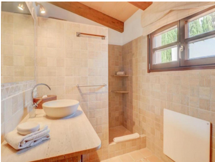
Eines von 5 Badezimmern