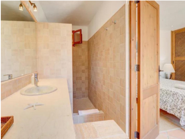
Eines von 5 Badezimmern