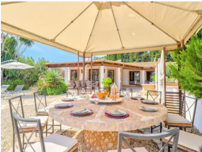
Wunderschöner Essbereich im Freien