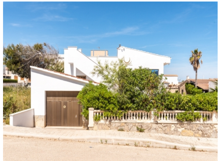
Hausansicht von der Straße