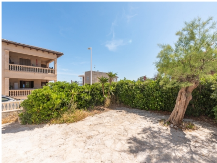
Innenhof / Terrasse