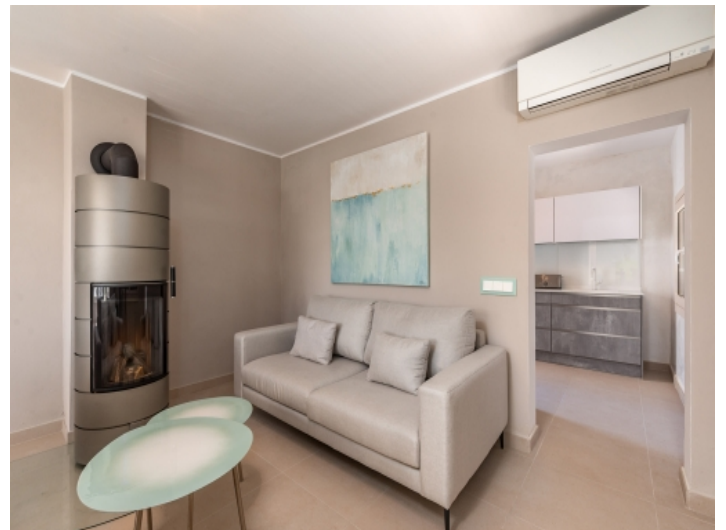
Weitere Ansicht des Wohnzimmers