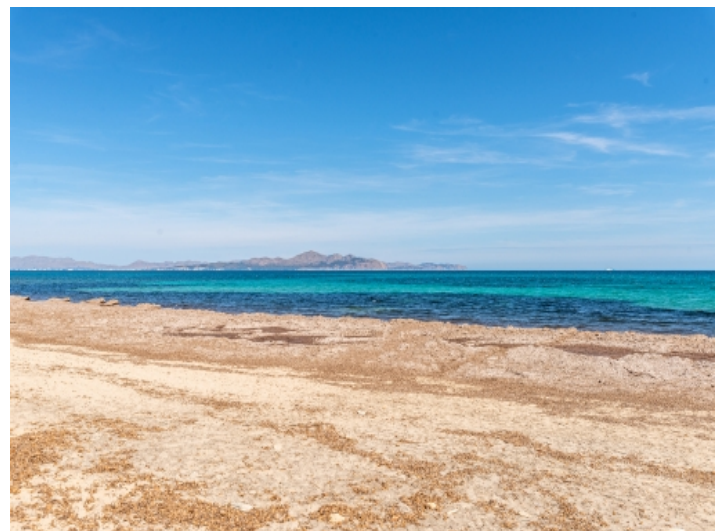
Fußläufige Entfernung zum Strand