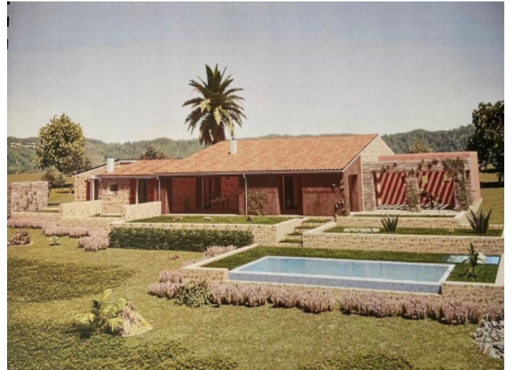
Fincaprojekt und Pool