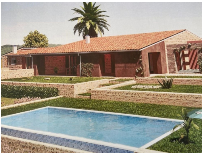
Garten und Poolbereich