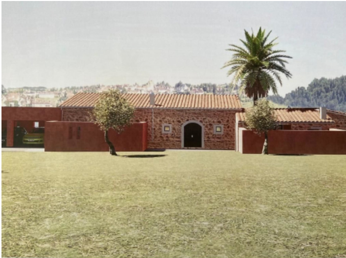
Frontansicht der Finca