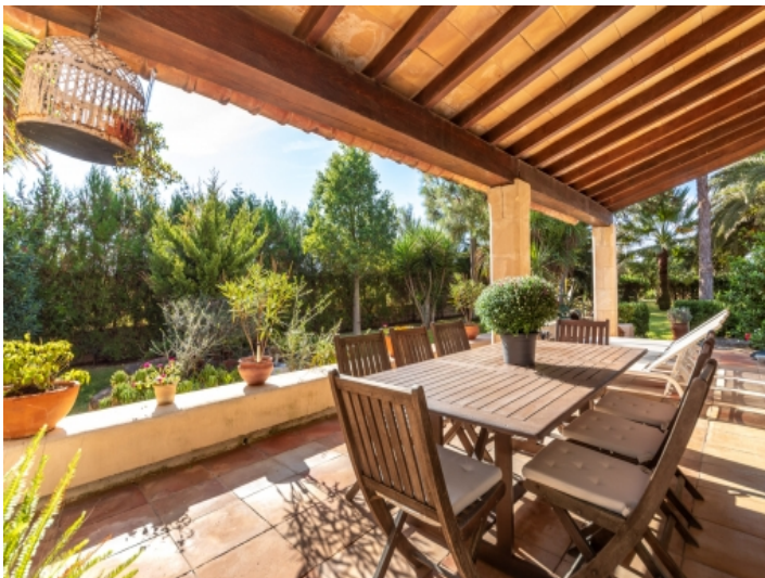
Überdachter Essbereich auf der Terrasse