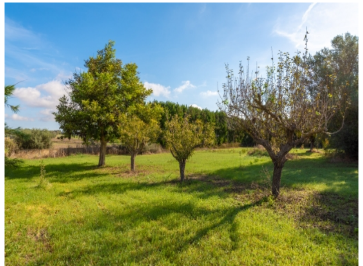
Garten mit Obstbäumen