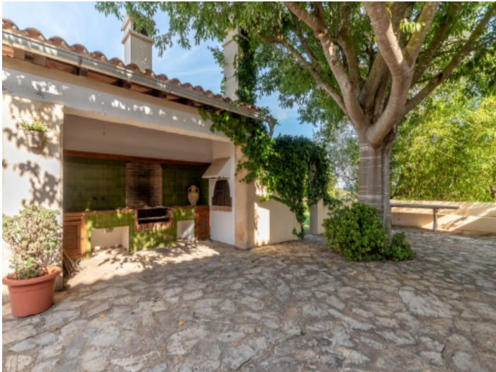
Überdachte BBQ Terrasse