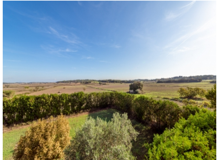
Wundervoller Weitblick von der Dachterrasse