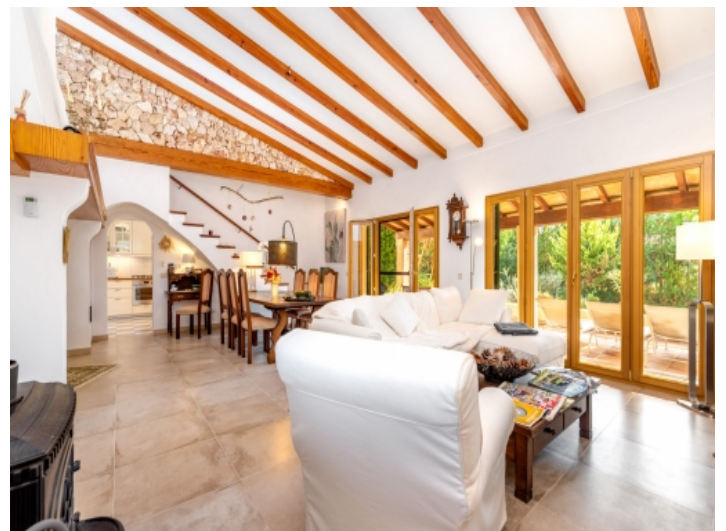
Geschmackvoll renovierter Wohnbereich