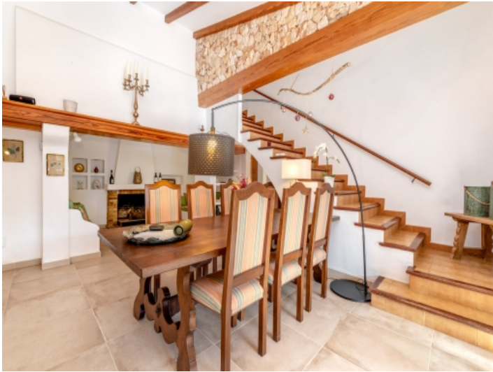
Essbereich im Erdgeschoss