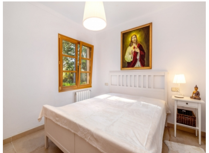
Eines von 2 Doppelzimmern