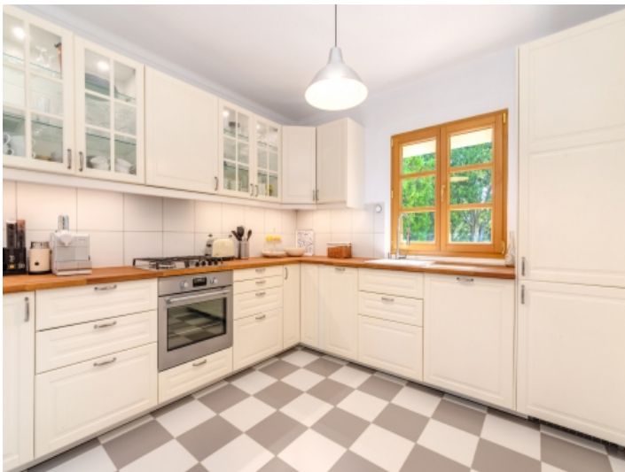
Moderne Küche in weiss