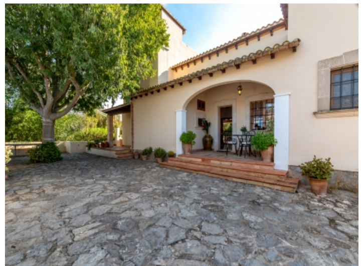
Eingang zur Finca