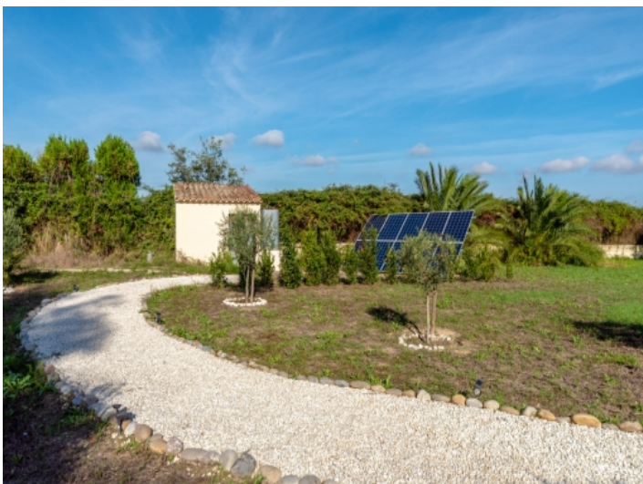
Grundstück mit Solar