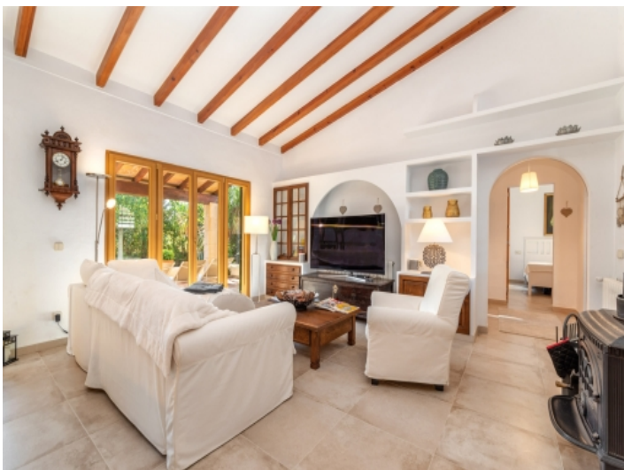
Heller Wohnbereich mit Terrassenzugang