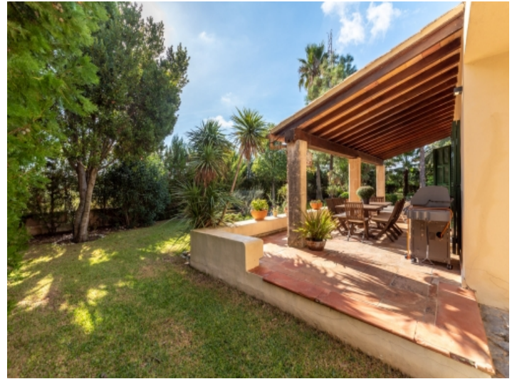
Bezaubernde Terrasse mit Garten