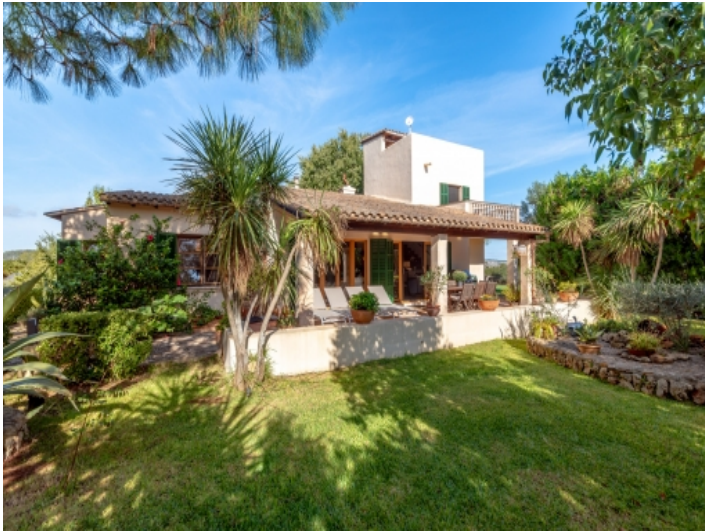
Finca umgeben von einem mediterranen Garten