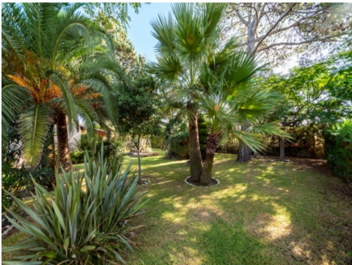
Garten mit Palmen