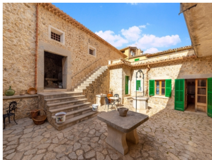
Ansicht des Patios