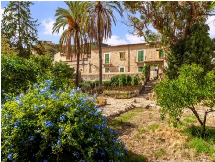
Dorfpalast mit großem Grundstück in Manacor de la Vall