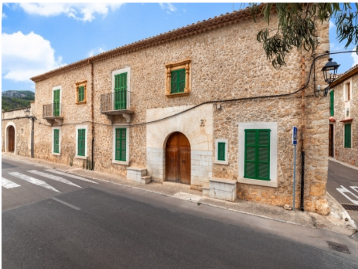
Frontansicht des Stadthauses