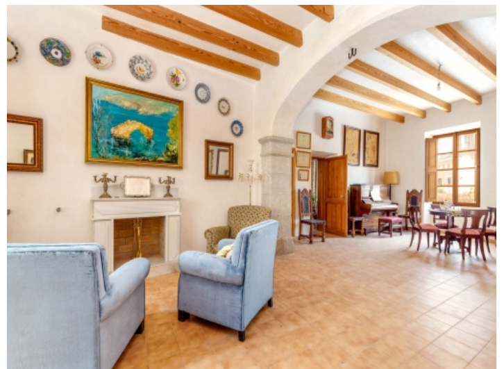
Ansicht des Wohnbereichs