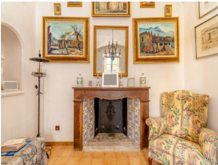
Ansicht des Wohnbereichs