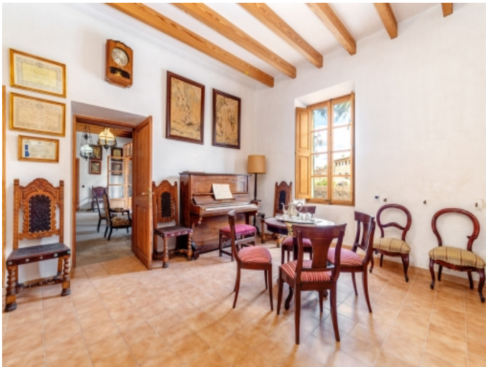
Ansicht des Wohnbereichs