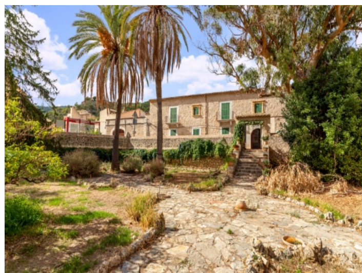
Blick on den Garten