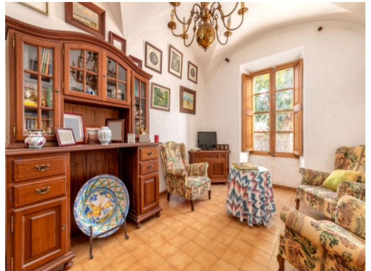
Ansicht des Wohnbereichs