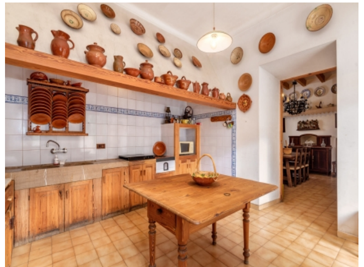
Küche mit Esstisch