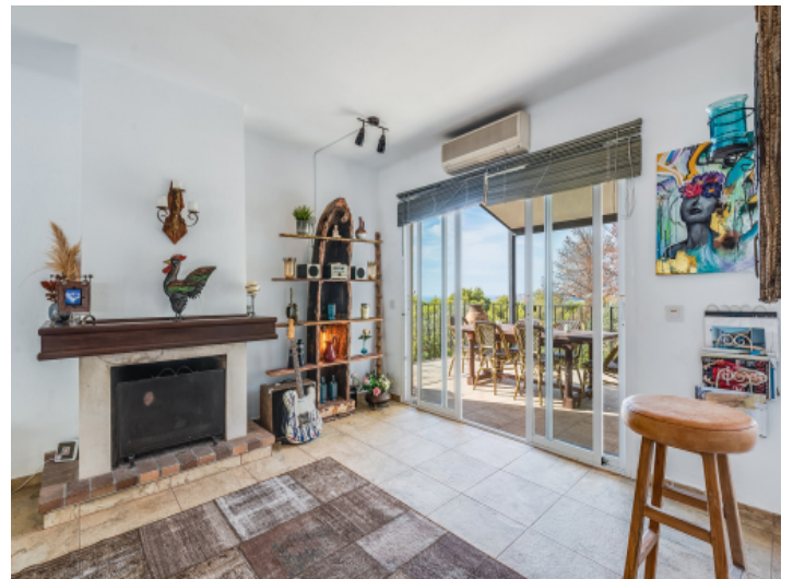
Zugang zur Terrasse