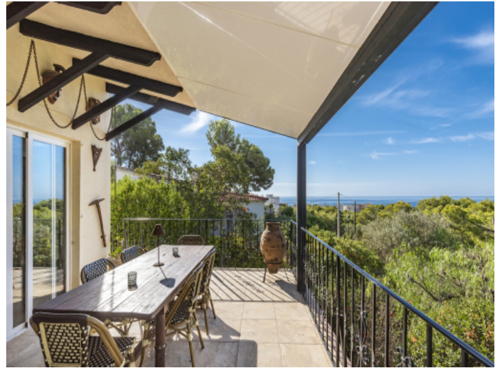
Alternativer Blick vom Balkon