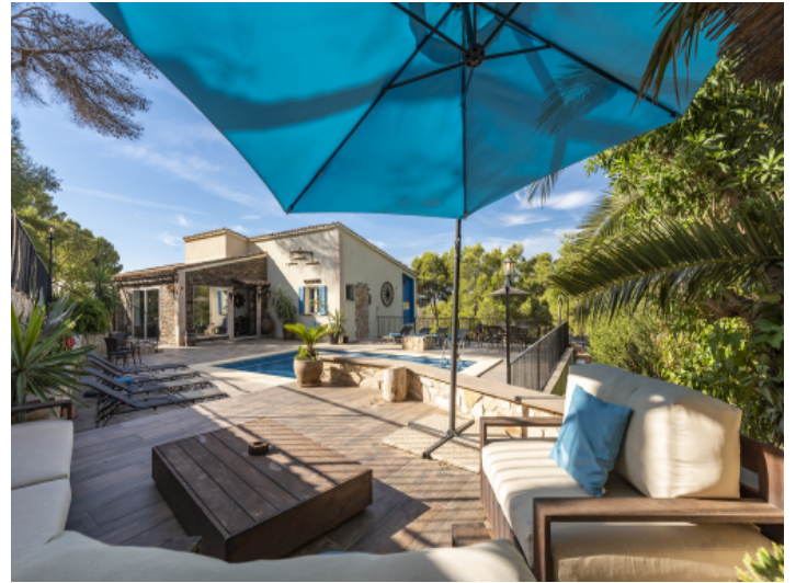
Einladender Poolbereich mit Sonnenliege