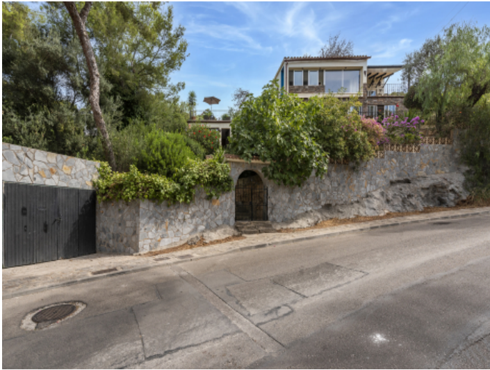
Frontansicht der Villa