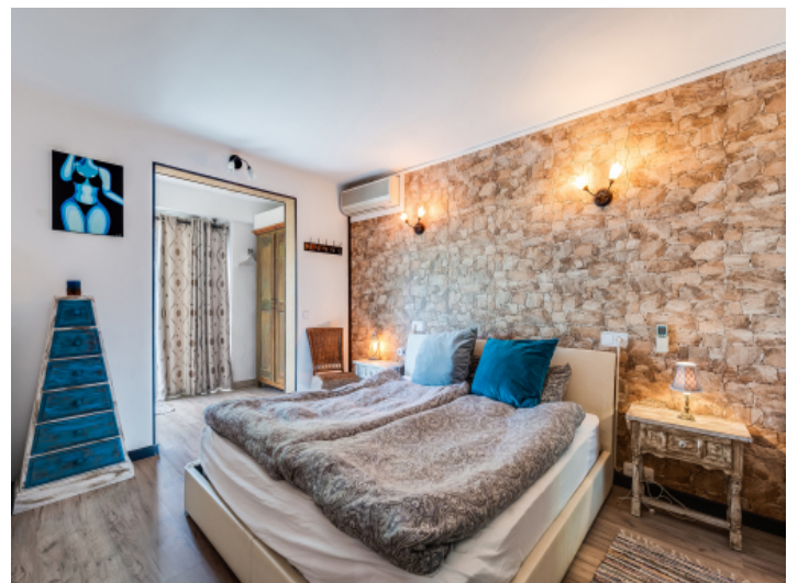
Eines von 3 Schlafzimmern im Haupthaus