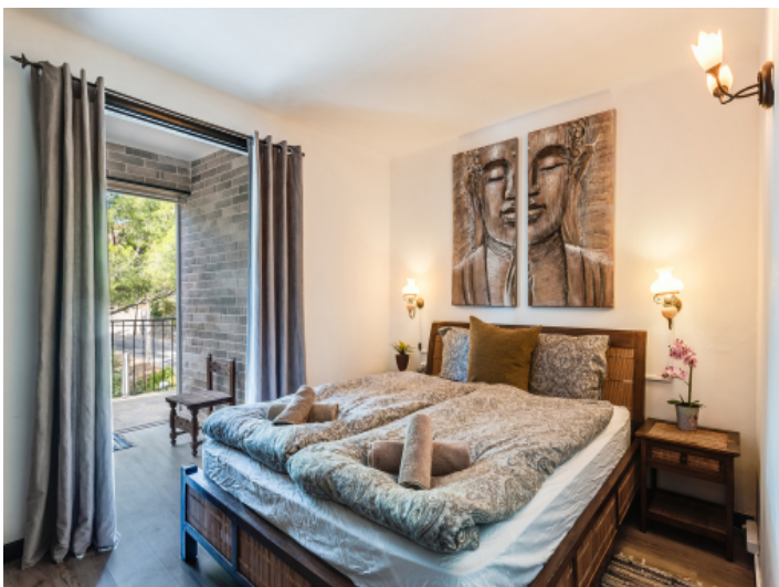
Eines von 3 Schlafzimmern im Haupthaus