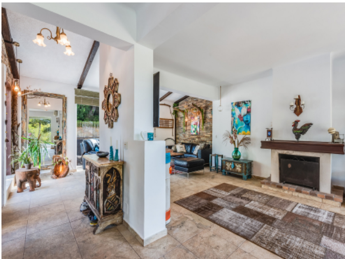
Der Wohnbereich verfügt über einen Kamin