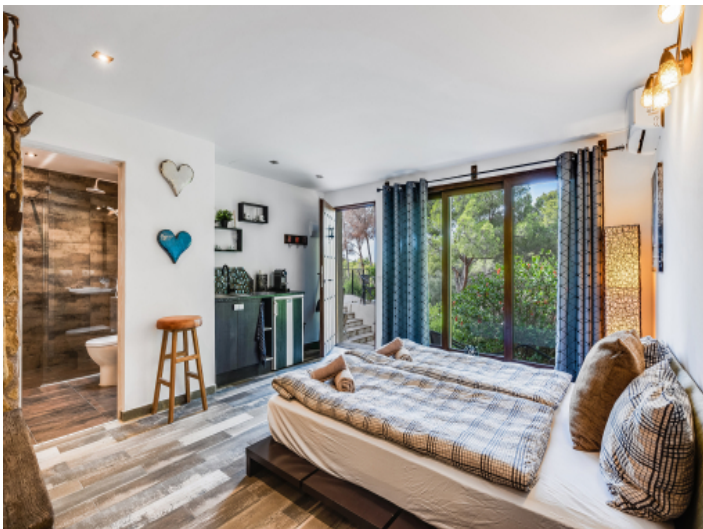
Apartment mit eigenem Badezimmer