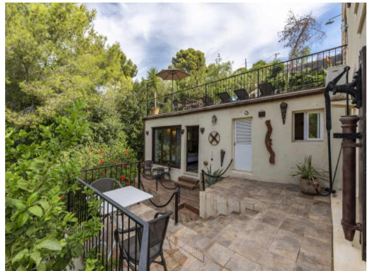
Zugang zum Apartment