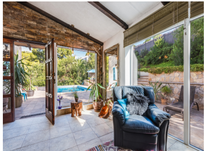
Blick zum Pool