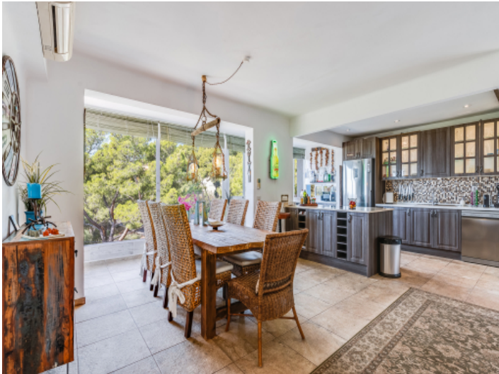
Küche und Essbereich