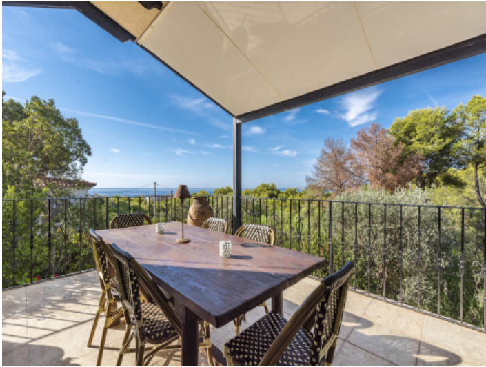
Essbereich mit Blick zum Meer