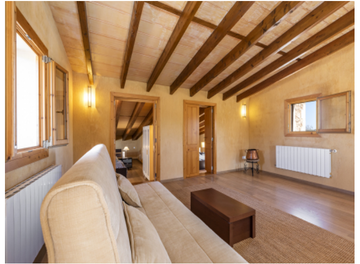
Wohnzimmer im Obergeschoss