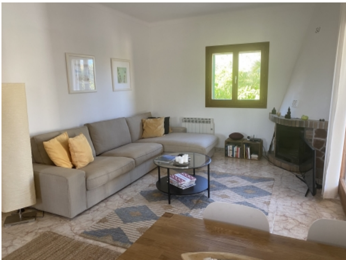
Gemütlicher Wohnbereich mit Kamin