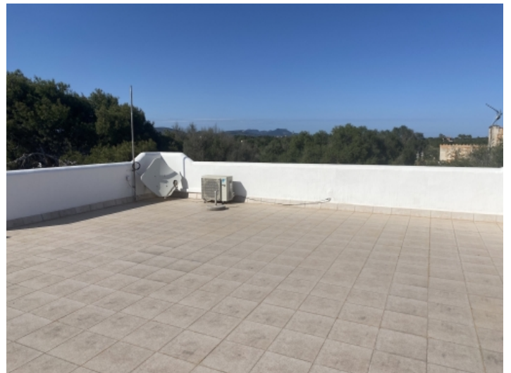
Grosse Dachterrasse mit Weitblick