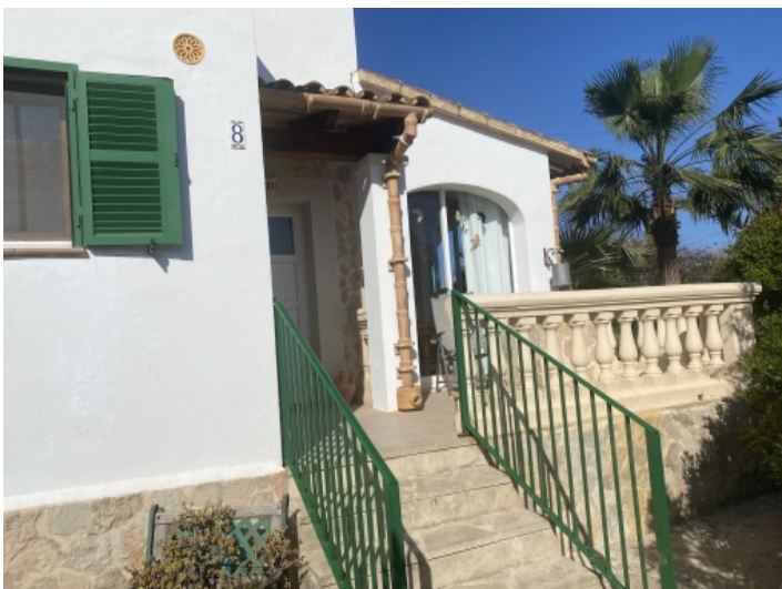
Blick zum Eingangsbereich