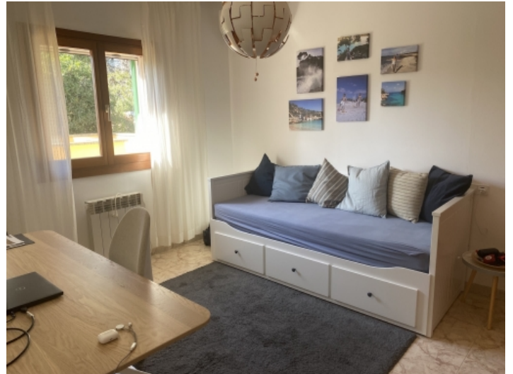
Eines von 2 Schlafzimmer