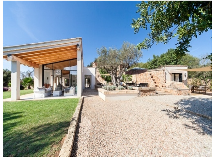
Blick vom Garten auf den fantastischen Wintergarten mit