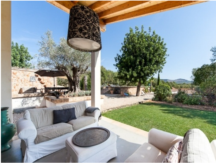
Loungebereich mit Blick in den Garten