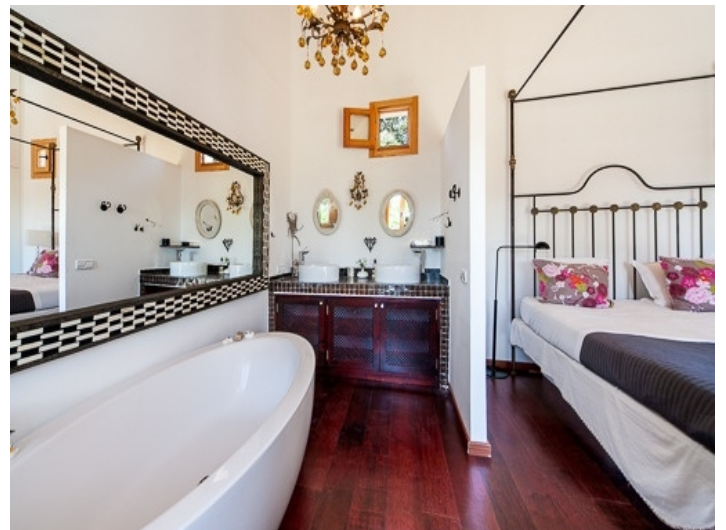
Helles Badezimmer mit Badewanne und Schlafzimmerzugang