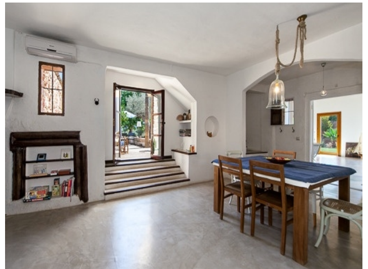
Großzügiger Essbereich mit Terrassenzugang