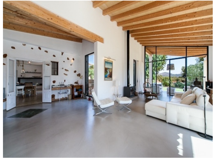
Wintergarten mit Panoramafenstern