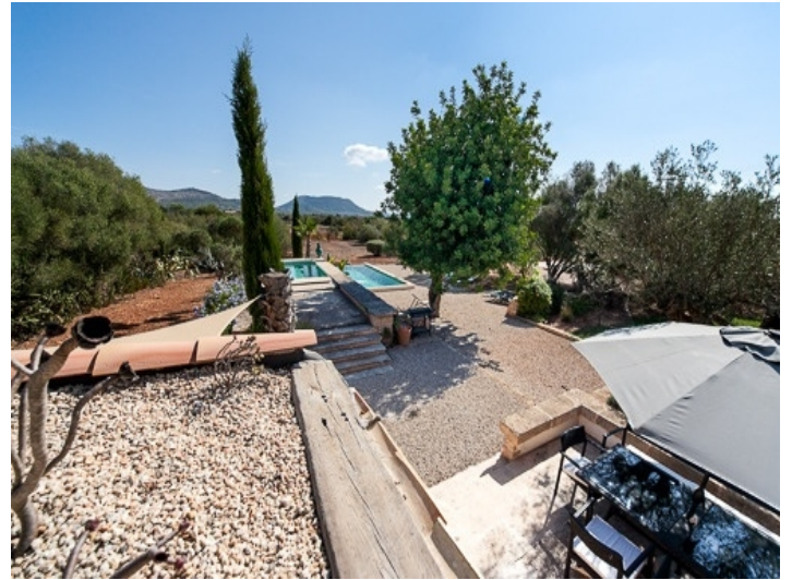
Beeindruckender Ausblick vom Balkon in den Garten