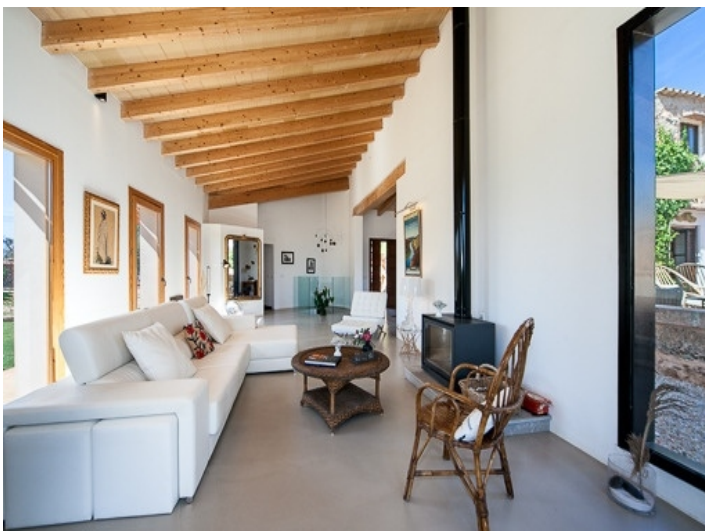
Schön gestalteter Wohnbereich mit Kamin