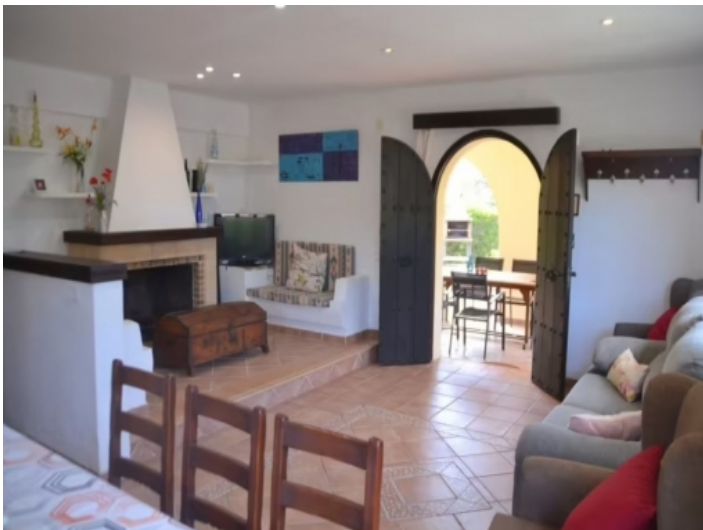
Eingang und Wohnbereich