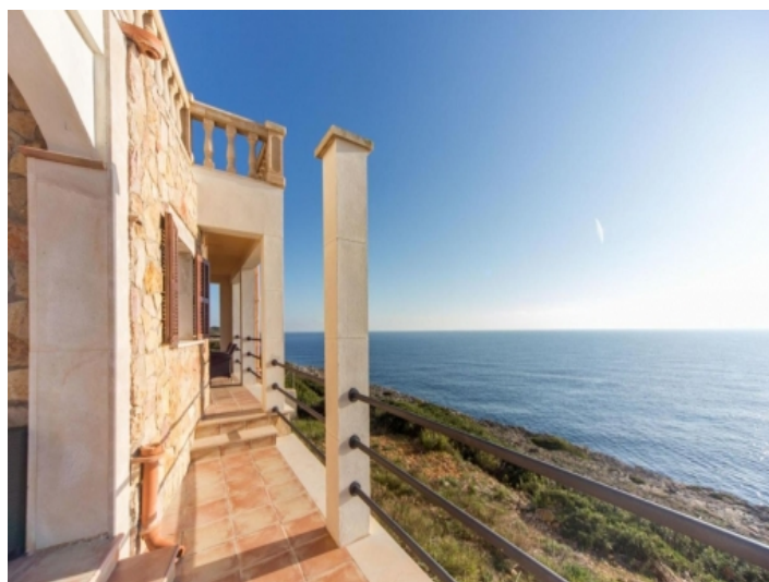
Direkt am Meer gelegen