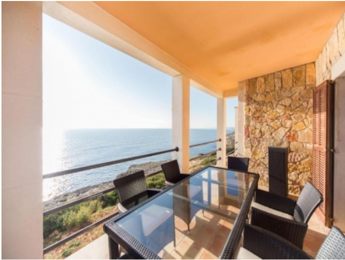
Terrasse in einzigartiger Lage