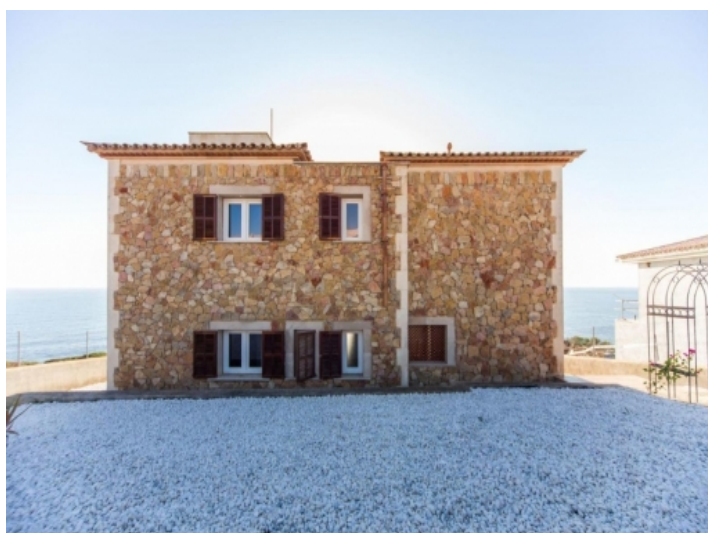
Rückansicht des Hauses