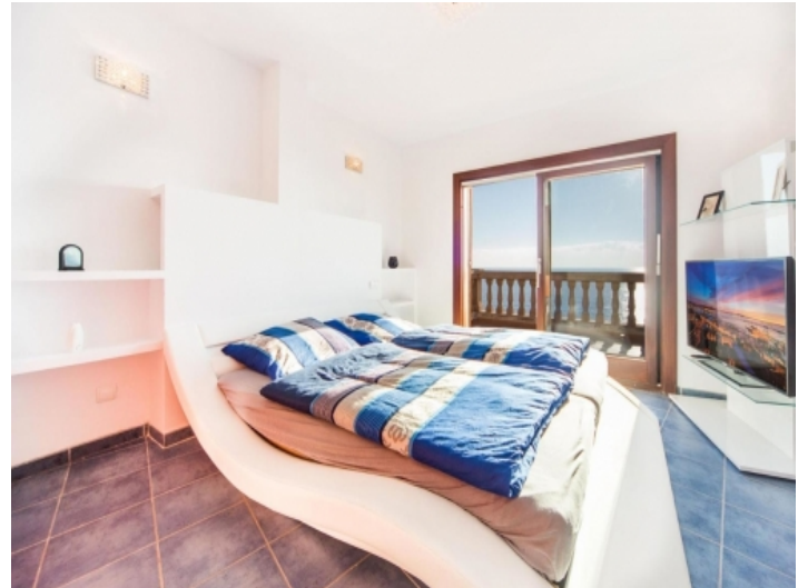
Schlafzimmer mit Meerblick