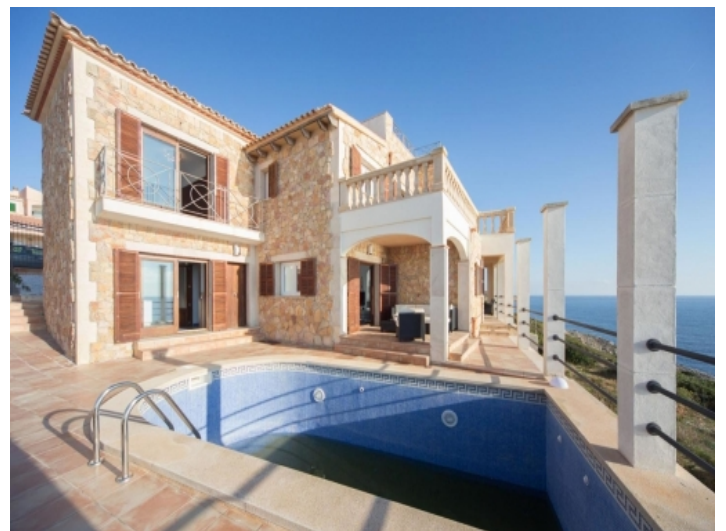
Außenansicht und Pool