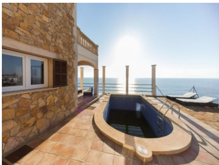
Pool in erster Meereslinie