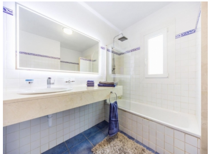
Eines von 3 Badezimmern