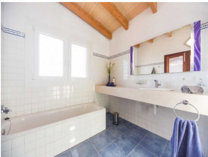
Eines von 3 Badezimmern