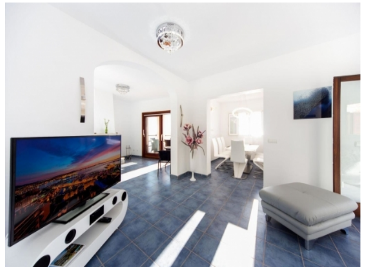
Blick zum Essbereich