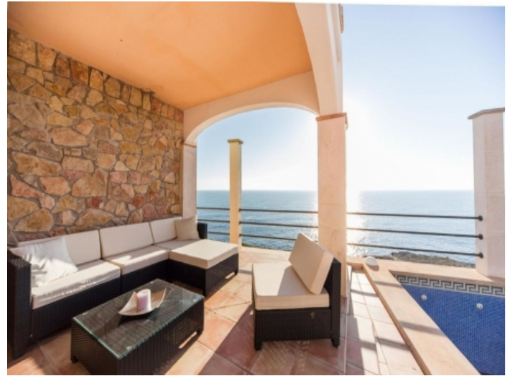
Loungeterrasse mit fantastischen Meerblick