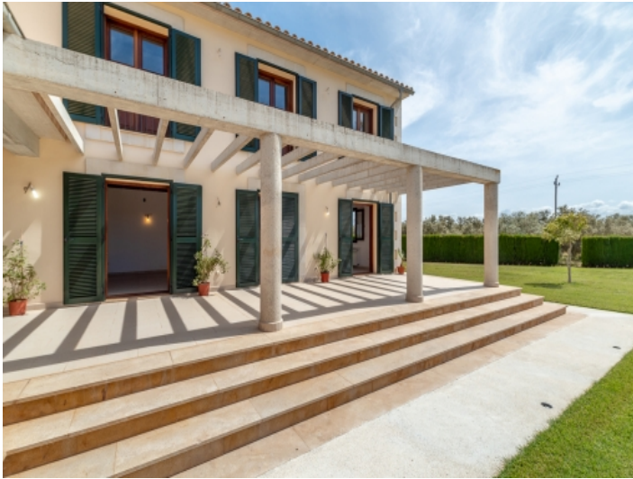
Ansicht der Terrasse