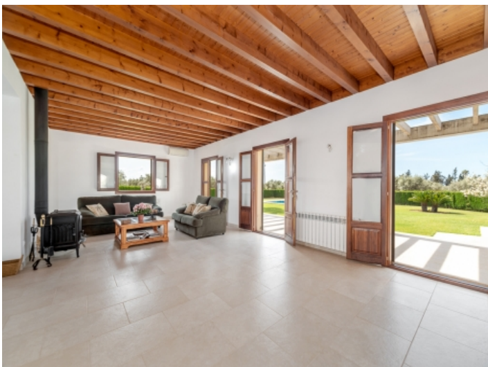
Wohnbereich mit Gartenzugang