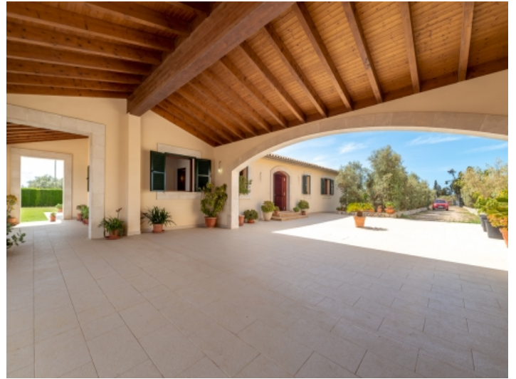
Große Frontterrasse und Zufahrt