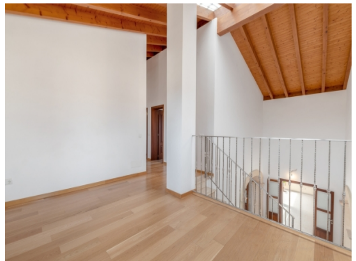
Moderne Galerie im Obergeschoss