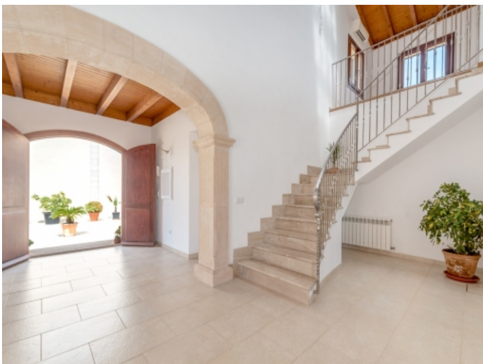
Große Eingangshalle mit Steinbogen