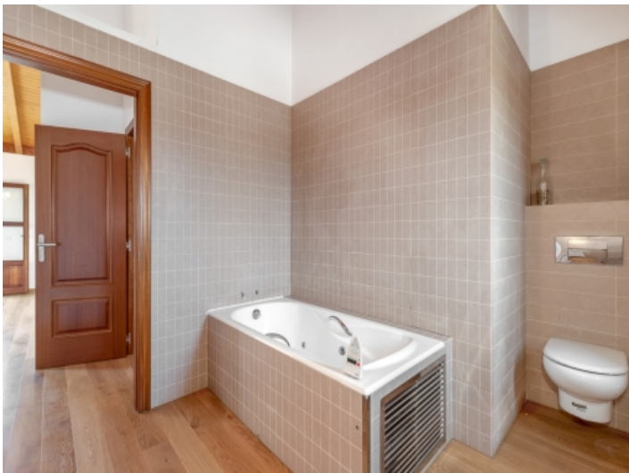
Badezimmer mit Wanne