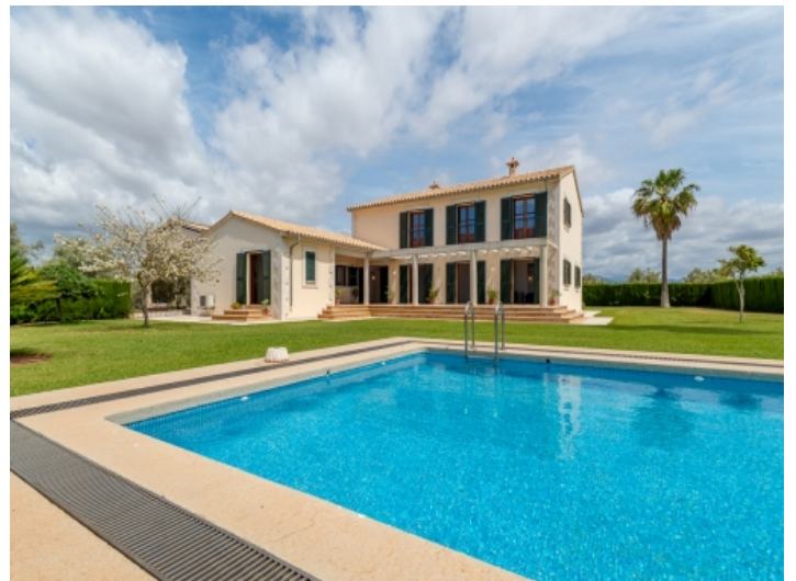
Außenansicht und Pool