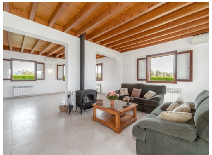
Großer Wohnbereich mit Kamin