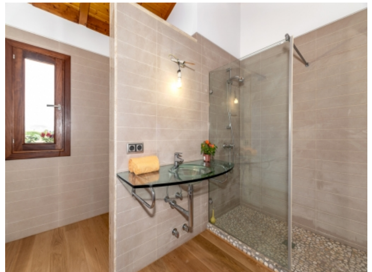
Eines von 4 Badezimmern