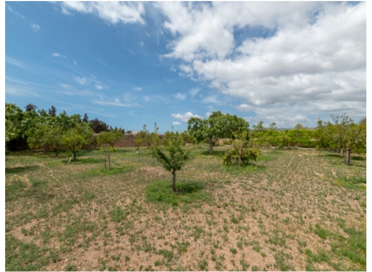
Großes Grundstück mit Obstbäumen