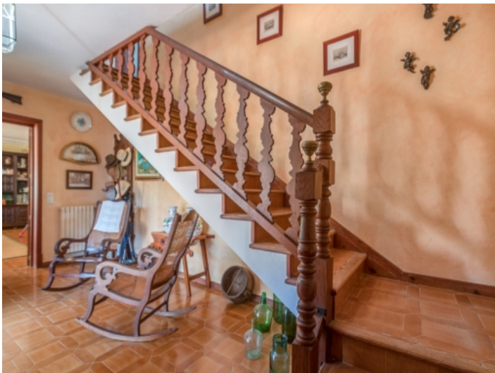
Treppe ins Obergeschoss