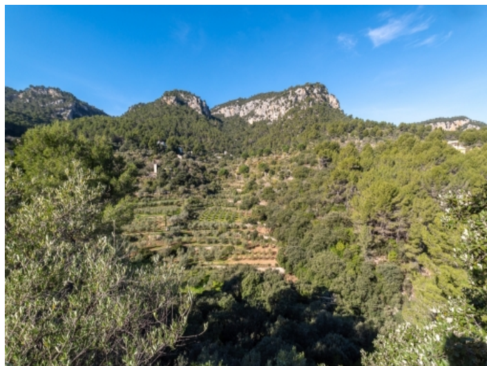
Herrlicher Blick auf die Berge