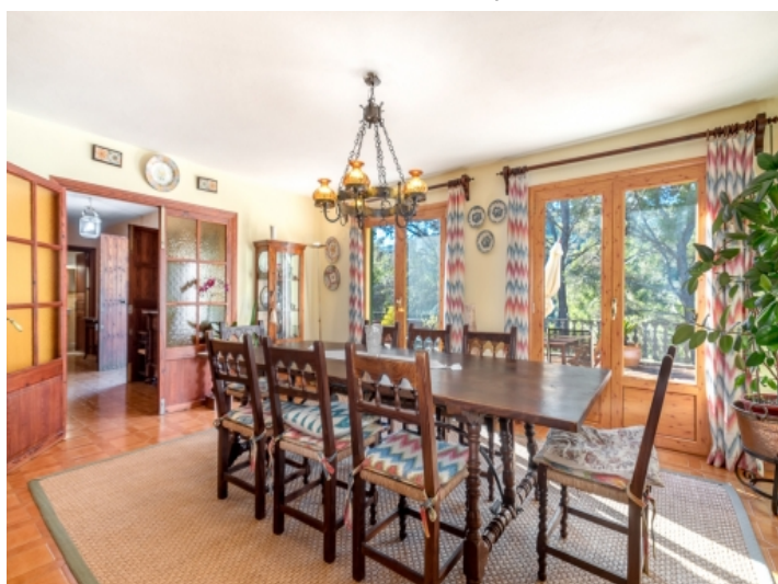
Rustikaler Essbereich mit Terrassenzugang