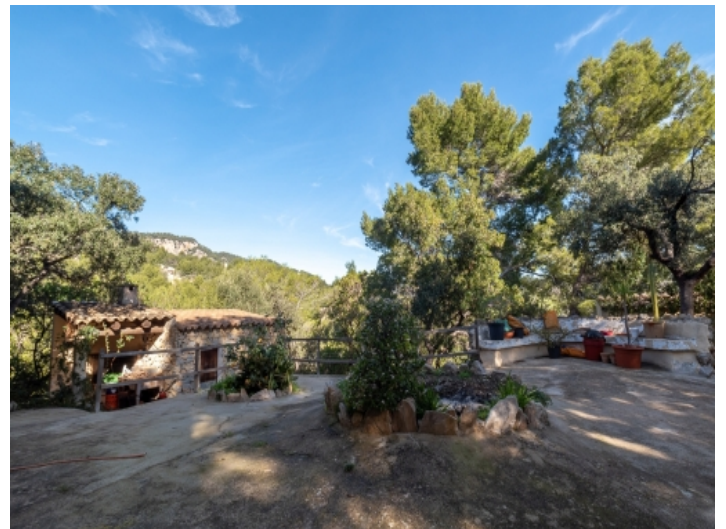
Sehr privater Außenbereich