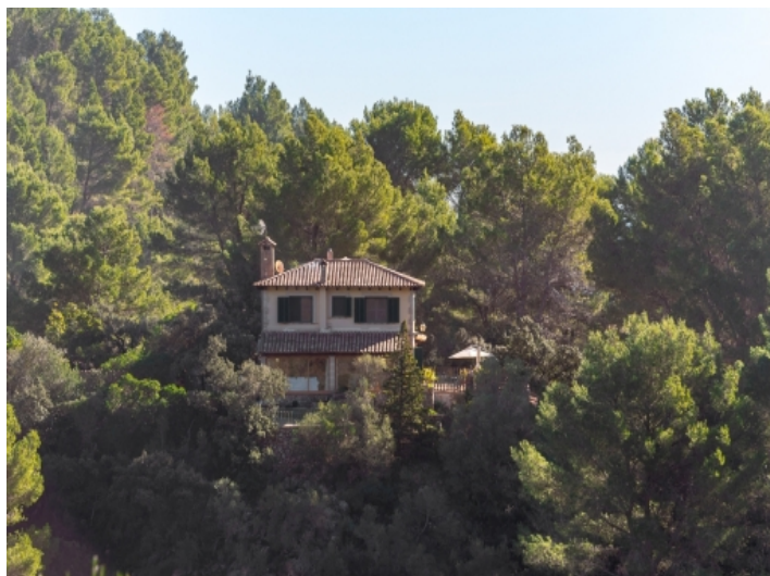
Finca inmitten von Natur