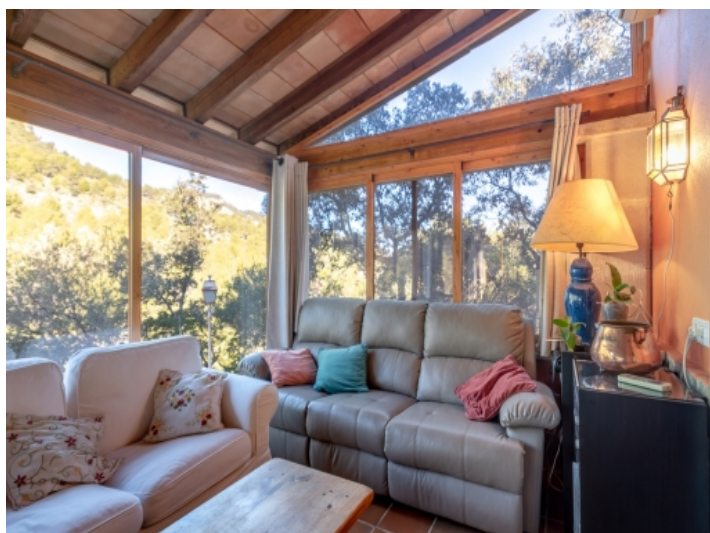
Sitzbereich im Wintergarten