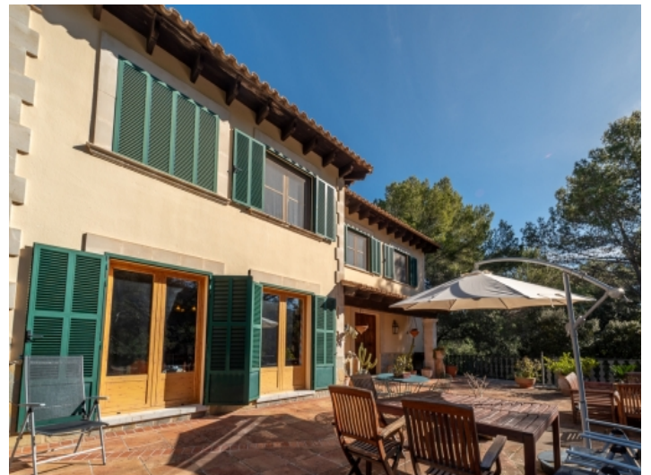
Große, sonnige Terrasse