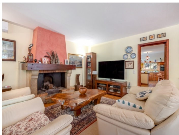
Wohnbereich mit gemütlichen Kamin