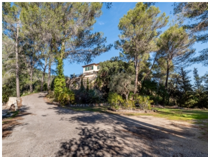
Zufahrt zur Finca