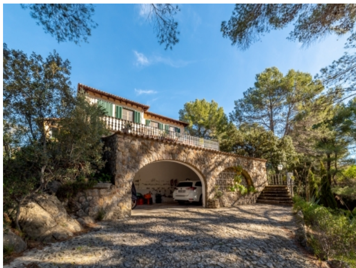
Außenansicht und Garage