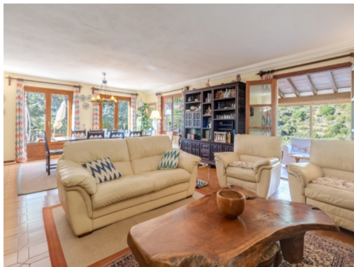
Lichtdurchfluteter Wohn-und Essbereich