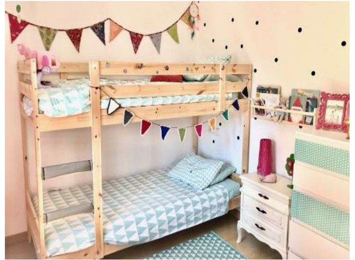
Eines von 3 Schlafzimmern