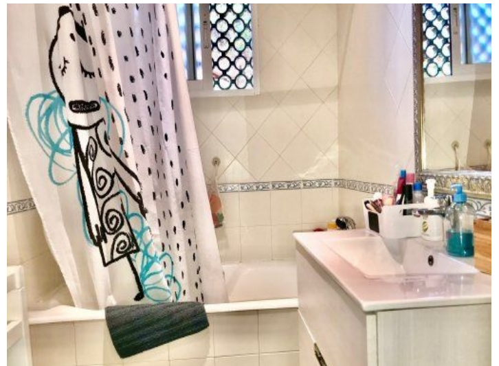
Badezimmer mit Badewanne