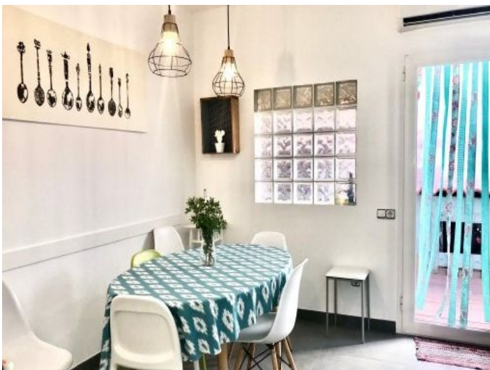
Essbereich der Küche