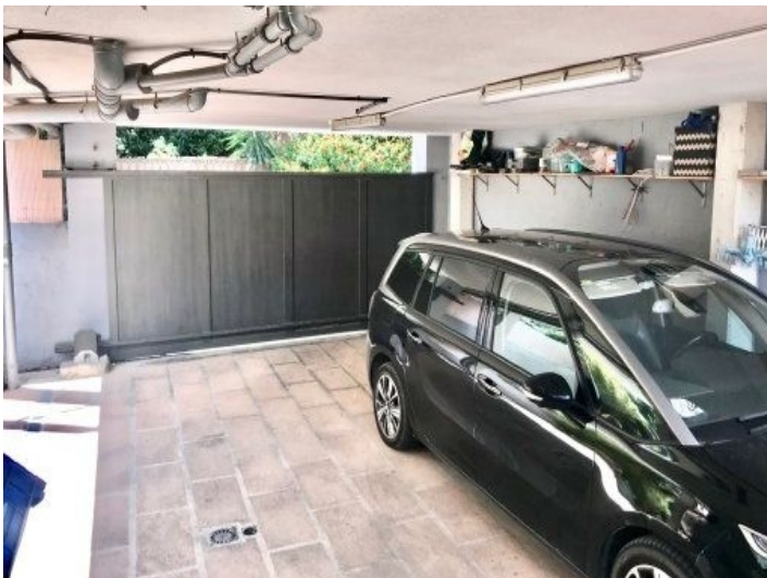
Garage des Hauses