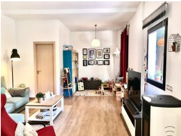
Alternative Ansicht des Wohnbereichs