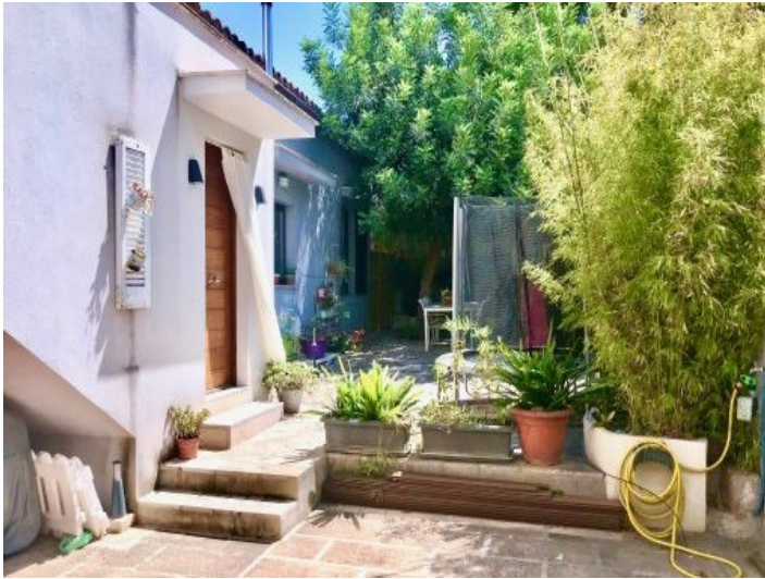
Außenansicht des Hauses