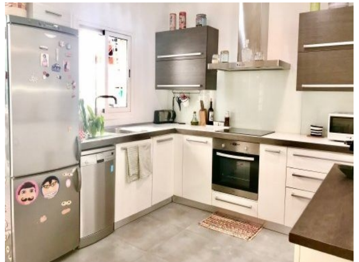
Voll ausgestattete Küche