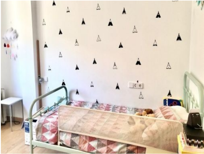
Eines von 3 Schlafzimmern