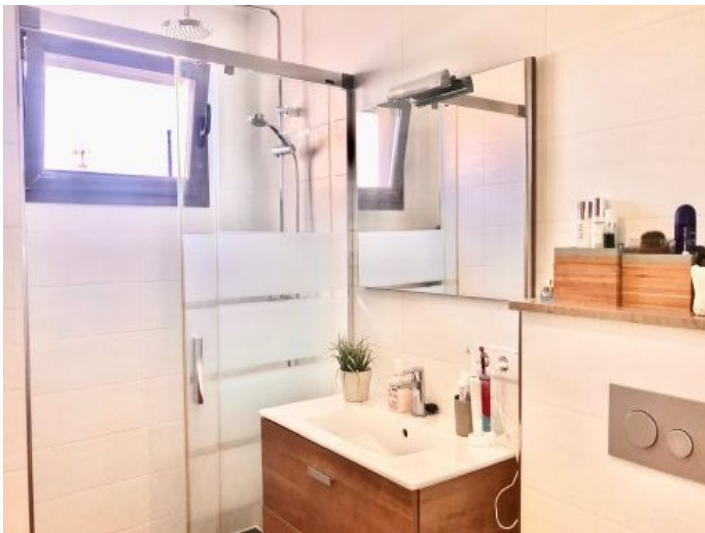
Badezimmer mit Dusche