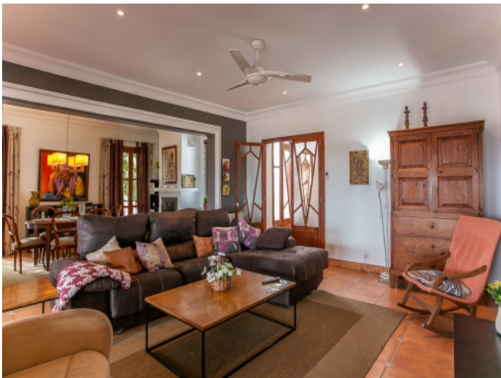
Offener Wohn-und Essbereich