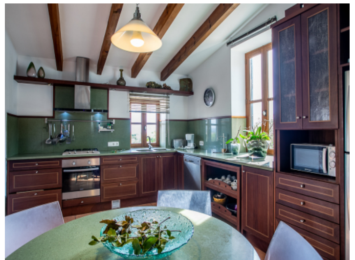
Herrliche Küche mit Essbereich