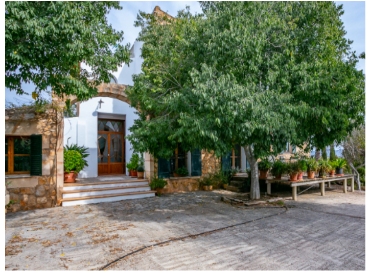
Zugang zur charmanten Finca