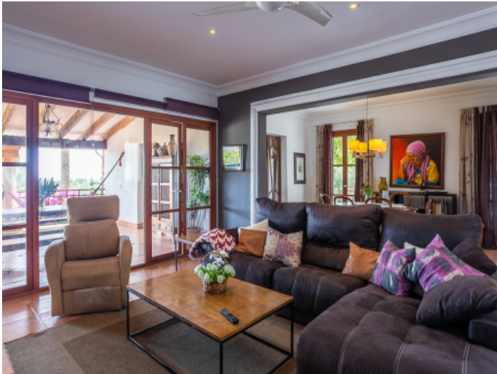
Wohnbereich mit direkten Terrassenzugang