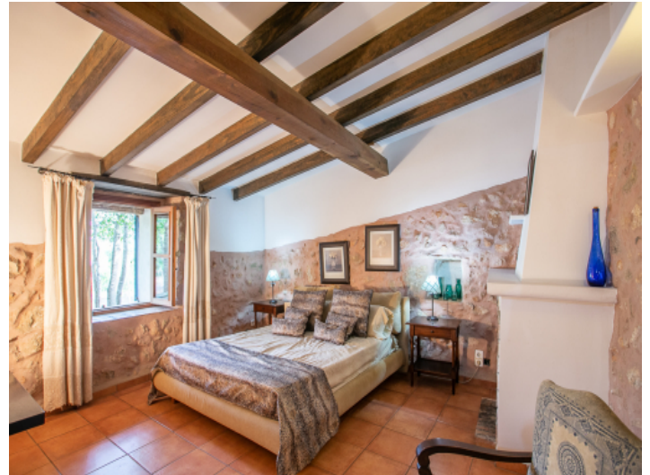
Authentisches Schlafzimmer mit Sandsteinwand