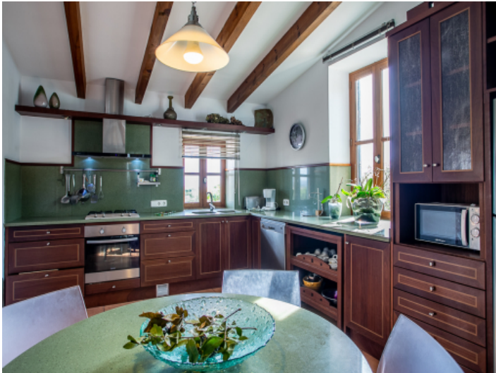
Herrliche Küche mit Essbereich