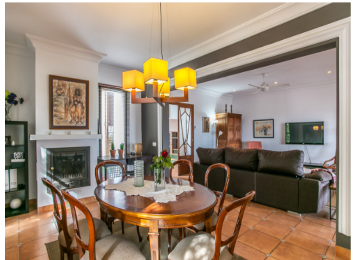
Schöne Essbereich mit Kamin