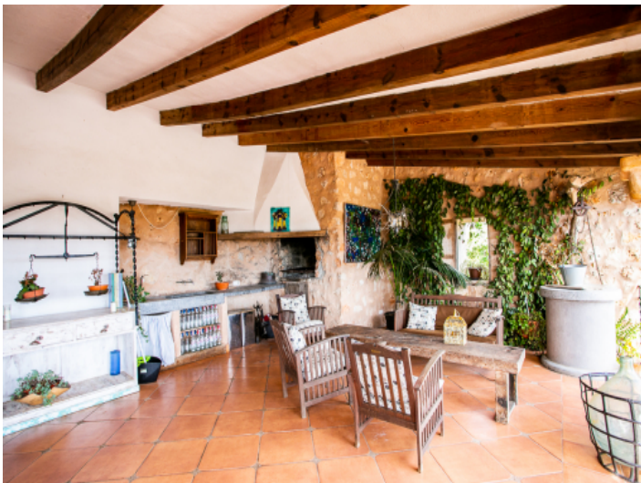
Große, überdachte Terrasse mit Grill