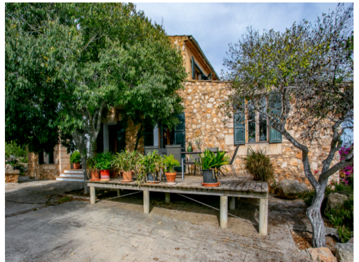
Idyllische Terrasse auf der Vorderseite