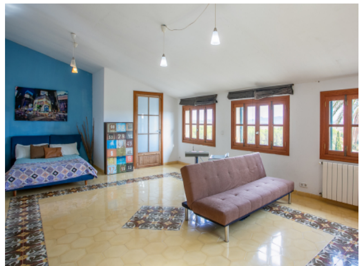
Großes Schlafzimmer im Obergeschoss