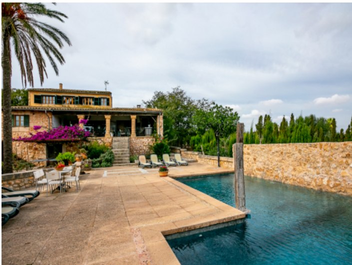
Schöner Terrassen-und Poolbereich