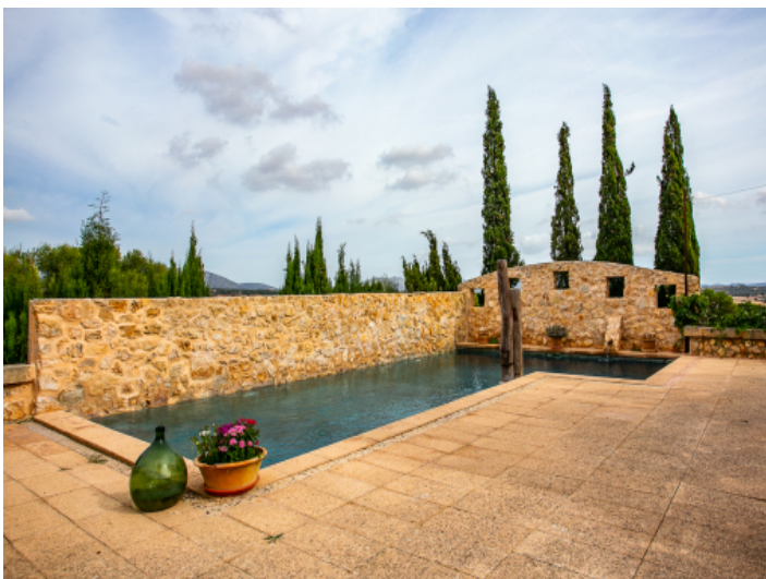
Sehr privater Poolbereich