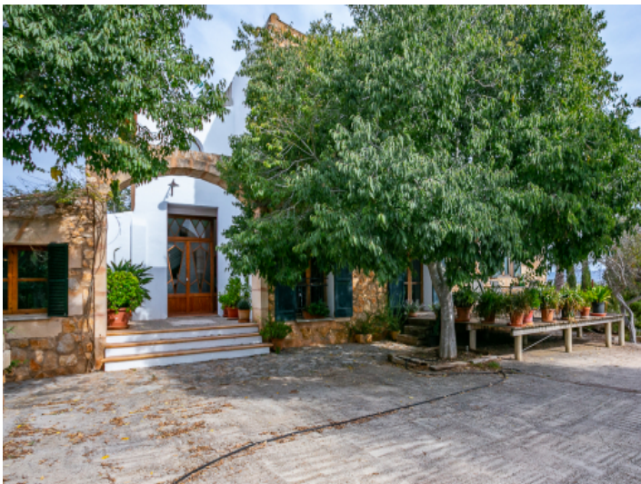
Zugang zur charmanten Finca