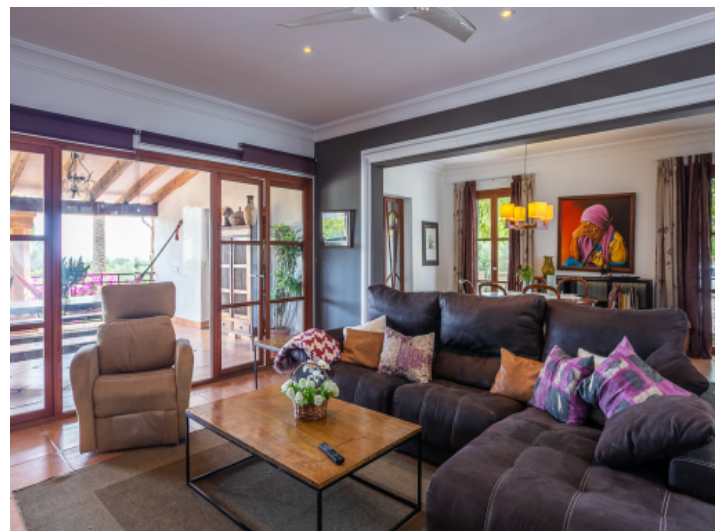
Wohnbereich mit direkten Terrassenzugang