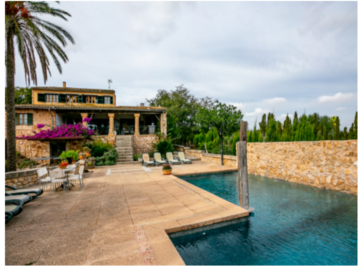
Schöner Terrassen-und Poolbereich