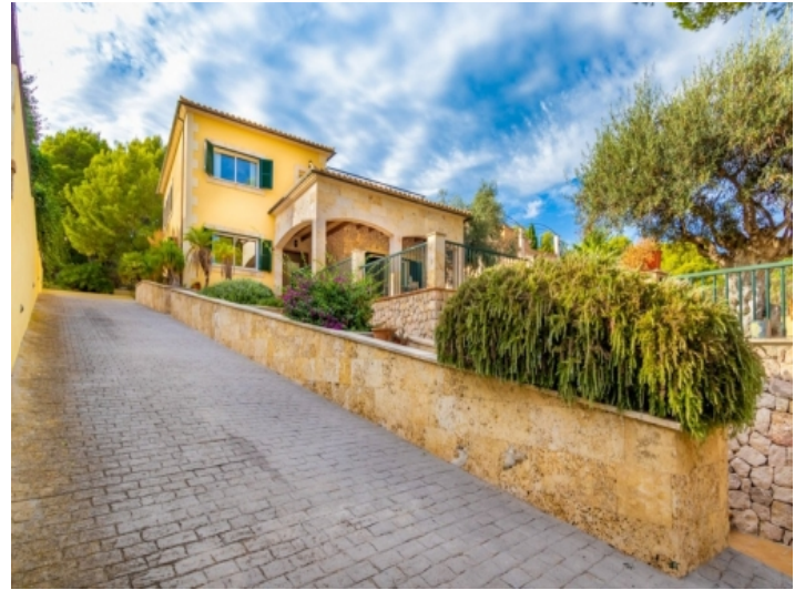
Außenansicht des Hauses