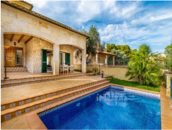
Ansicht des Poolbereichs