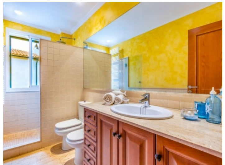
Eines von 3 Badezimmern