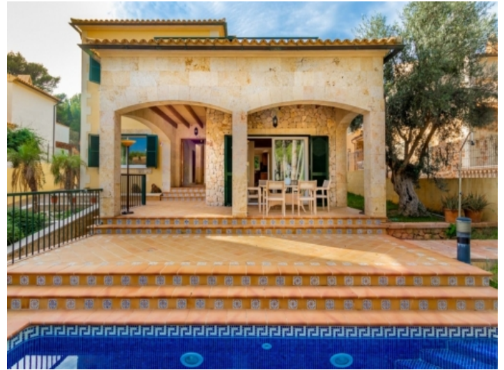
Außenansicht des Hauses