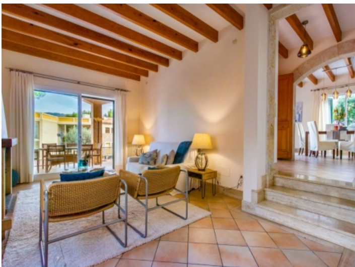
Blick zum Essbereich