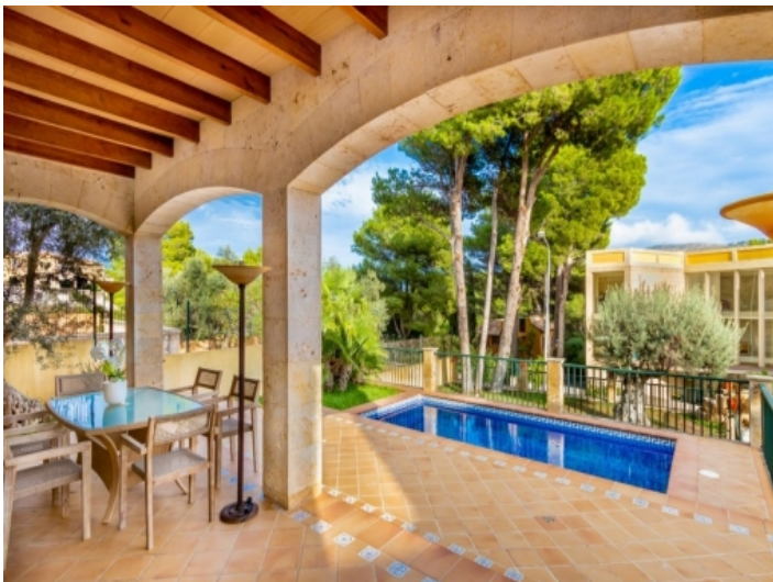
Blick über den Pool