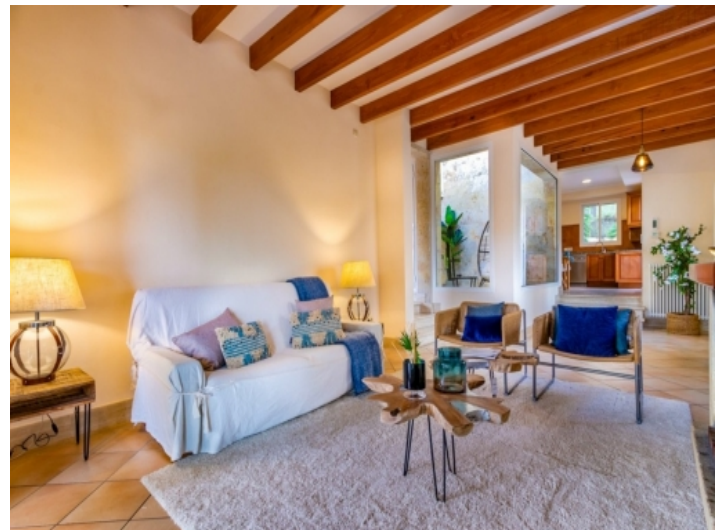
Alternativ Ansicht des Wohnbereichs