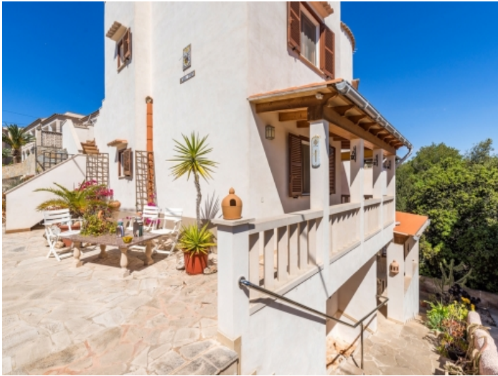
Außenansicht des Anwesens