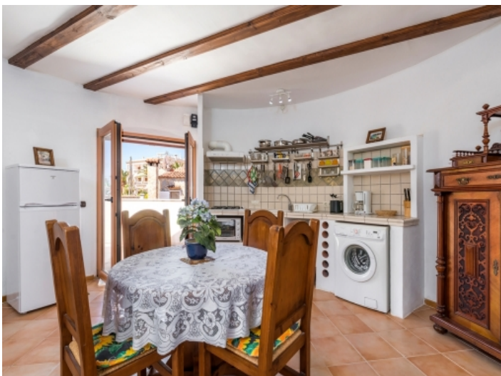
Essbereich und offene Küche