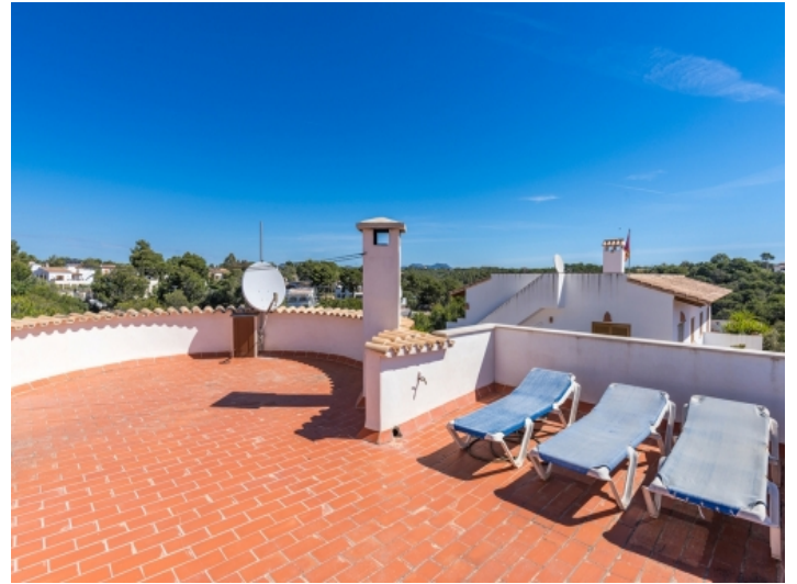
Dachterrasse mit Panoramablick