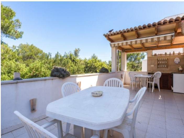
Terrasse mit Außenküche