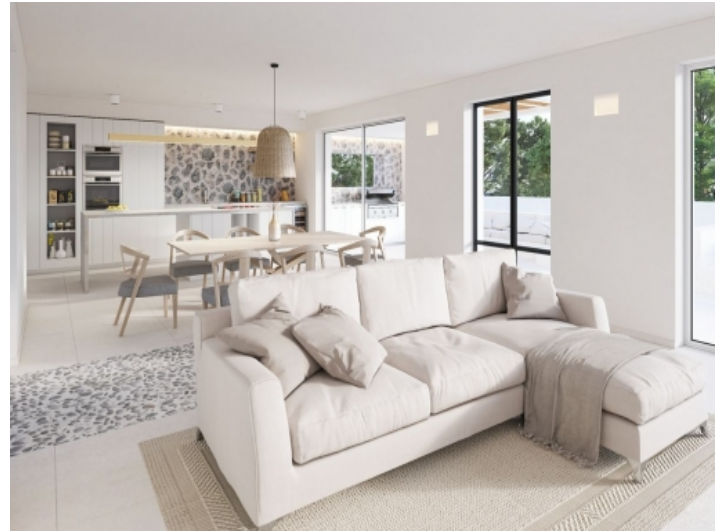
Wohn- und Essbereich mit offener Küche