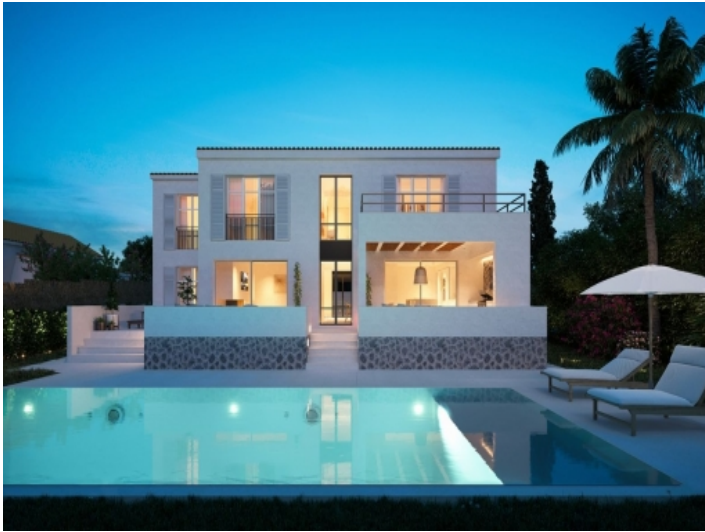
Großzügiger Poolbereich mit Sonnenliegen