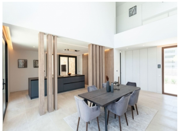
Essbereich mit offener Küche