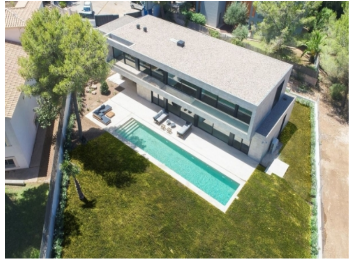
Vogelperspektive des Anwesens