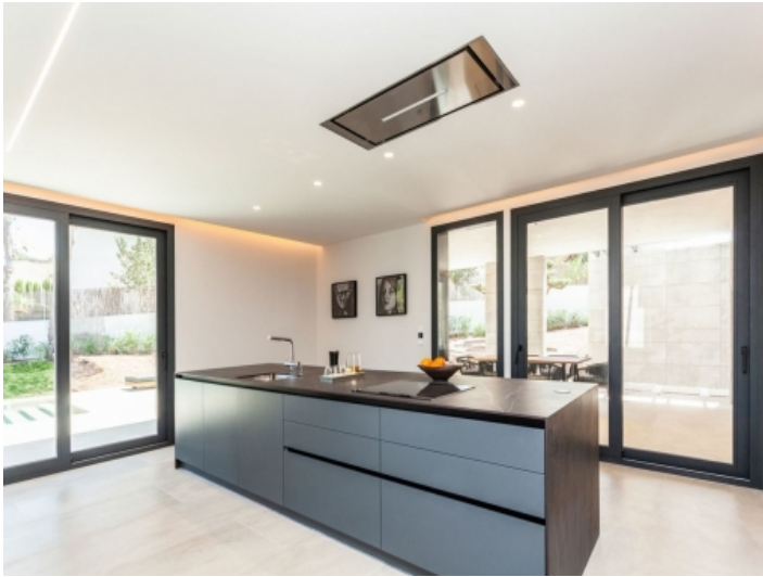
Küche mit Kochinsel