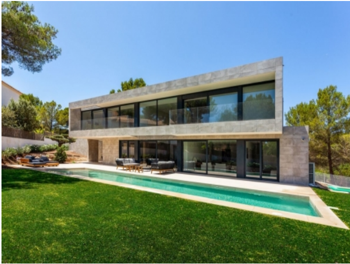
Außenansicht und Pool