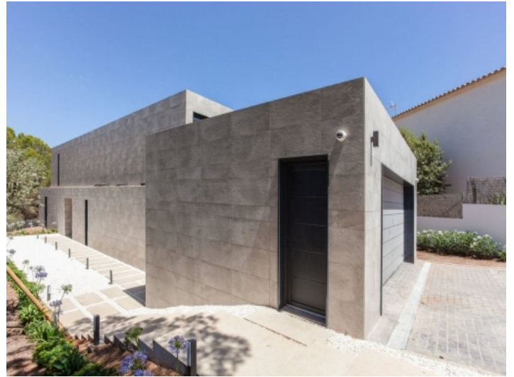
Eingang und Garage