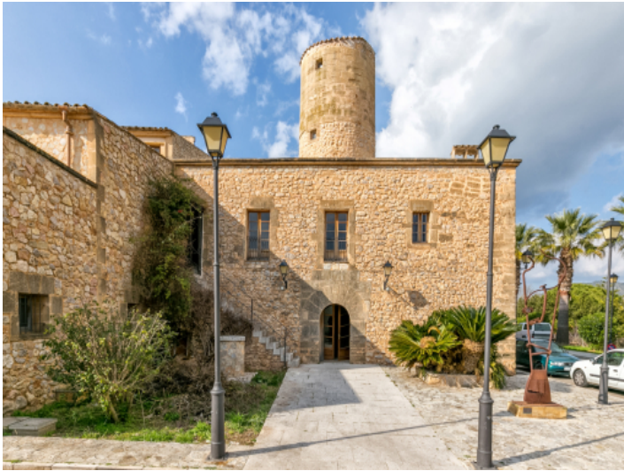
Außenansicht der Mühle