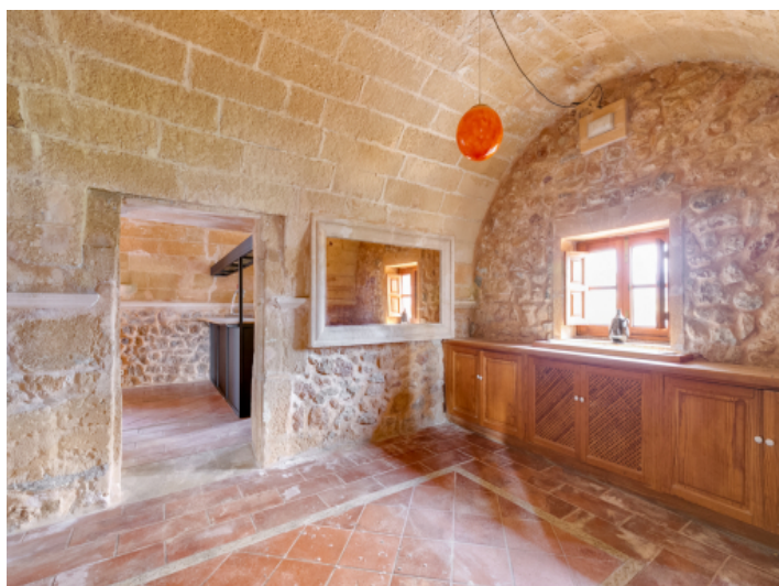
Weiterer Gastraum und Barbereich