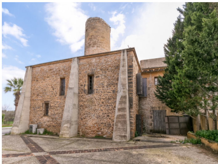
Es gibt ausreichend Sitzmöglichkeiten im Außenbereich