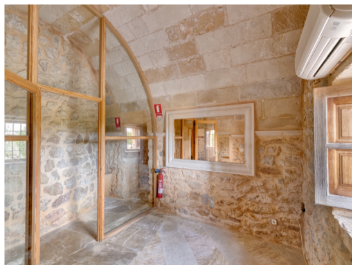
Lagerraum mit Klimaanlage