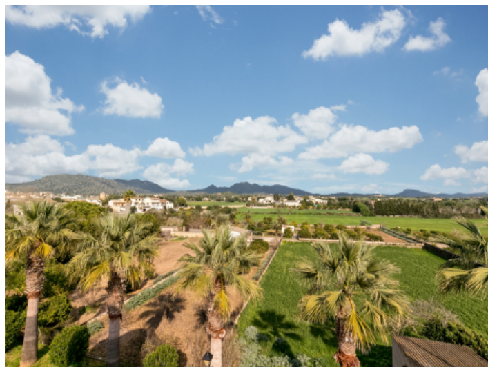
Traumhafter Panoramablick von der Dachterrasse