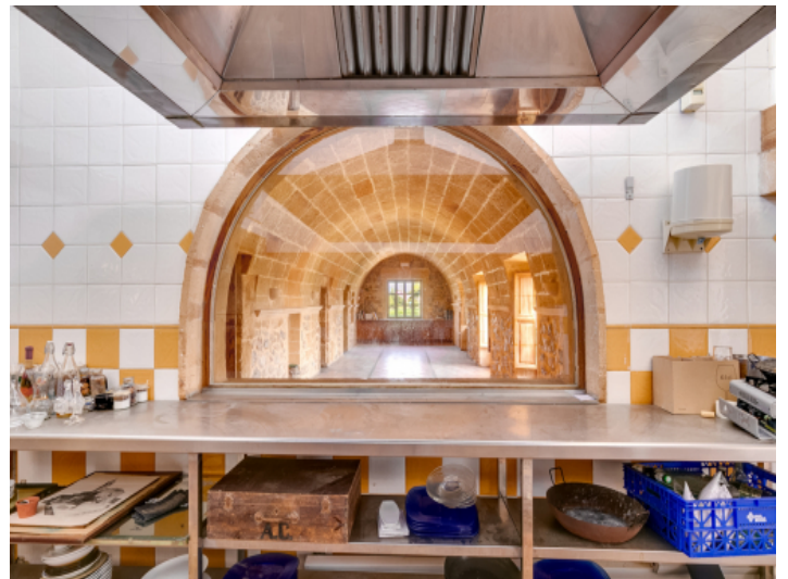
Fantastischer Blick von der Küche in den Gastraum