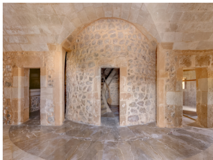
Eine Umwandlung zu einem eindrucksvollen Wohnhaus ist möglich