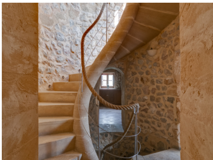
Alternative Ansicht des Mühlenturms