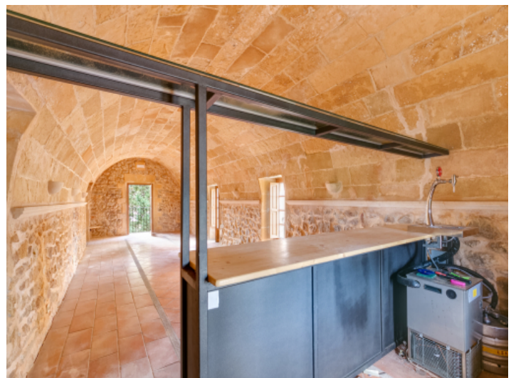
Hervorragende und spezielle Location für ein Restaurant