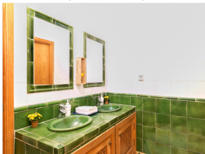
Toilettenraum mit Doppelwaschbecken