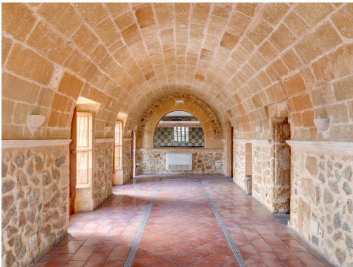
Schöner Gastraum mit Blick zu Küche