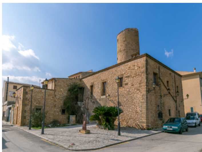
Außenansicht der Mühle