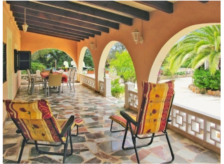
Überdachte Terrasse mit Blick in den Garten