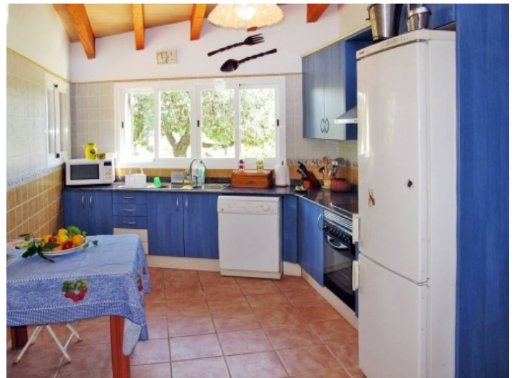
Voll ausgestattete Küche