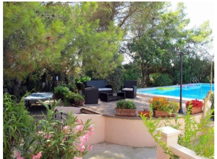
Loungebereich neben dem Pool