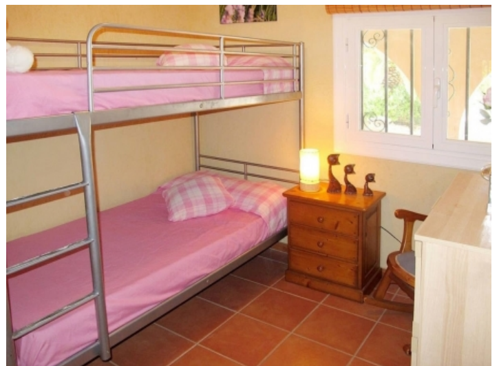
Schlafzimmer mit Hochbett