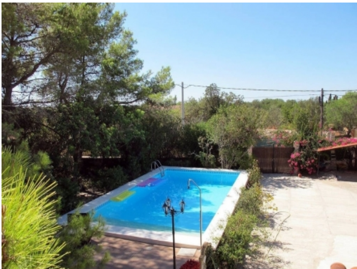
Pool im Garten