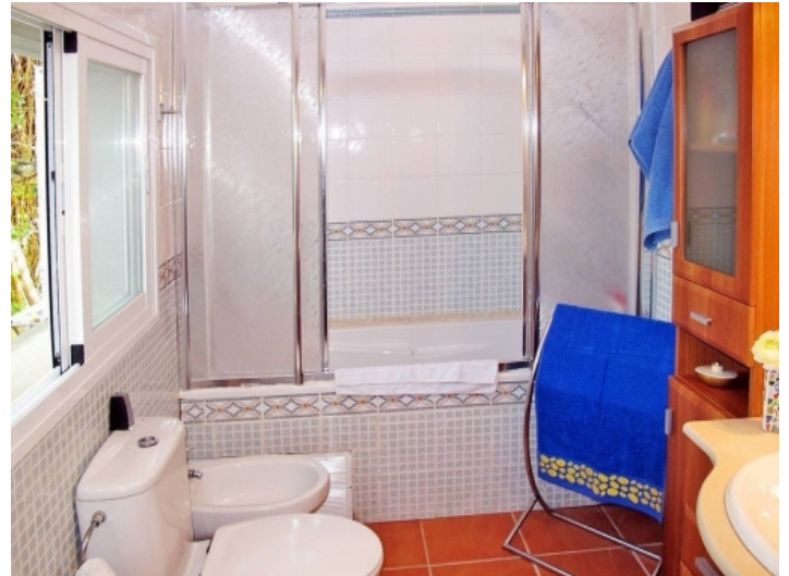
Badezimmer mit Badewanne