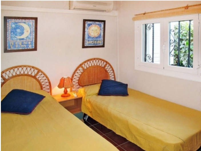
Das dritte Schlafzimmer