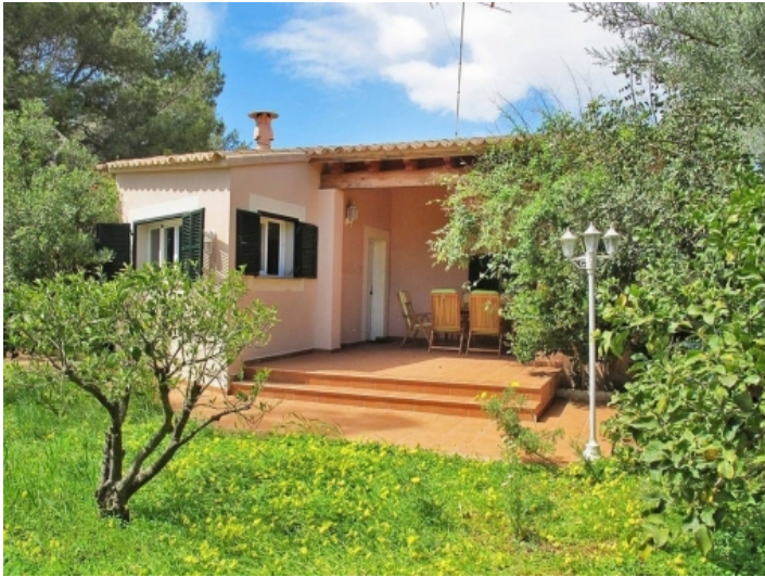
Ein idyllischer Garten umgibt die Finca