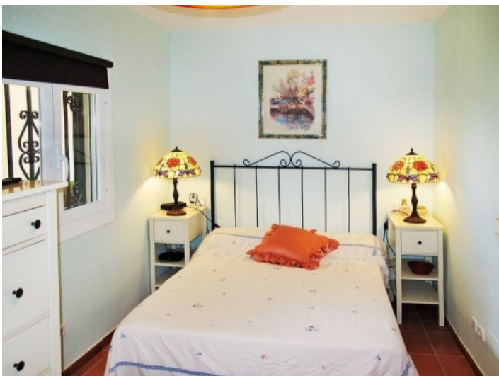
Schlafzimmer mit Doppelbett