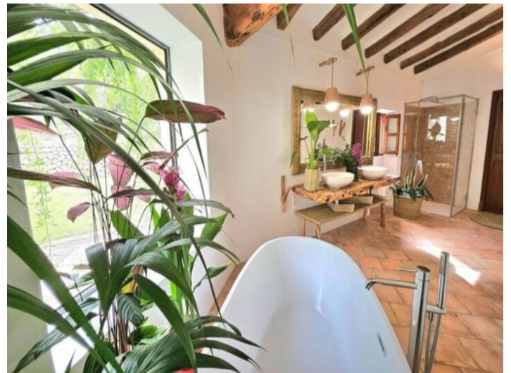
Rustikales Badezimmer mit Naturstein und Holzdetails