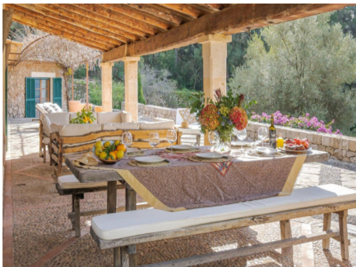
Überdachte Terrasse mit Esstisch und mediterranem Ambiente