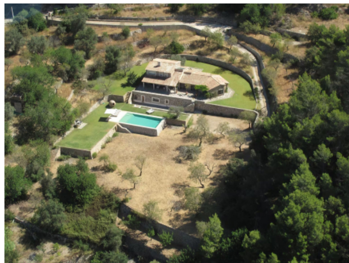
Exklusive Finca mit großem Garten und Pool eingebettet in