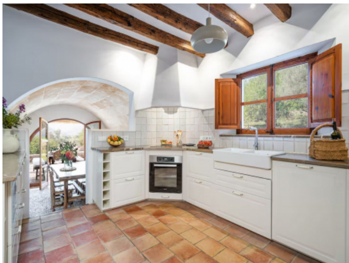
Helle Landhausküche mit Holzbalken, Terrakottaboden und