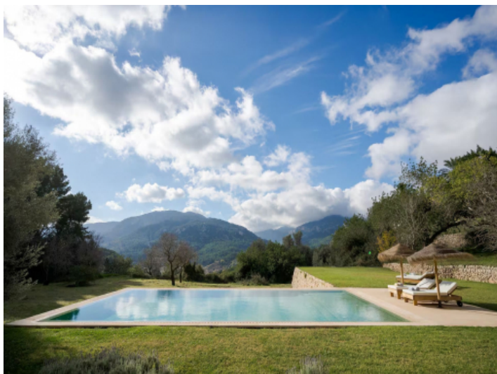
Salzwasser Infinity Pool mit Panoramablick auf die Berge der