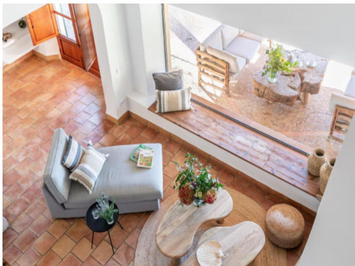
Gemütliche Lounge mit Panoramafenster und Blick auf die