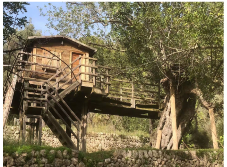
Abenteuer für Kinder im Baumhaus