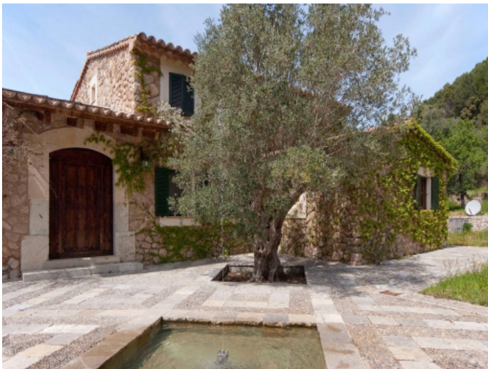
Vorderseite der Finca mit Springbrunnen