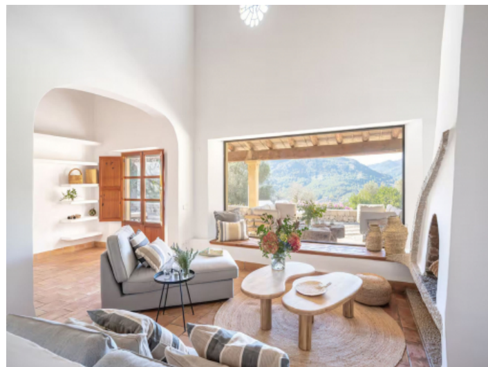
Gemütliche Lounge mit Panoramafenster und Blick auf die Tramuntana