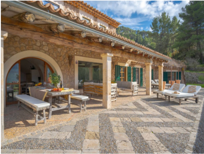
Überdachte Terrasse mit Esstisch und mediterranem Ambiente