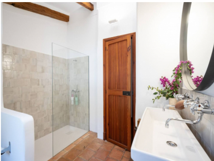
Eins von drei Badezimmern