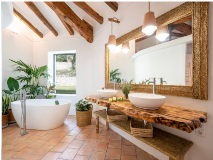
Modernes Badezimmer mit Badewanne und mallorquinischem