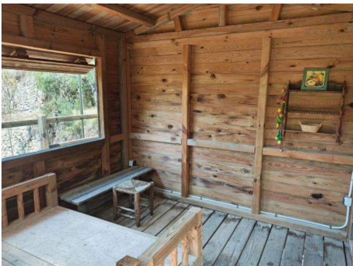
Abenteuer für Kinder im Baumhaus