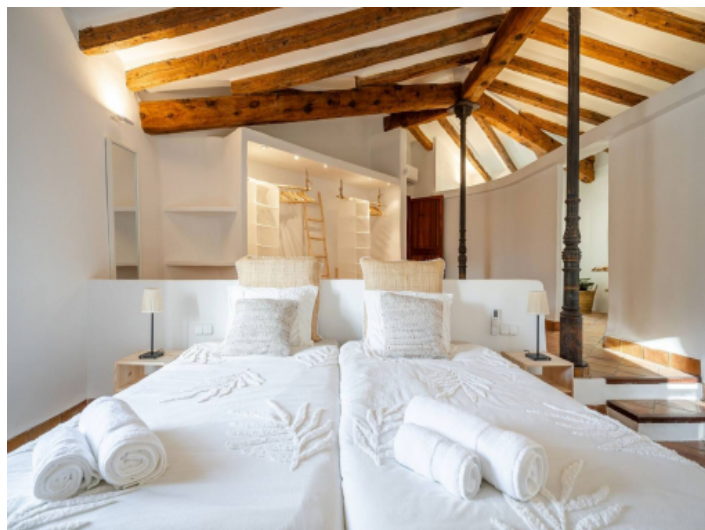
Eines der drei Schlafzimmer