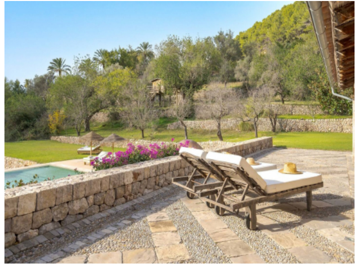
Poolbereich mit Sonnenterrasse unweit des Baumhauses