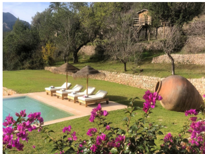
Poolbereich mit Sonnenterrasse