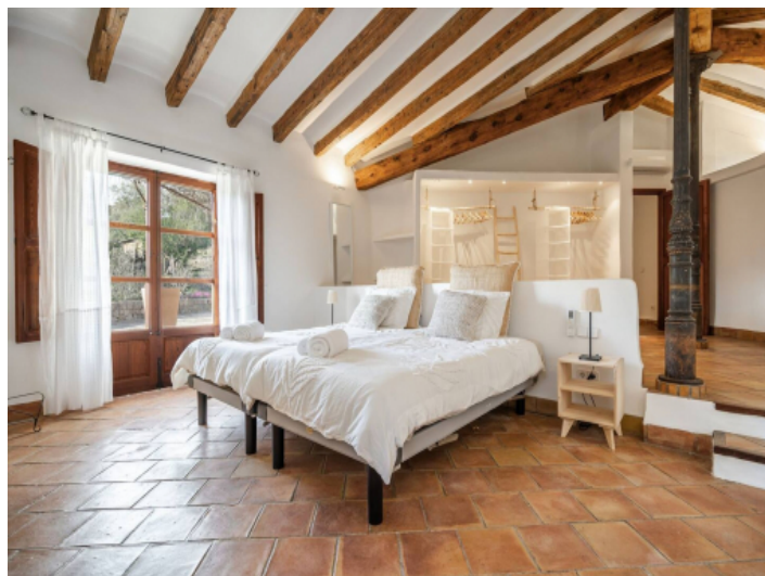
Eines der drei Schlafzimmer