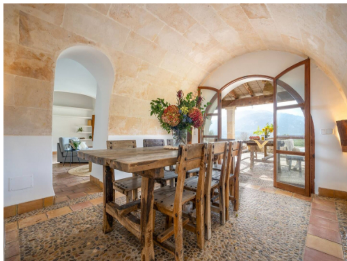
Elegantes Esszimmer mit Gewölbedecke und Bergblick