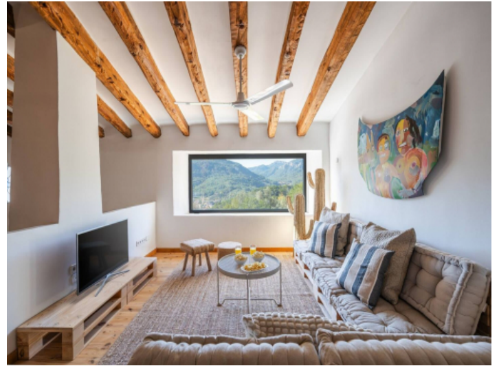
Gemütliche Wohnzimmer mit Panoramafenster und Blick auf