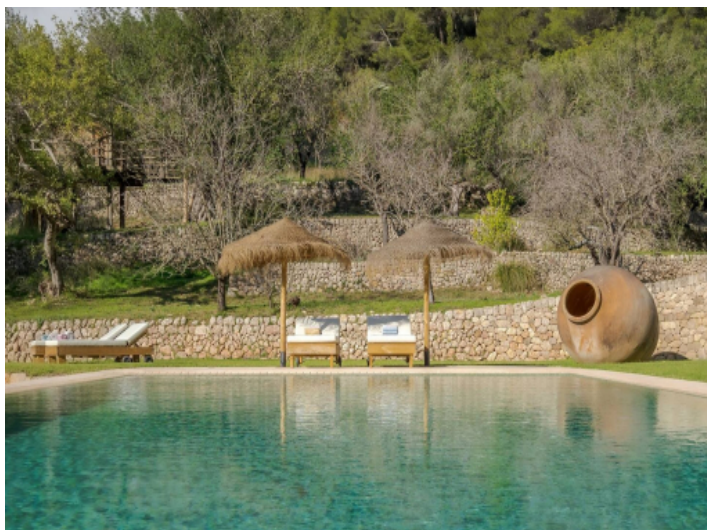
Sonnenterrasse mit Pool und gemütlichen Liegen in