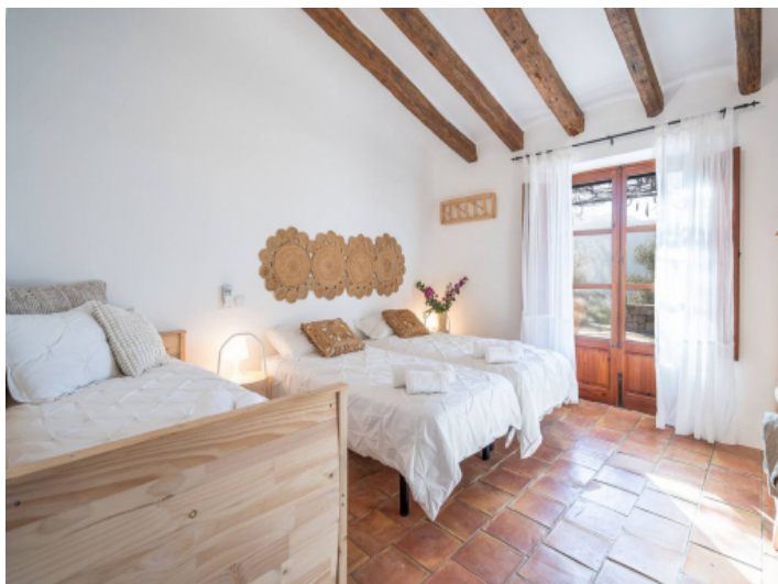
Eines der drei Schlafzimmer