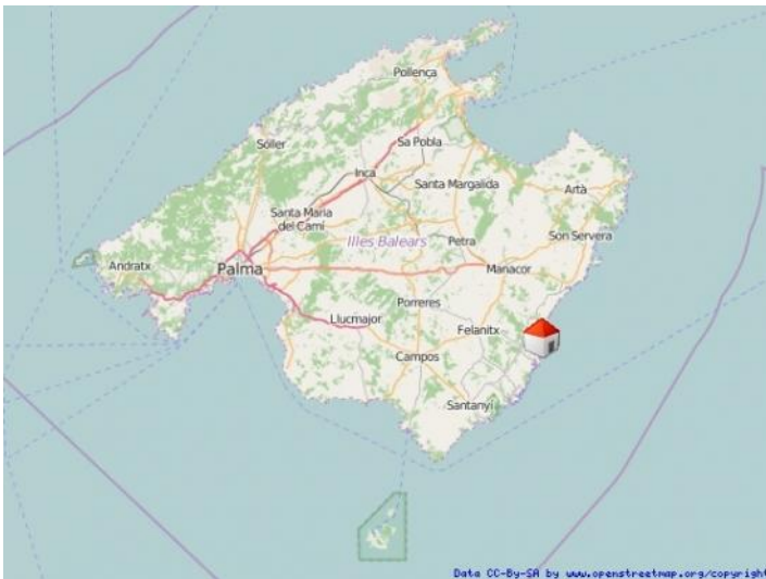
Cales de Mallorca