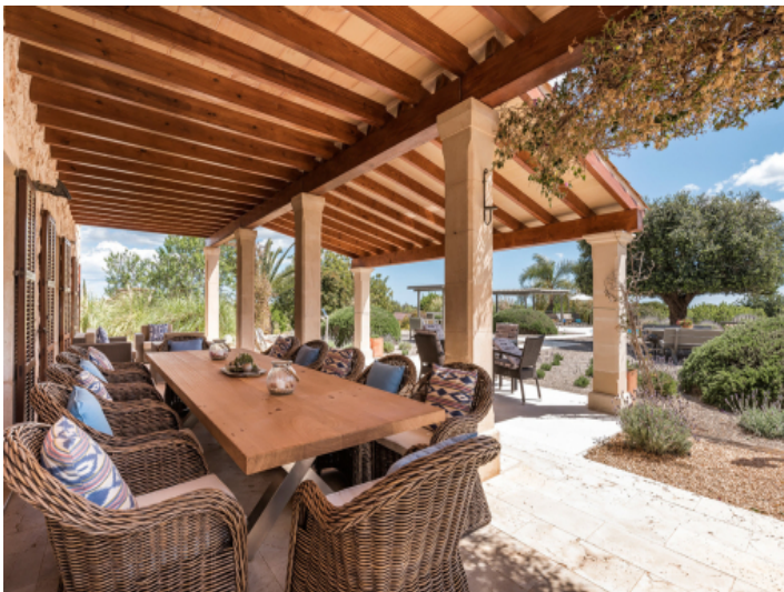
Idyllische Terrasse mit Essbereich