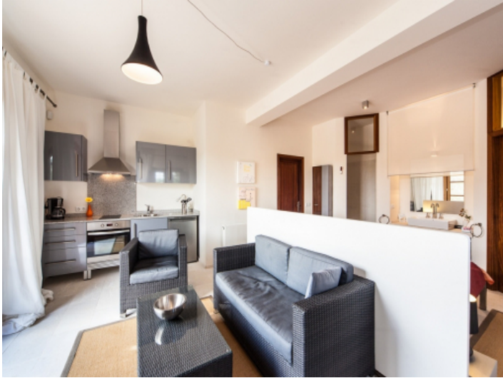
Offene Küche und Wohnbereich