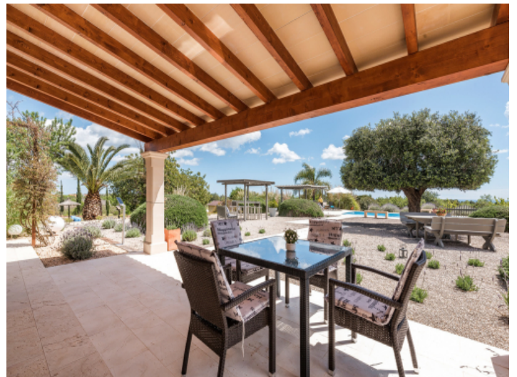
Blick auf den gepflegten Garten