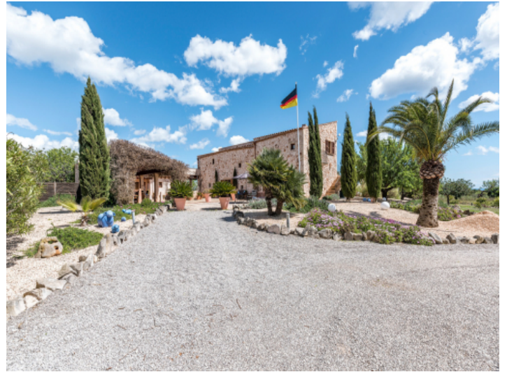
Zufahrt zum Anwesen