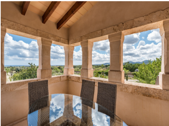
Sitzbereich auf der oberen Terrasse