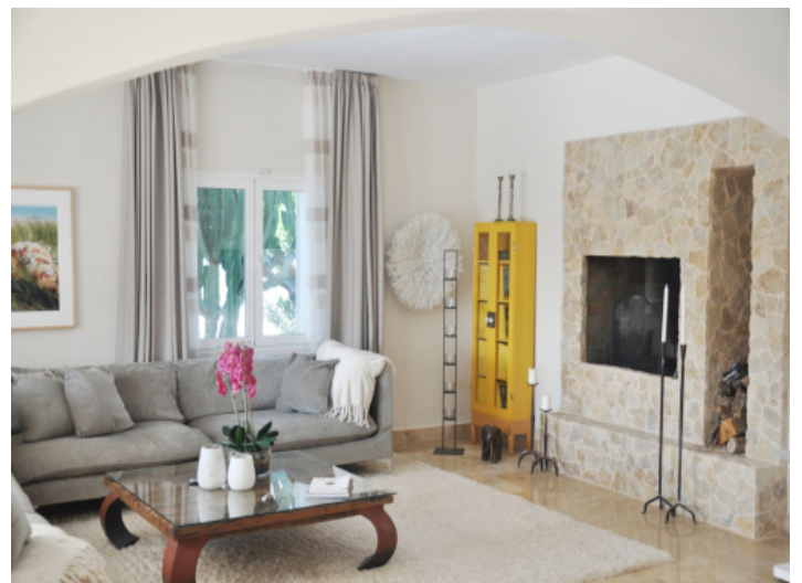
Heller Wohnbereich mit mediterranem Charakter