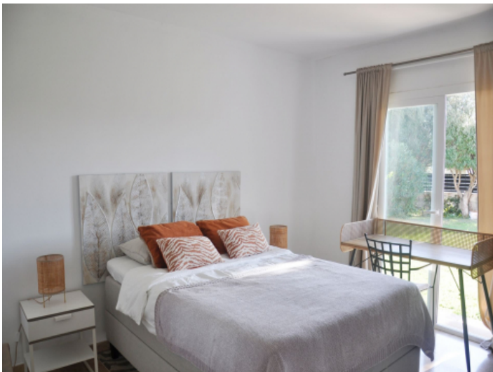
Helles Schlafzimmer mit Blick ins Grüne