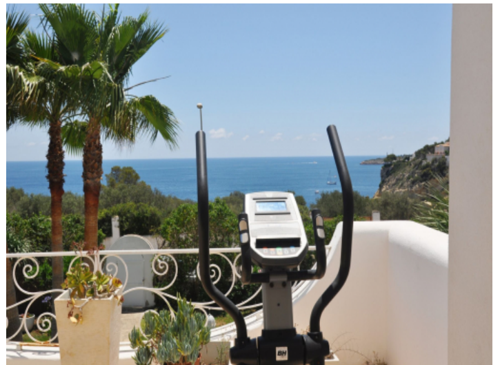
Sport im Freien mit Traumblick