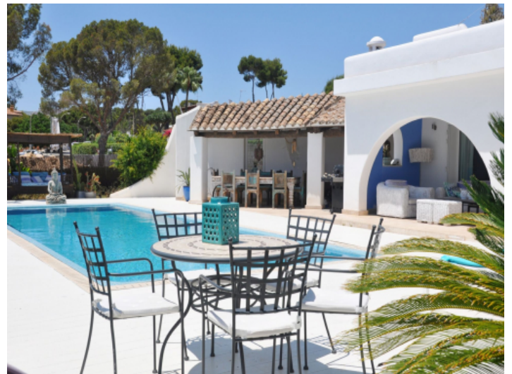
Außenbereich mit Pool und verschiedenen Ruheplätzen