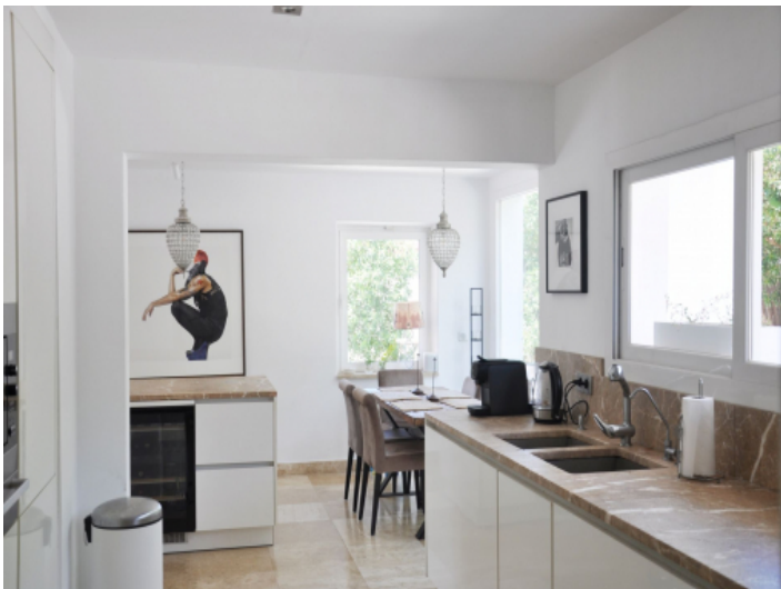
Moderne und voll ausgestattete Küche