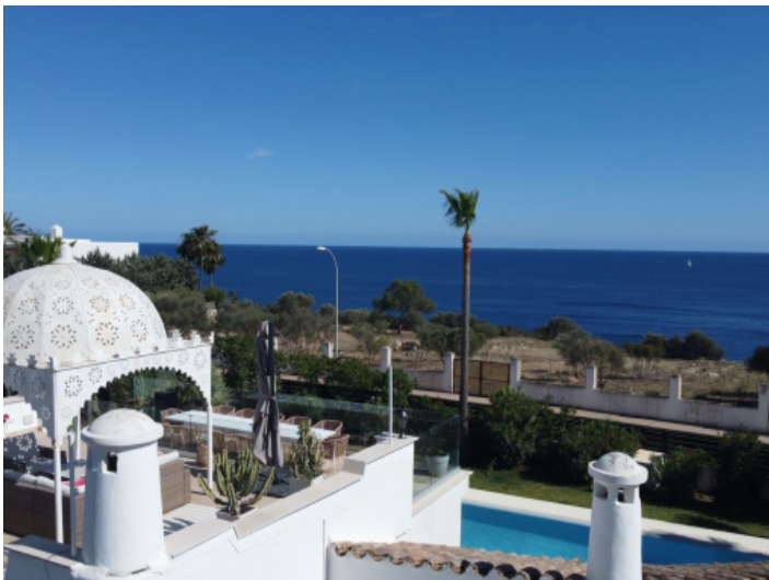
Großzügige Terrasse mit Meerblick