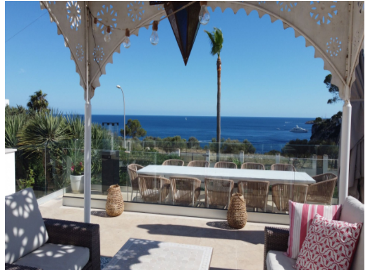
Dachterasse mit Meerblick und Loungebereich