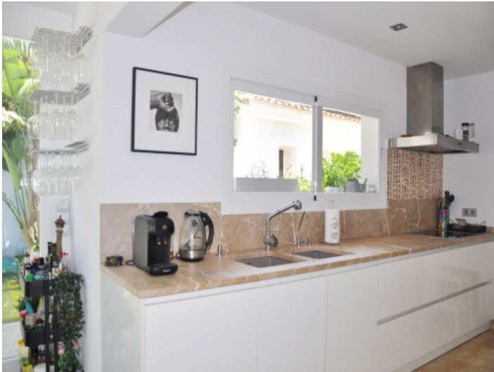
Moderne Küche mit offenem Wohnkonzept