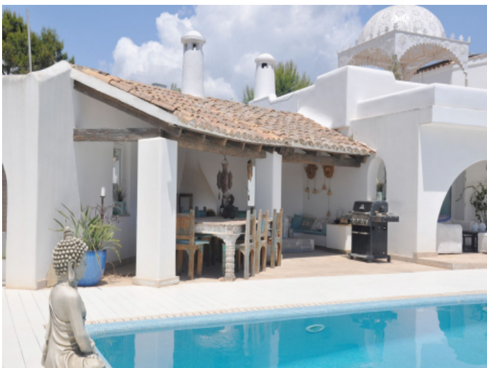
Überdachter BBQ- und Essbereich im Freien