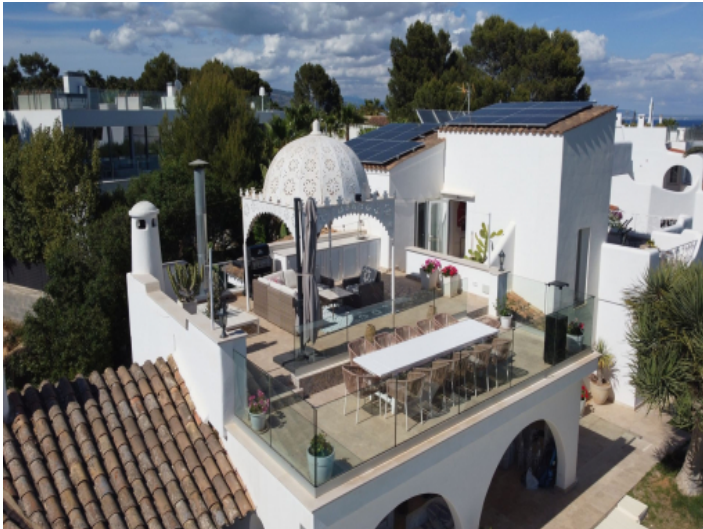
Villa mit Meerblick und mediterraner Architektur