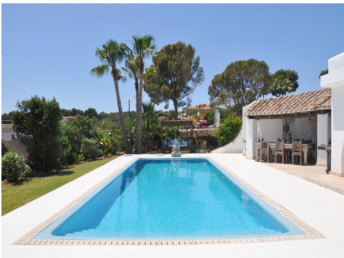
14-Meter-Salzwasserpool mit Sonnenterrasse