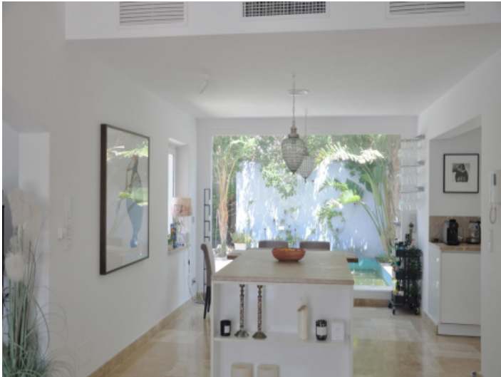
Offene Küche und Essbereich mit viel Tageslicht