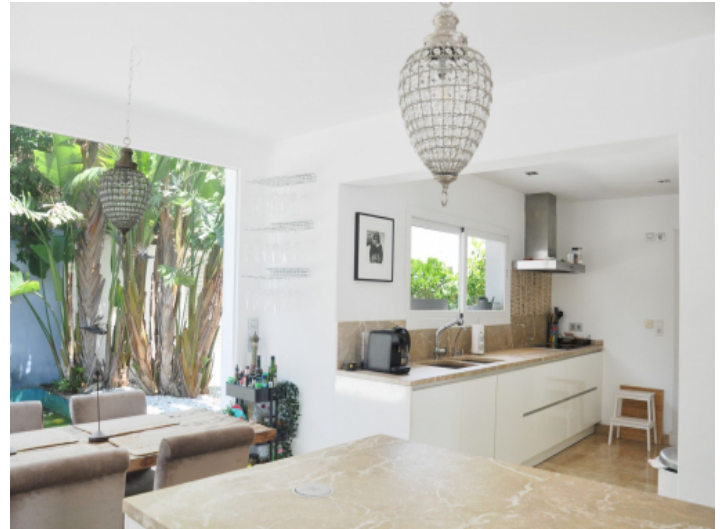
Offene Küche und Essbereich mit viel Tageslicht