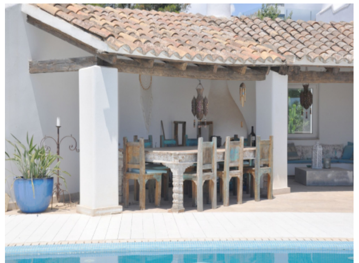
Überdachter BBQ- und Essbereich im Freien