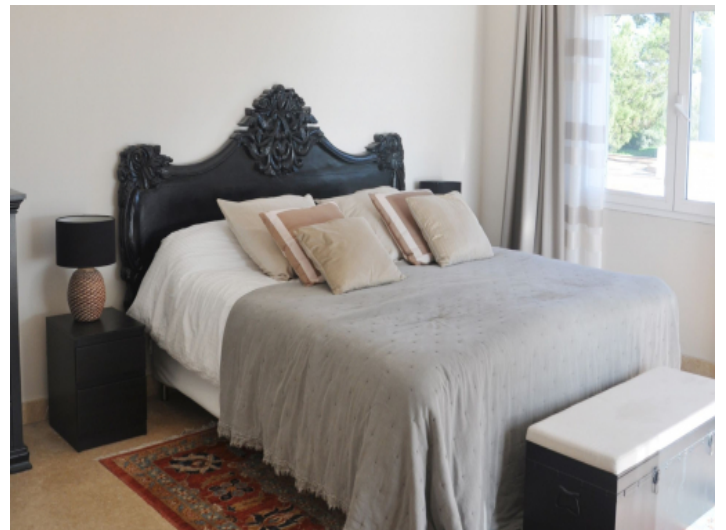
Gemütliches Schlafzimmer mit ruhiger Atmosphäre