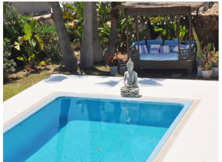
Poolbereich mit mediterraner Architektur