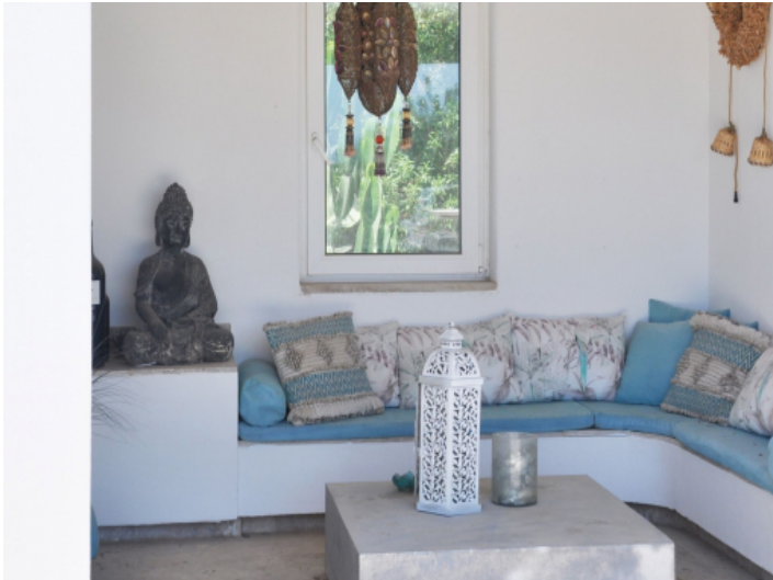
Gemütliche Sitzecke im mediterranen Stil