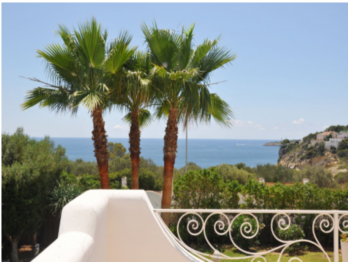
Dachterrasse mit Palmen und Meerblick