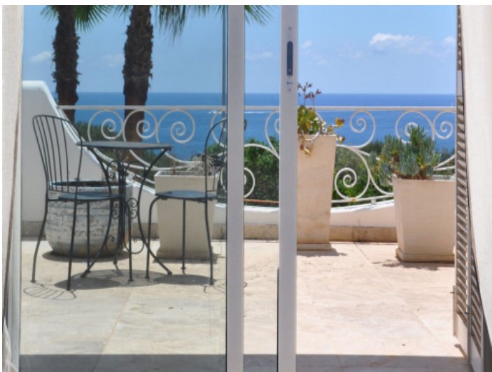
Terrasse mit Meerblick und Außenlounge