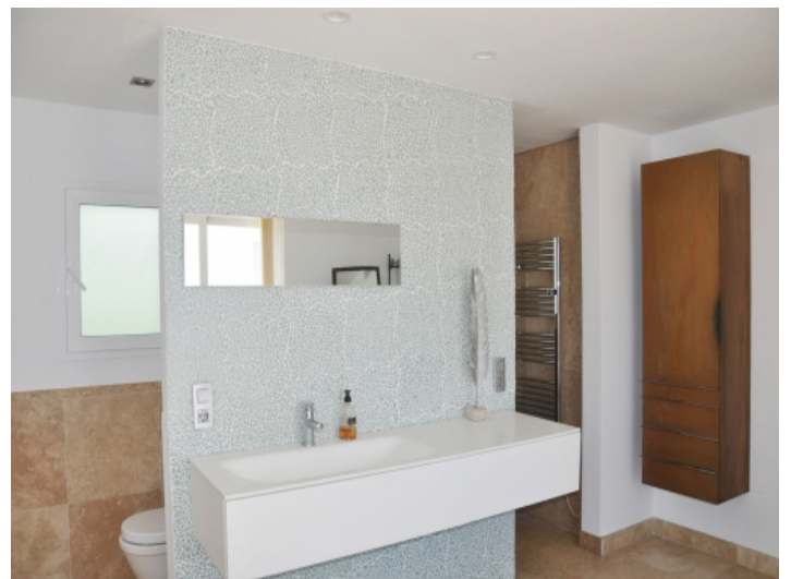
Modernes Badezimmer mit Dusche