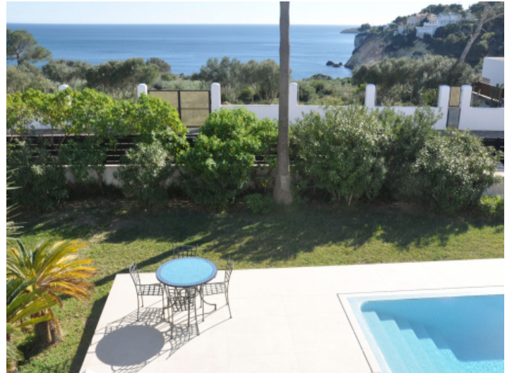
Privater Salzwasserpool mit Sonnenterrasse