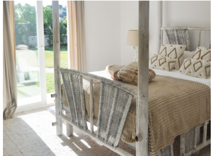
Schlafzimmer mit direktem Terrassenzugang