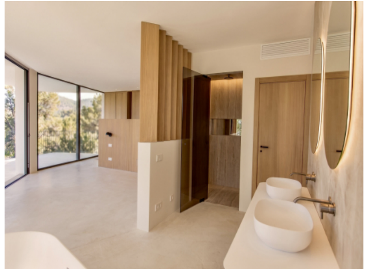
Schlafzimmer mit Badezimmer en suite