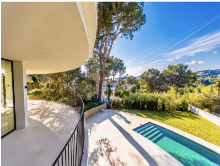
Idyllischer Blick ins Grüne