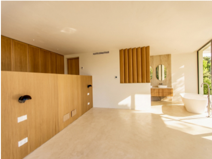
Schlafzimmer mit Badezimmer en suite