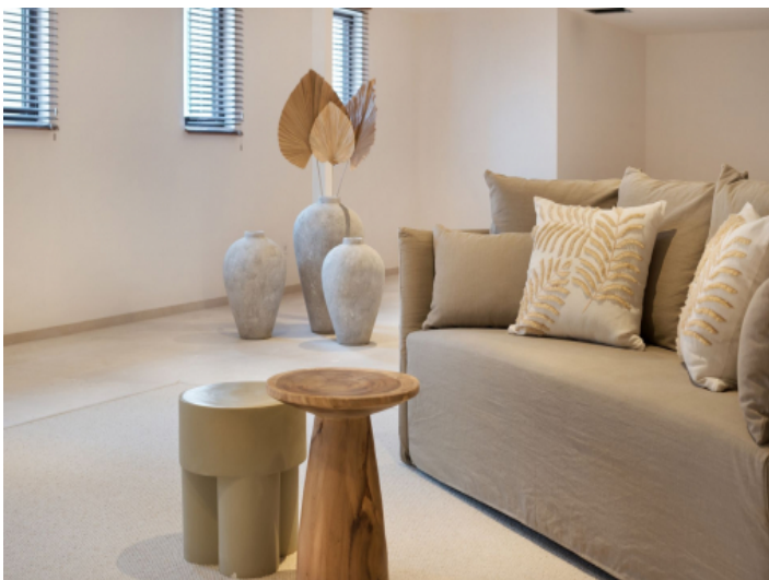
Untergeschoss mit Fussbodenheizung