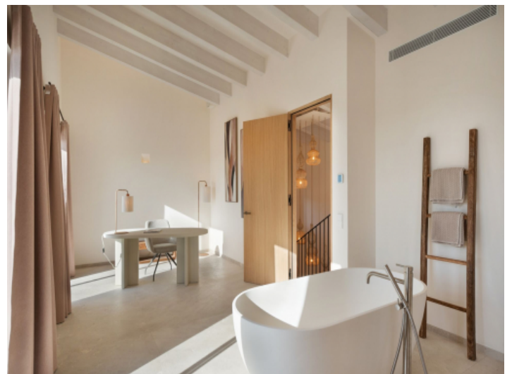
Masterschlafzimmer mit Badewanne