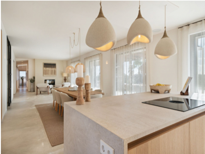
Essbereich mit Kochinsel