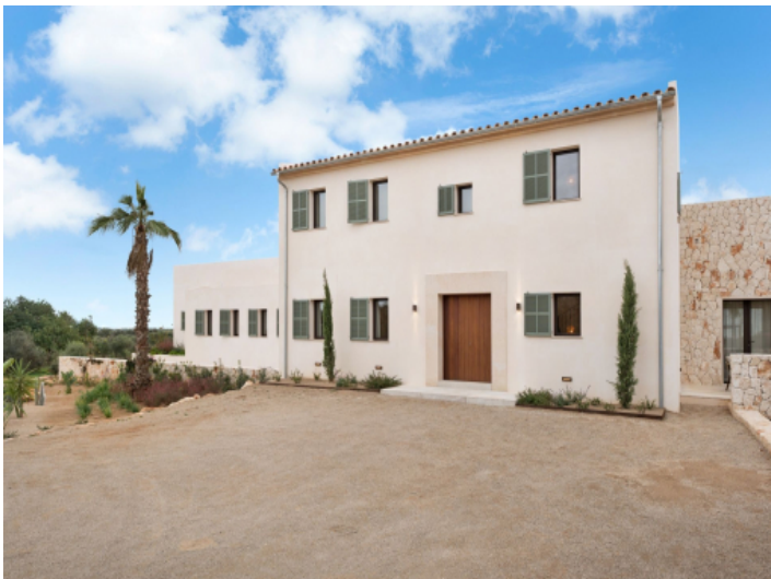
Frontansicht der Finca