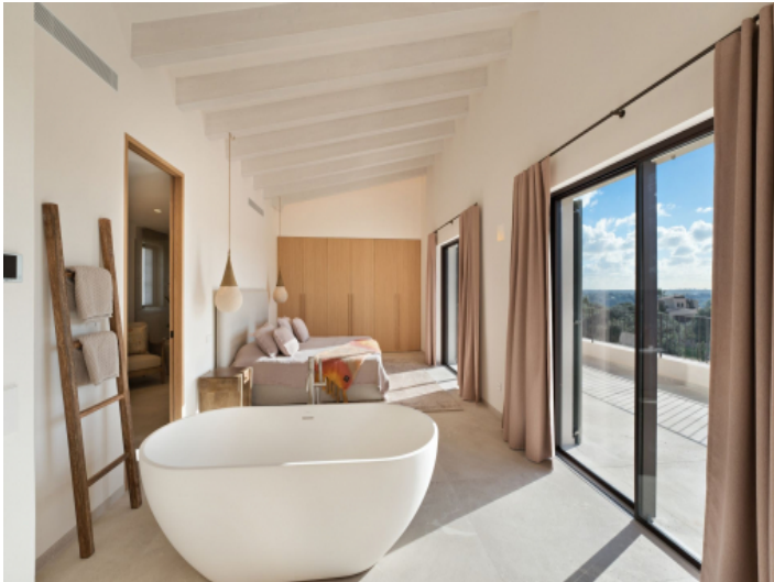
Aussicht vom Masterschlafzimmer