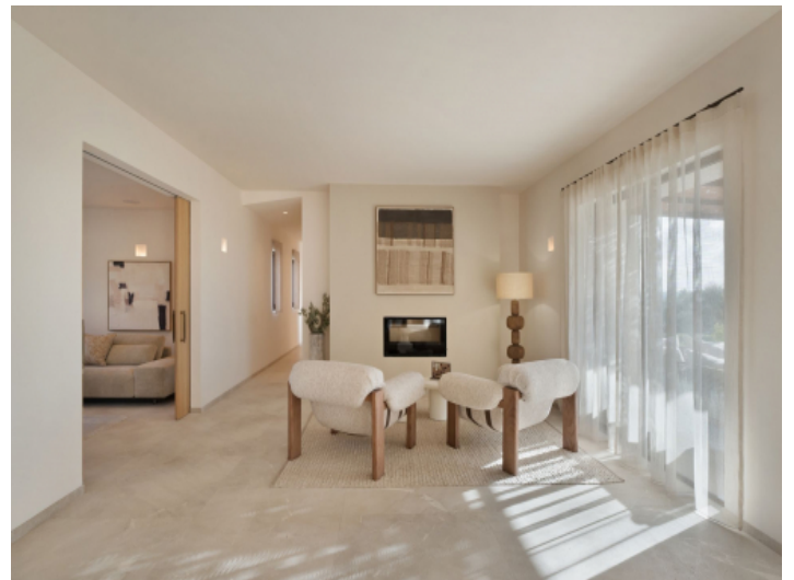
Sitzbereich mit Kamin