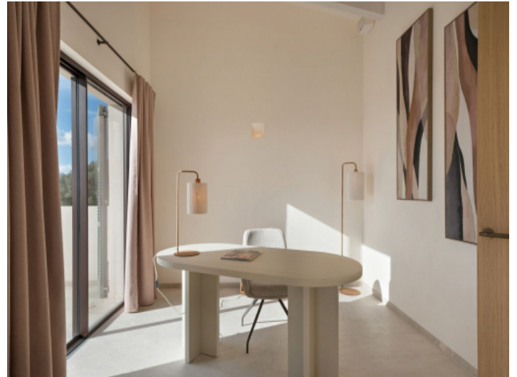
Masterschlafzimmer mit Schreibtisch