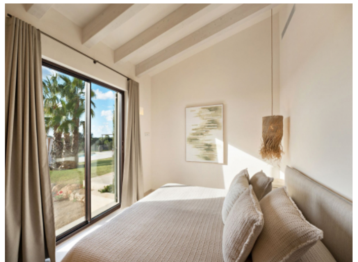
Schlafzimmer mit Zugang zum Poolbereich