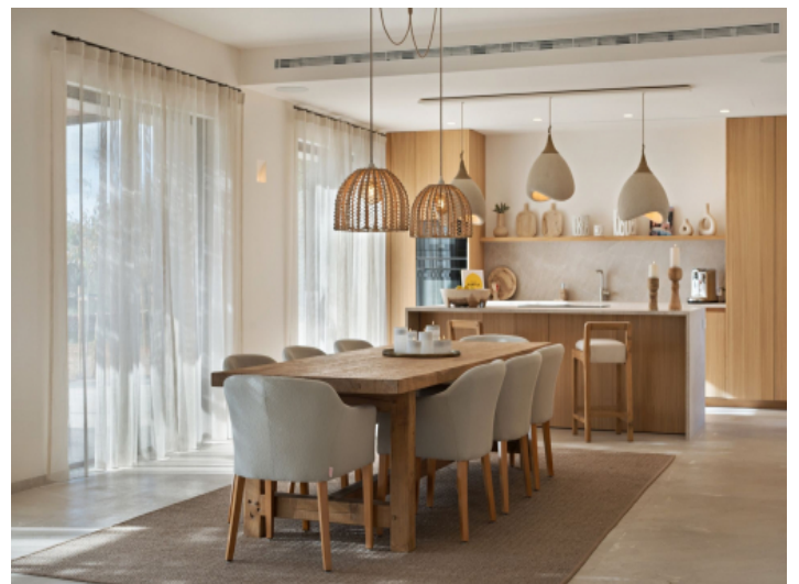
Essbereich mit Küche