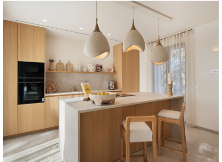
Küche mit Kochinsel