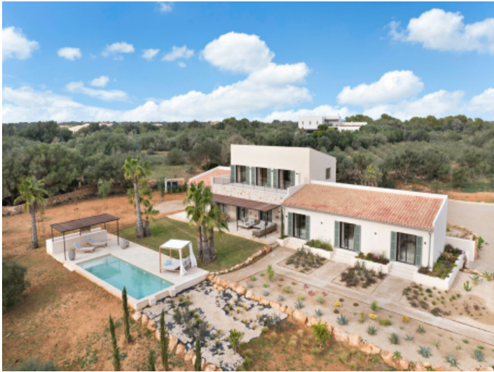
Ansicht auf Anwesen