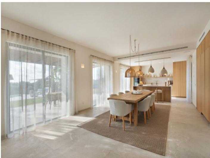
Essbereich mit offener Küche