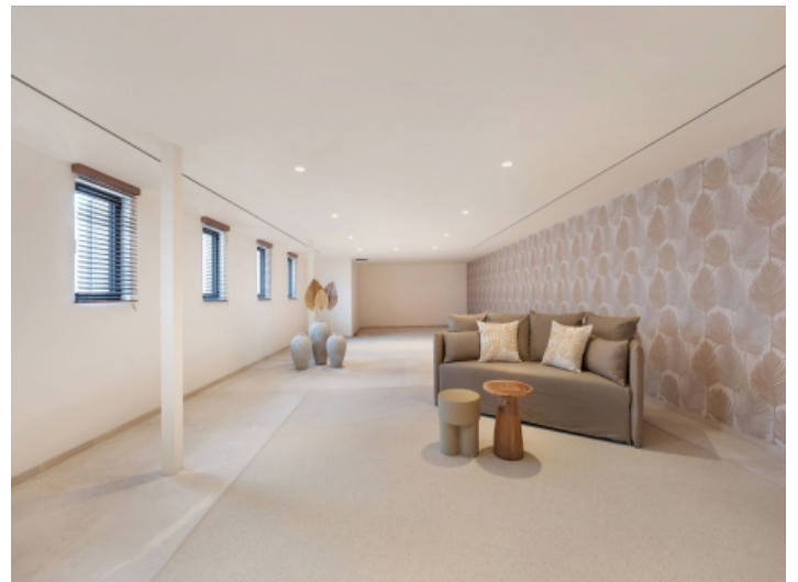
Untergeschoss Bereich für GYM und Sauna