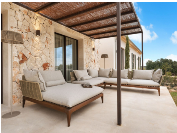
Terrasse zum Geniessen der Natur