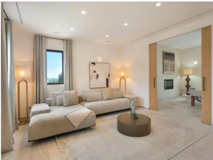
Wohnzimmer mit Übergang zum Kaminbereich