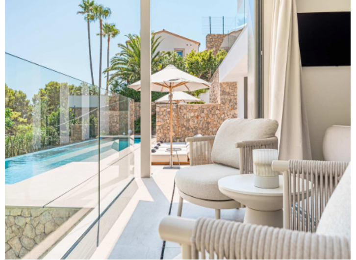
Zeit zum Genießen