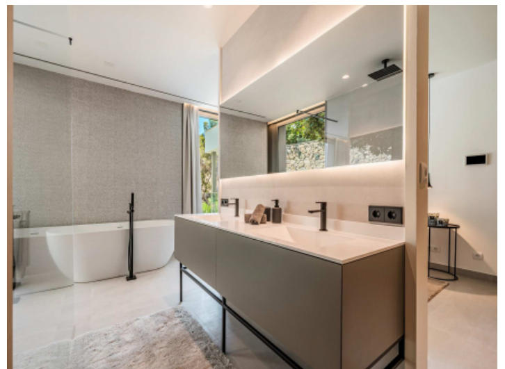
Eines der 5 Badezimmer