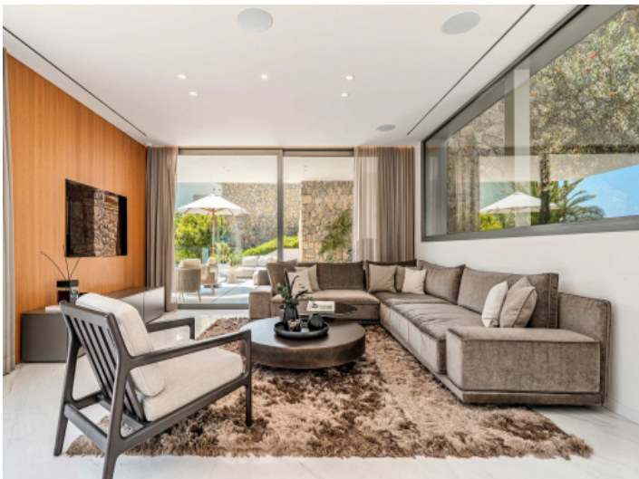
Moderner Wohnbereich mit großer Fensterfront