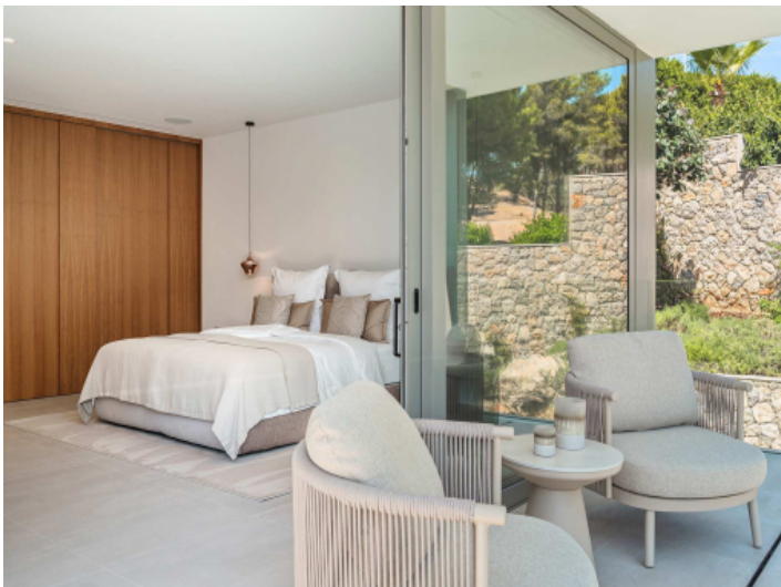
Eines der vier Schlafbereiche mit direktem Zugang auf die