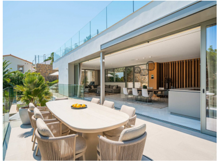
Offener Wohn-Essbereich mit direktem Zugang zur