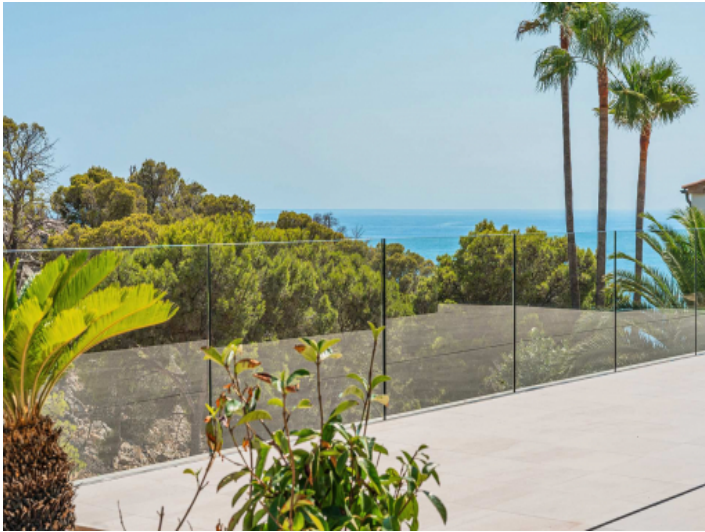
Idyllische Atmosphäre mit seitlichem Meerblick