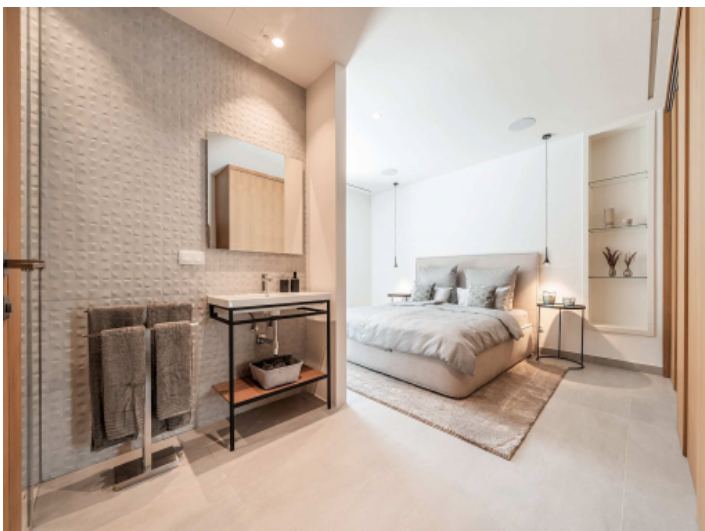
Eines der vier Schlafzimmer