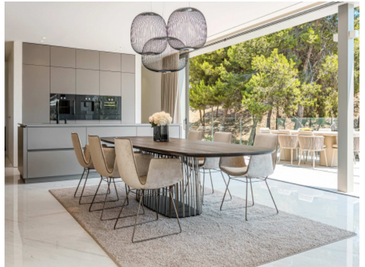
Lichtdurchfluteter Essbereich mit Zugang auf die Terrasse