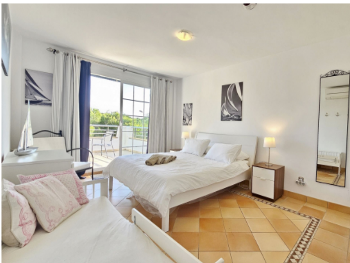
Schlafzimmer alle mit Ausgang zum Balkon