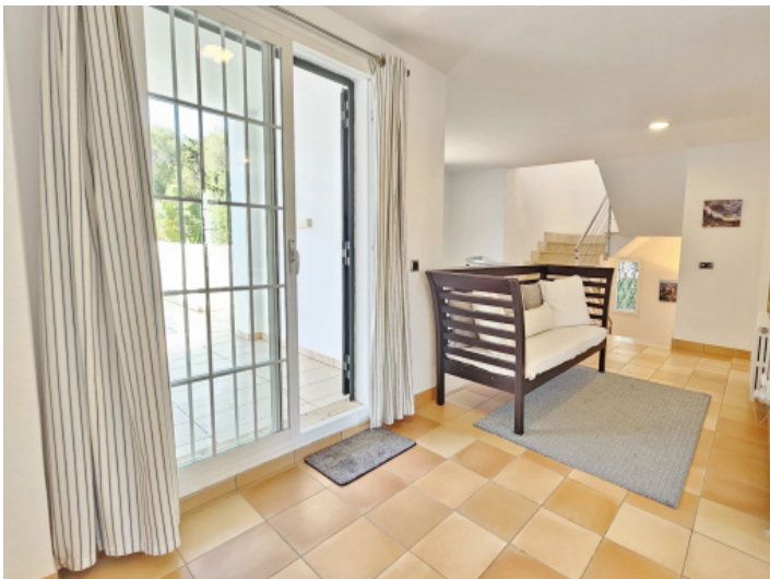
Treppenhaus über drei Etagen