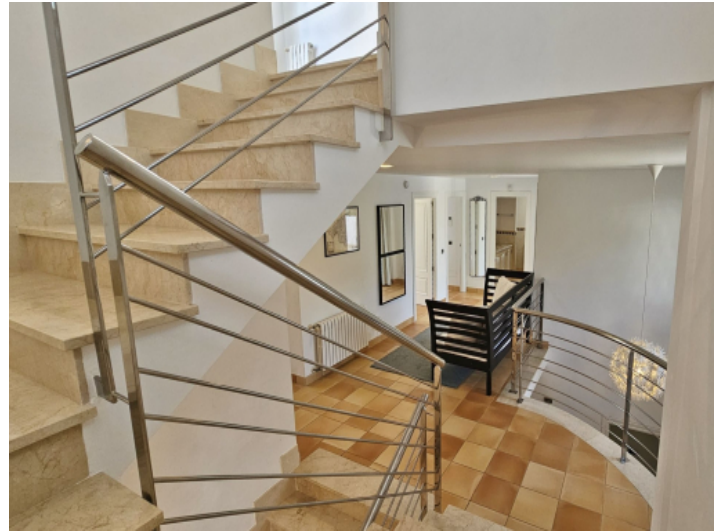
Treppenhaus über drei Etagen