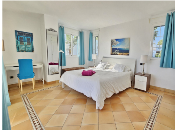
Schlafzimmer in dritter Etage mit Balkon und Bad