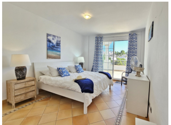
Schlafzimmer alle mit Ausgang zum Balkon