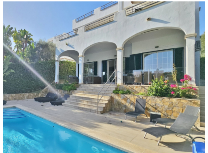
Überdachte Terrasse und Sonnenterrasse