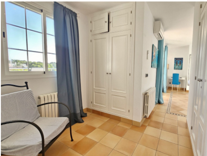
Schlafzimmer in dritter Etage mit Balkon und Bad