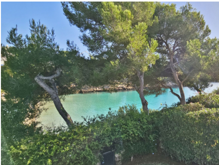
Cala Gran direkt vor der Tür