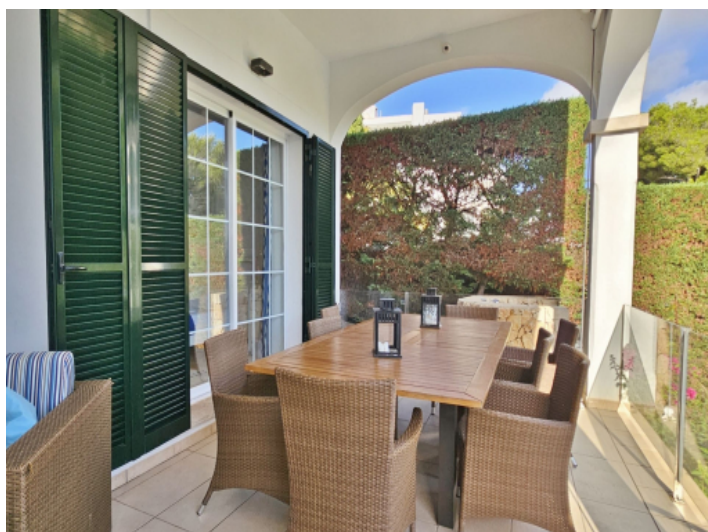
Überdachte Terrasse am Haus