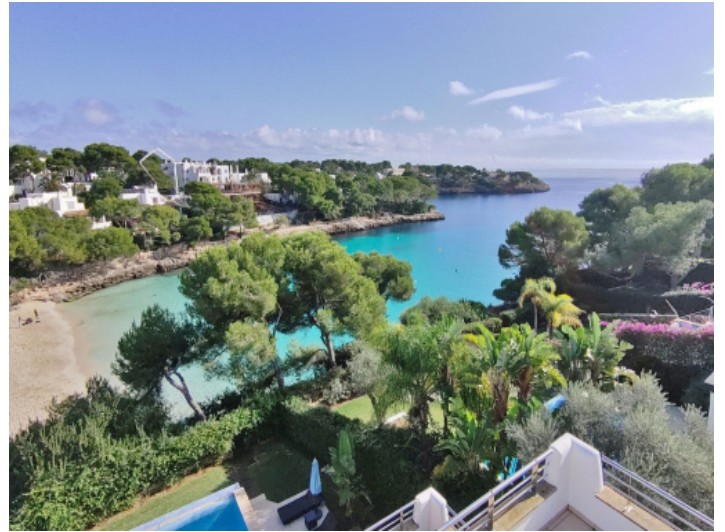
Cala Gran direkt vor der Tür