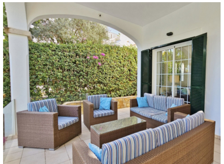
Überdachte Terrasse am Haus