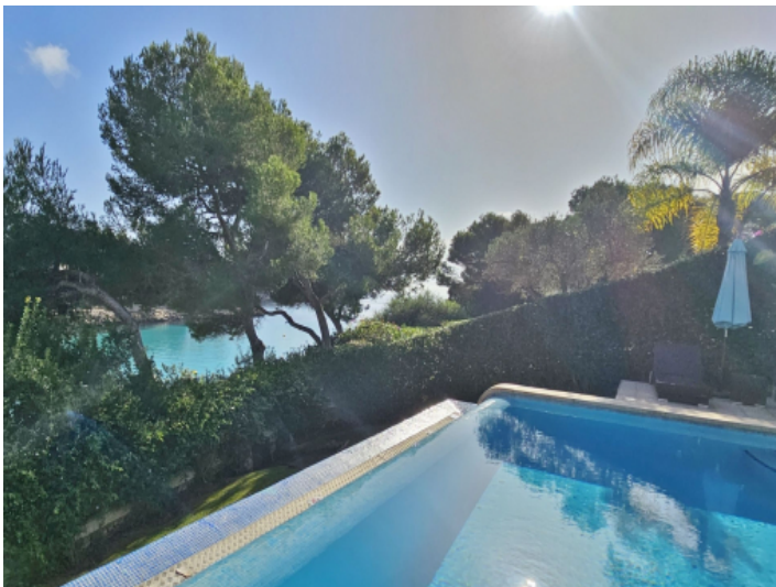
Garten und Pool in erster Meereslinie