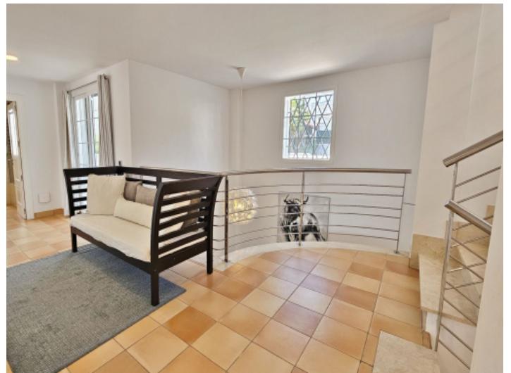
Treppenhaus über drei Etagen