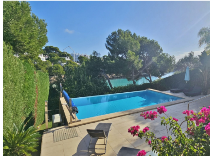
Garten und Pool in erster Meereslinie