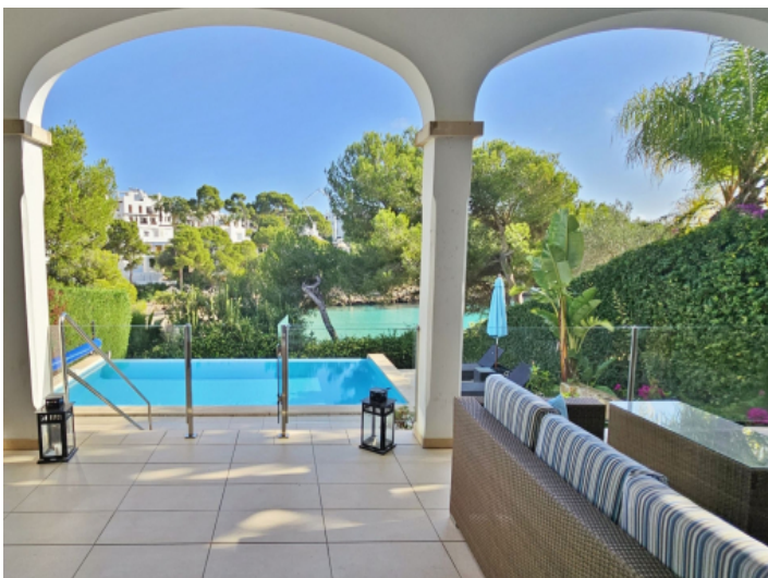
Meerblick von der Terrasse aus