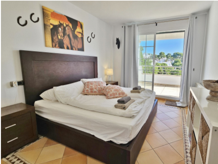
Schlafzimmer alle mit Ausgang zum Balkon