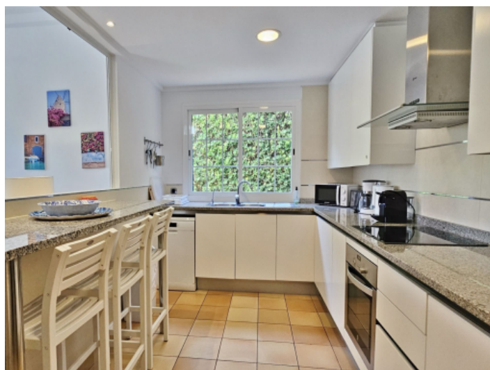
Küche mit Öffnung zum Wohnbereich