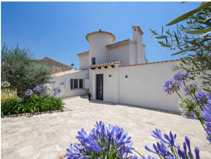
Eingang der Villa