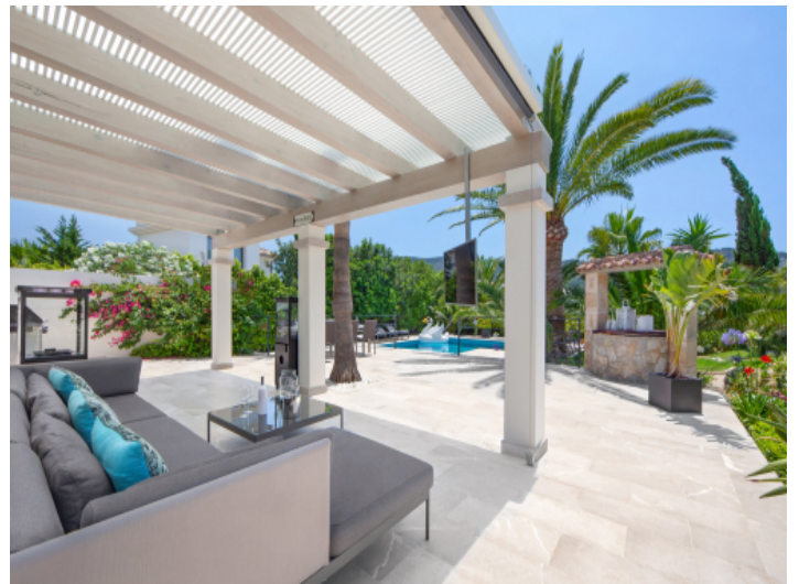
Terrasse mit Poolblick