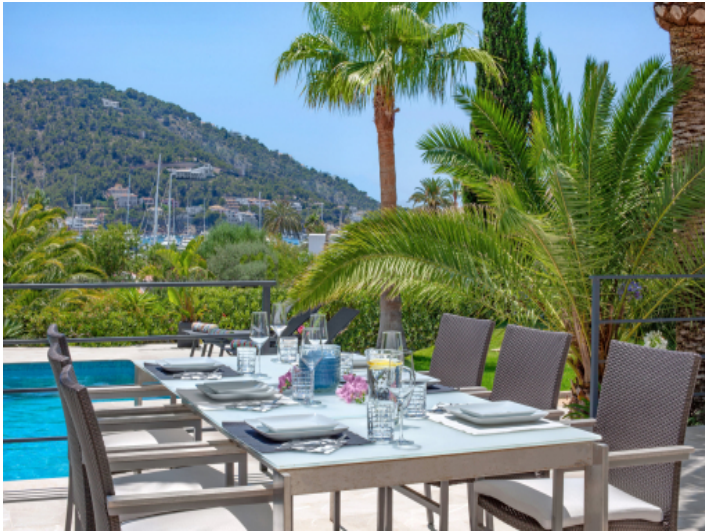
Poolbereich mit Hafenblick