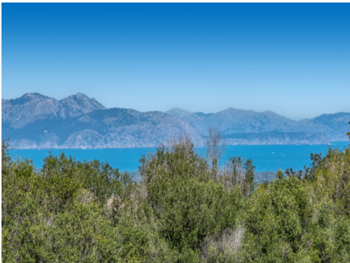
Weitblick bishin zum Meer