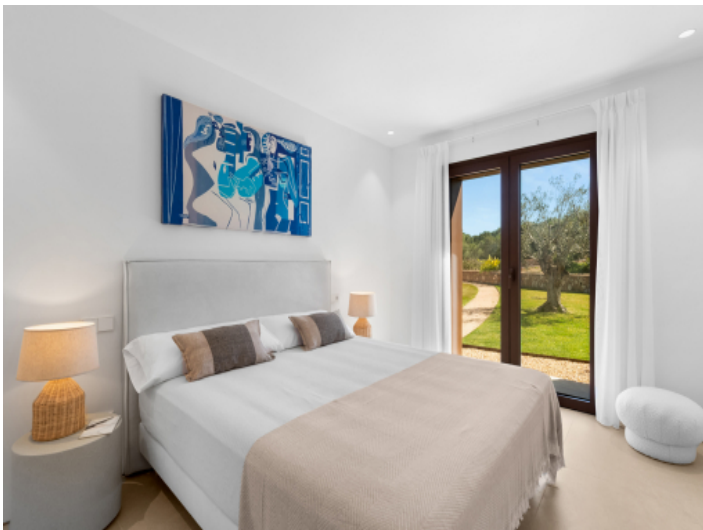
Eines der 4 Schlafzimmer mit Bad en Suite und Gartenzugang