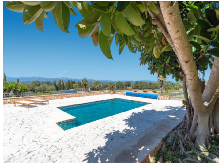
Mediterrane Luxusfinca mit Tennisplatz, Wellnessbereich und