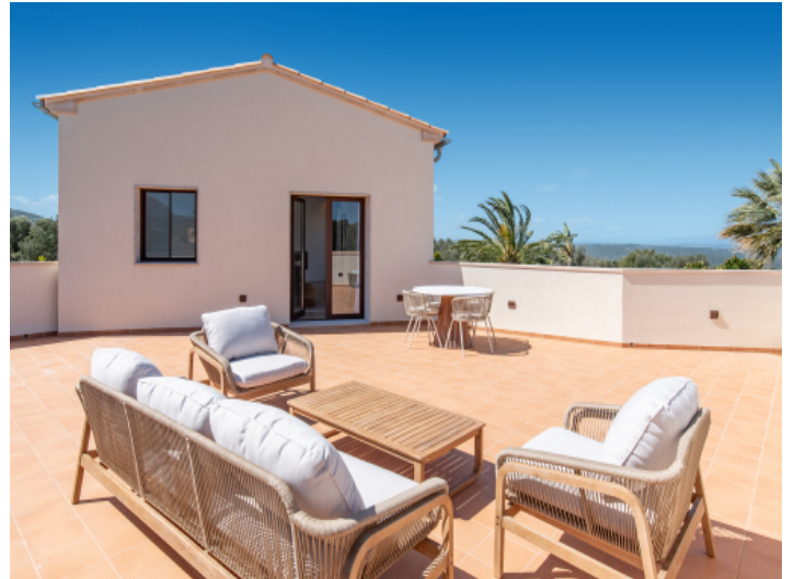
Private Terrasse der Master-Suite