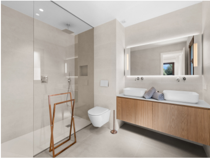
Modernes Badezimmer en Suite