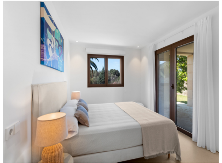
Eines der 4 Schlafzimmer mit Bad en Suite und Ankleide