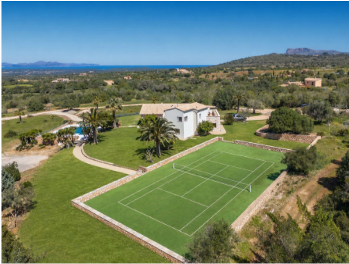
Finca mit Tennisplatz und Meerblick zwischen Manacor und