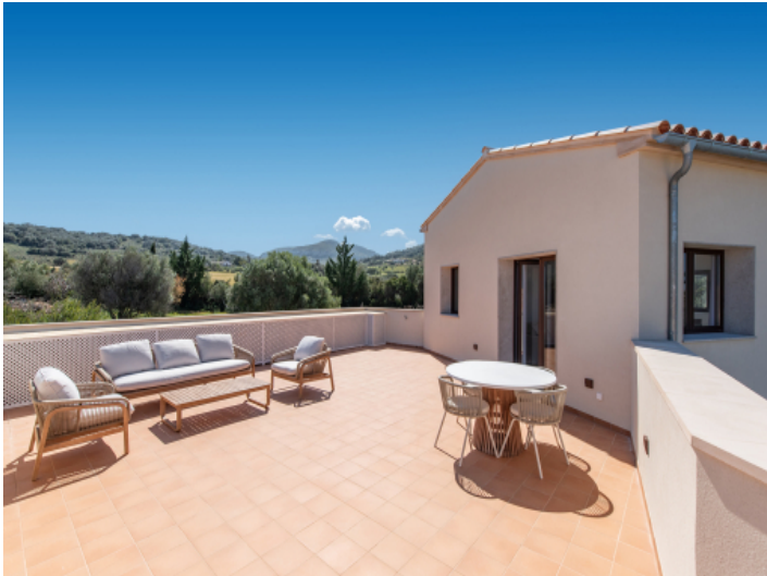
... und privater Terrasse mit Rundumblick