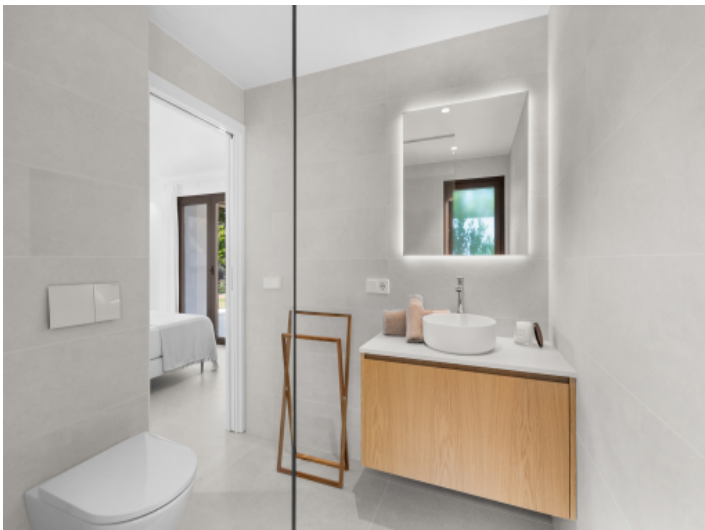
Modernes Badezimmer en Suite