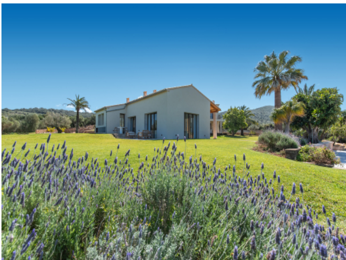
Mediterraner Garten mit absoluter Privatsphäre