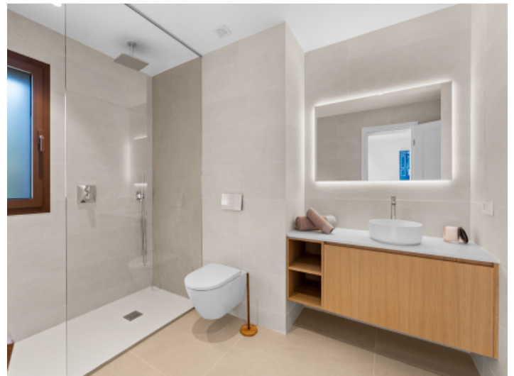
Modernes Badezimmer en Suite