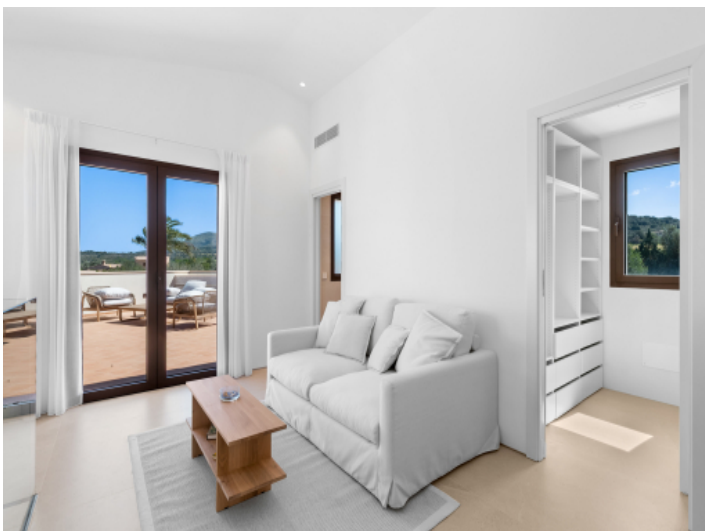
... mit privatem Wohnbereich, Ankleide...