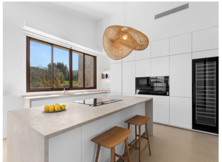
Designküche mit hochwertigen Materialien und moderner