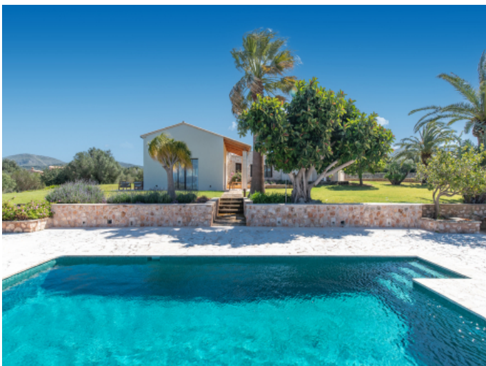
Großzügiger Salzwasserpool mit Sonnenterrasse