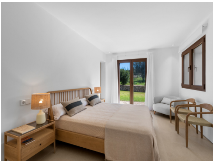
Eines der 4 Schlafzimmer mit Bad en Suite und Gartenzugang