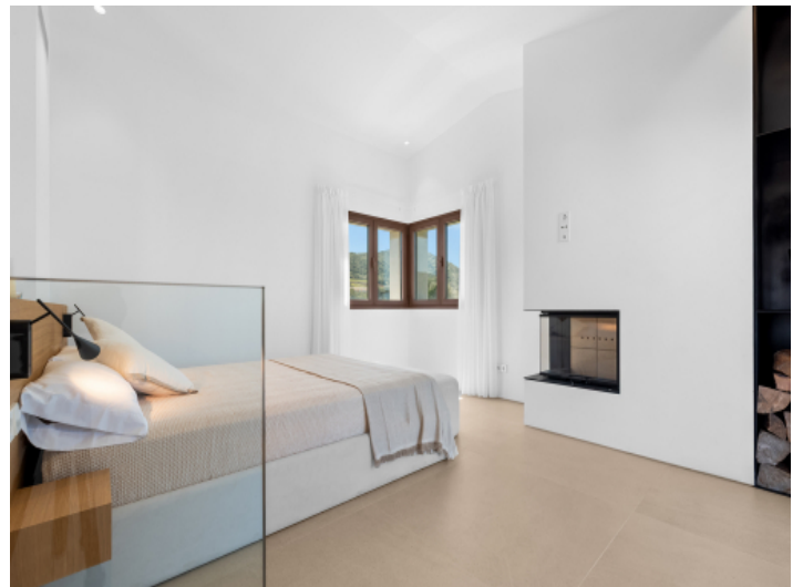
Master-Suite im Obergeschoss...