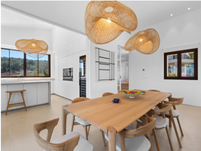
Hochwertige, separat verschließbare Küche für maximale