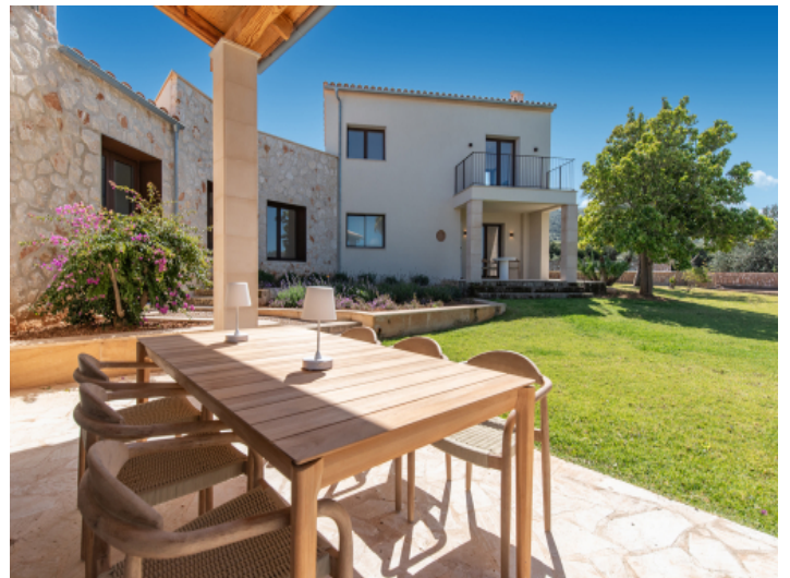
Außenbereiche ideal für Entspannung und gesellige Abende