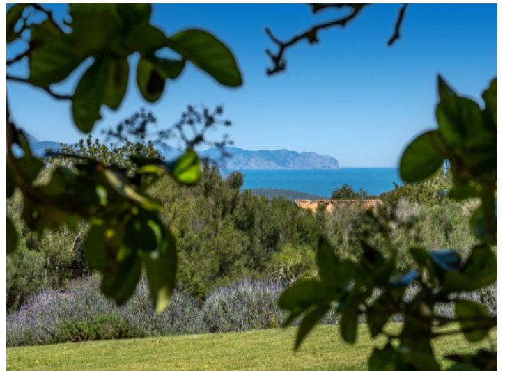
Natur und Blick