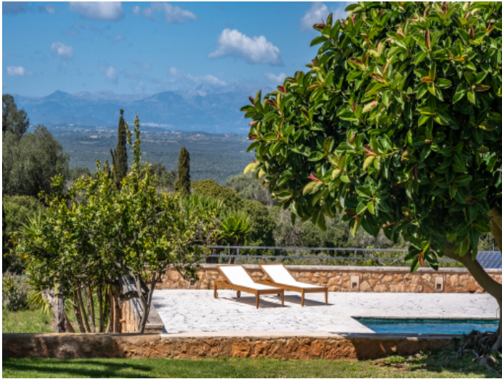
Mediterraner Garten mit absoluter Privatsphäre