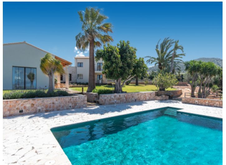
Großzügiger Salzwasserpool mit Sonnenterrasse