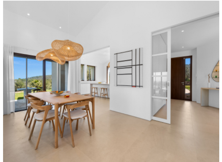
Essbereich mit direktem Zugang zur Terrasse