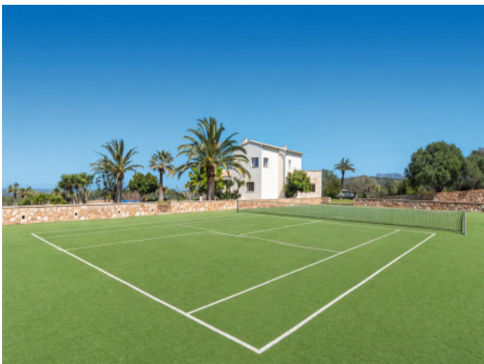
Finca mit Tennisplatz und Meerblick zwischen Manacor und Colònia de Sant Pere