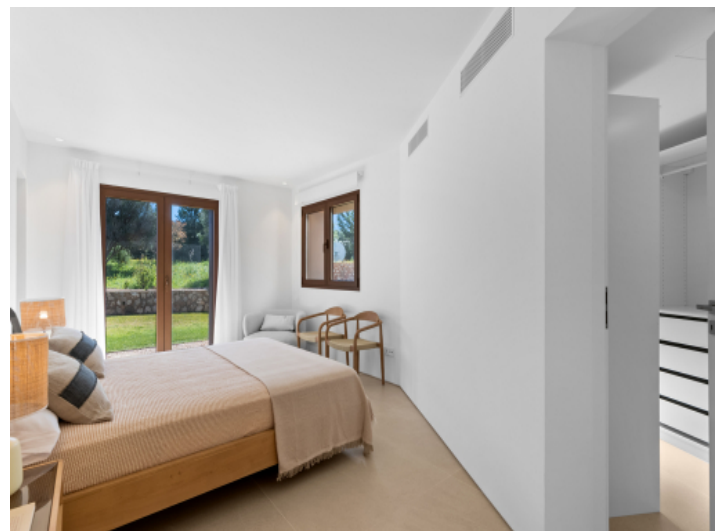
Eines der 4 Schlafzimmer mit Bad en Suite und Ankleide