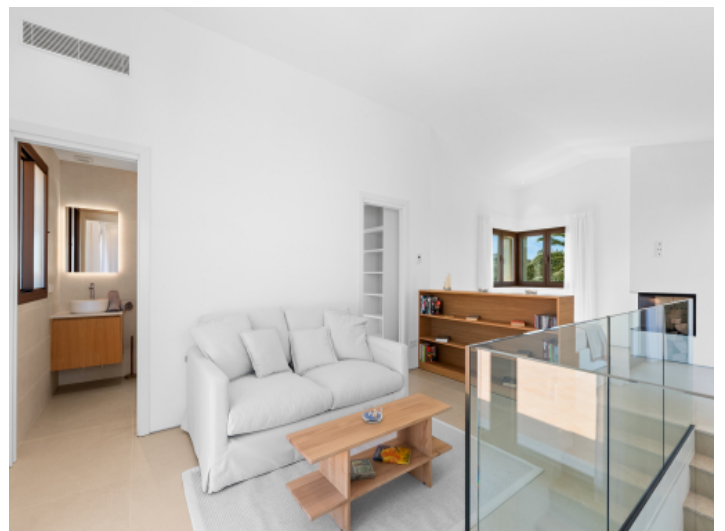
...Badezimmer en Suite