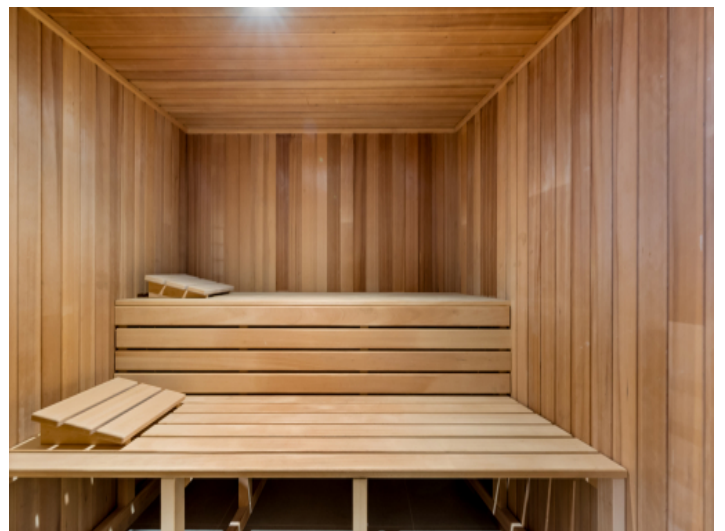
Wellnessbereich mit Sauna