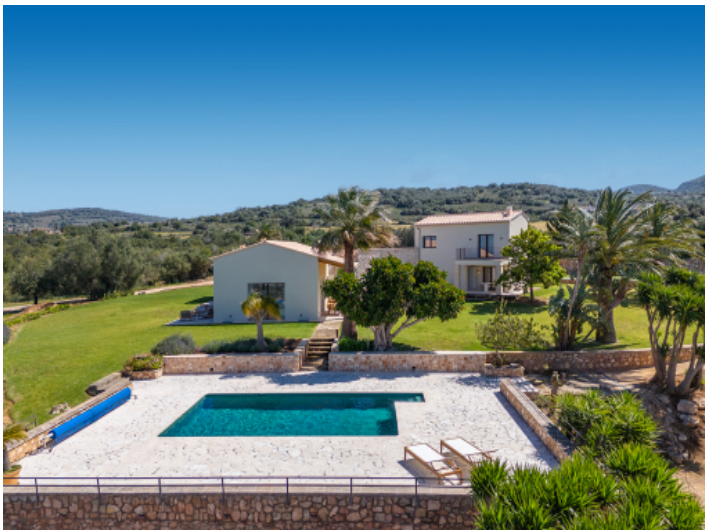
Luxusfinca mit Tennisplatz, Meerblick und absoluter