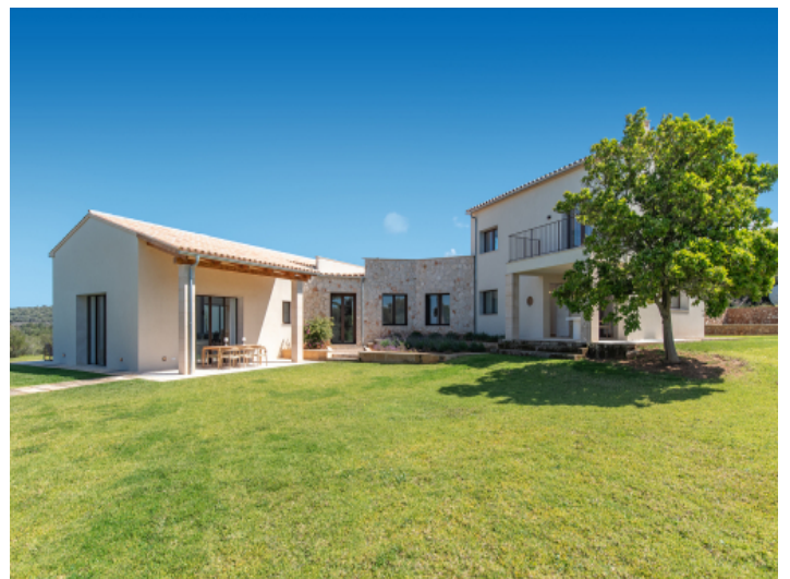
Außenbereiche ideal für Entspannung und gesellige Abende