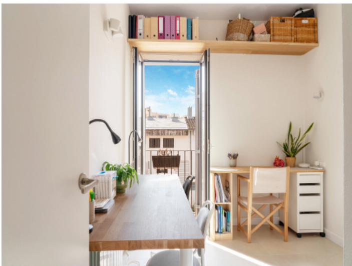
Eines der drei Schlafzimmer