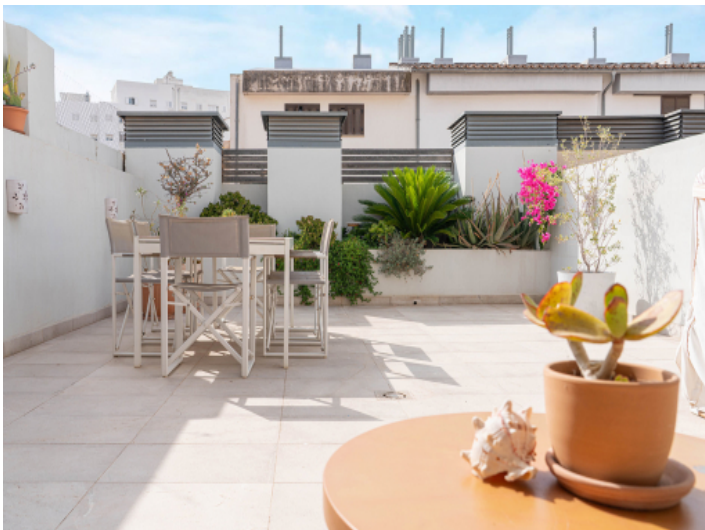
Große Terrasse für entspannte Stunden im Freien