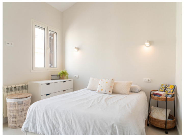
Eines der drei Schlafzimmer