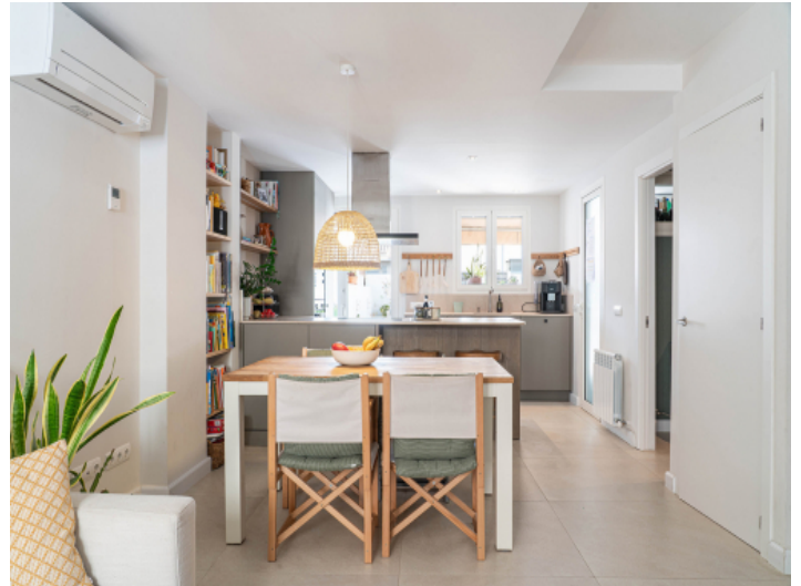
Offen gestaltete Küche und Essbereich