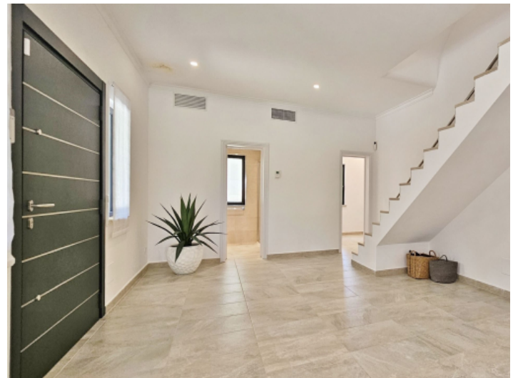
Eingang und Treppenhaus