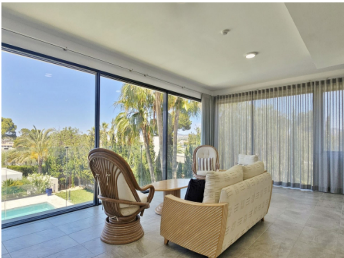
Wohnzimmer im Obergeschoss