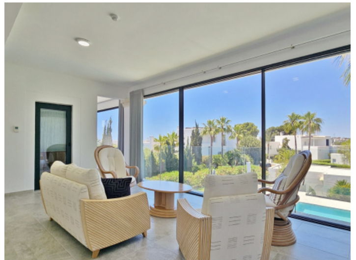
Wohnzimmer im Obergeschoss