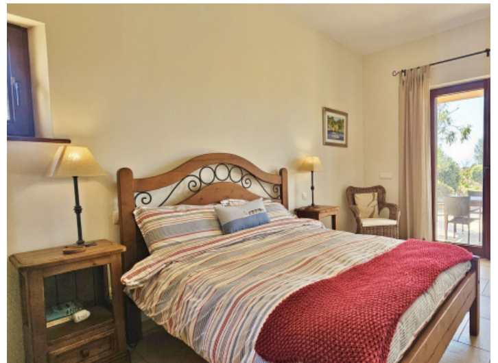
Viertes Schlafzimmer Untergeschoss