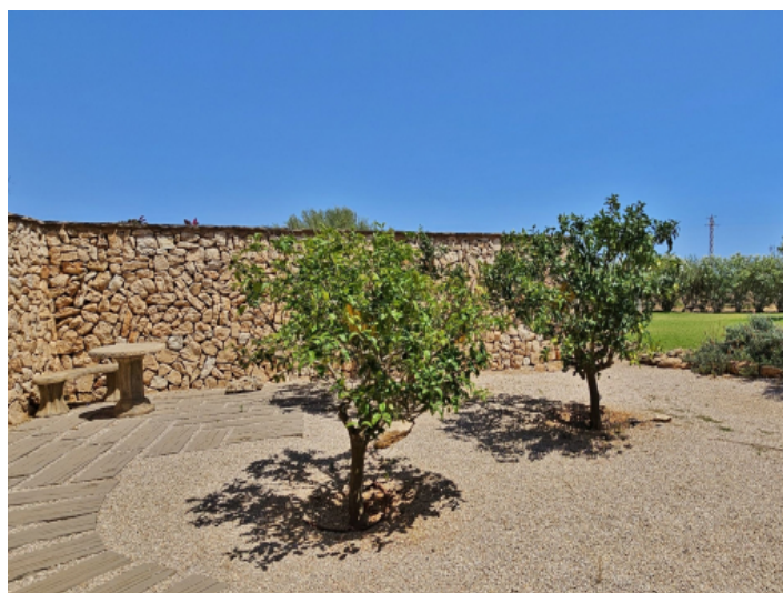
Garten mit Obstbäumen