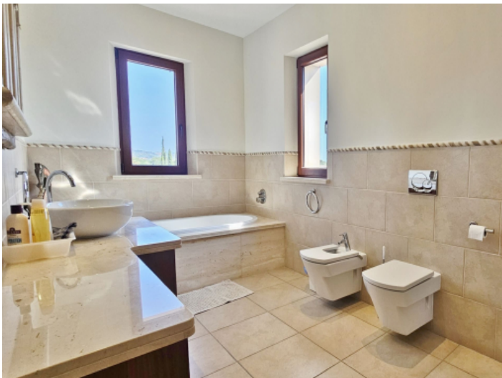
Zweites Badezimmer Obergeschoss