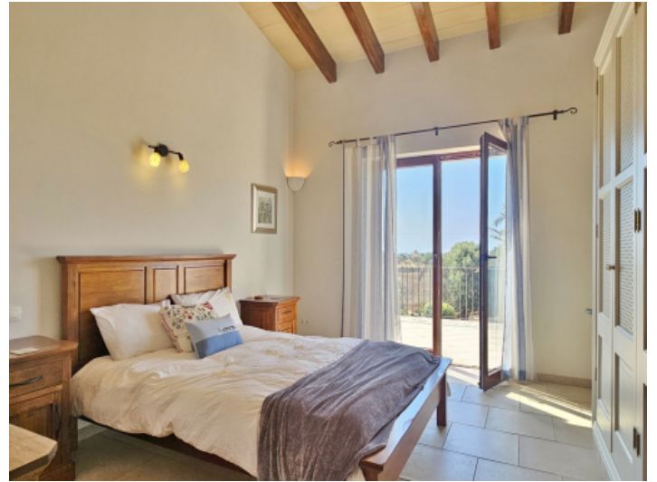
Drittes Schlafzimmer Obergeschoss