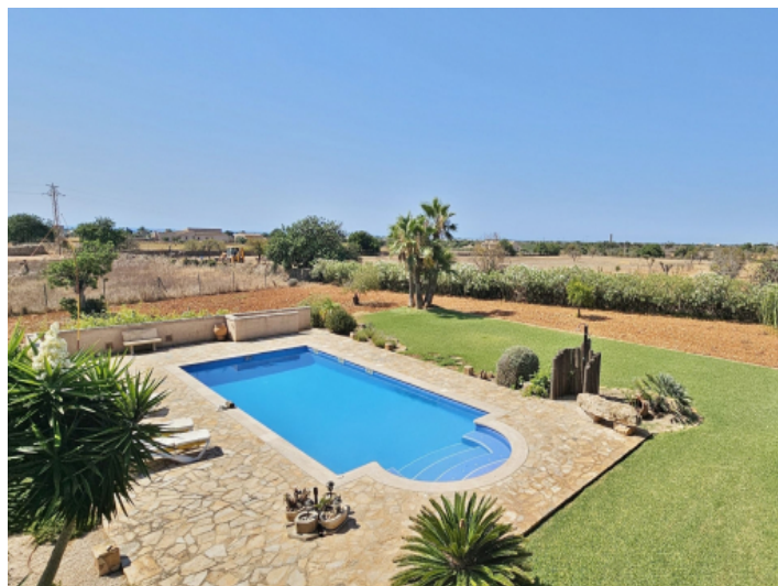
Pool mit Jacuzzi