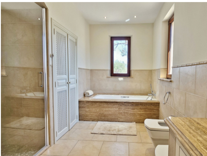
Drittes Schlafzimmer Untergeschoss