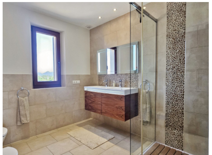
Bad en Suite Masterbedroom