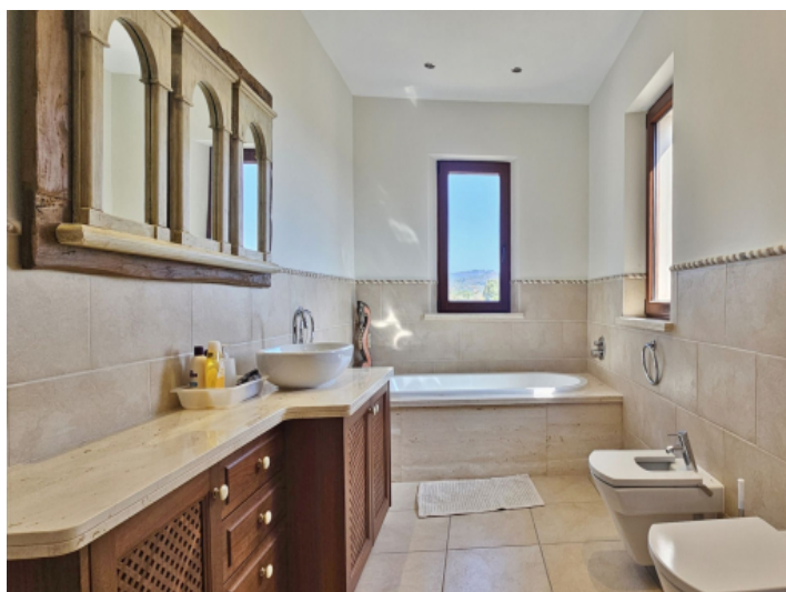
Zweites Badezimmer Obergeschoss