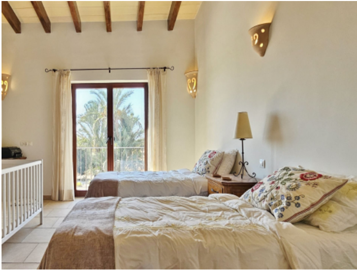
Zweites Schlafzimmer Obergeschoss