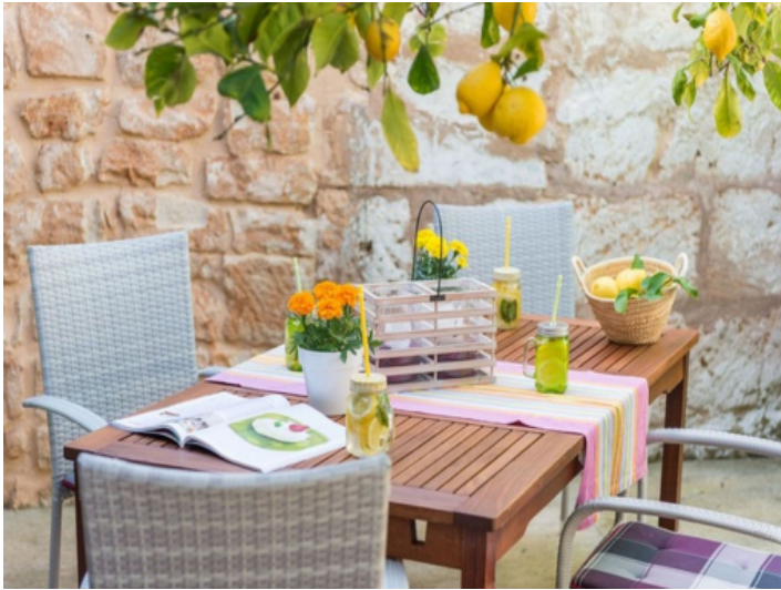
Innenhof mit Garten