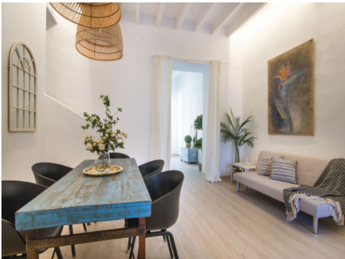
Wohn und Essbereich