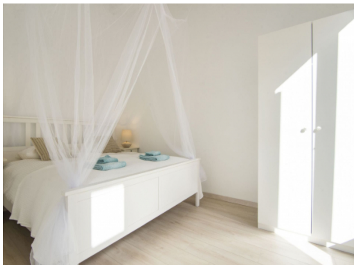
Eins von drei Doppelschlafzimmer