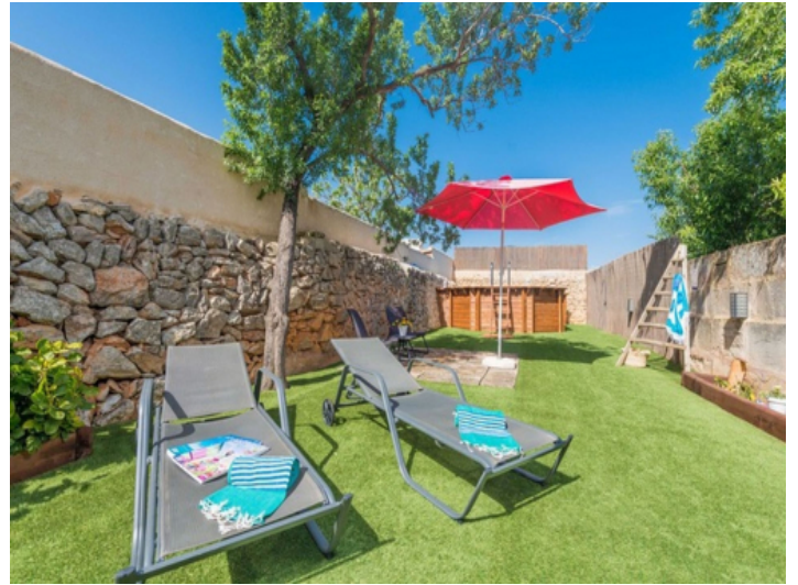
Garten mit Pool