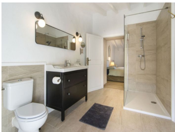
Badezimmer en Suite