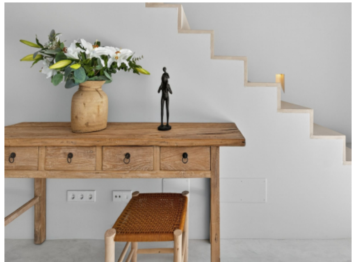
Kommode im Wohnbereich