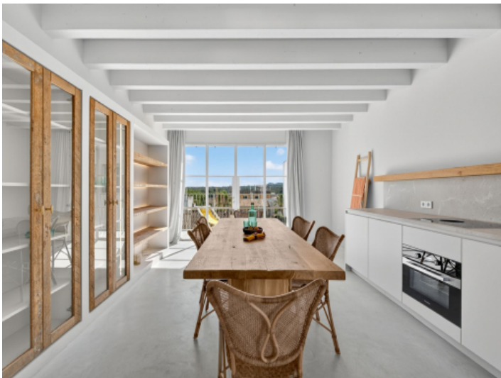
Offene Küche mit Essbereich