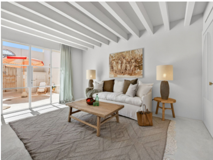
Wohnbereich mit Ausgang zum Patio