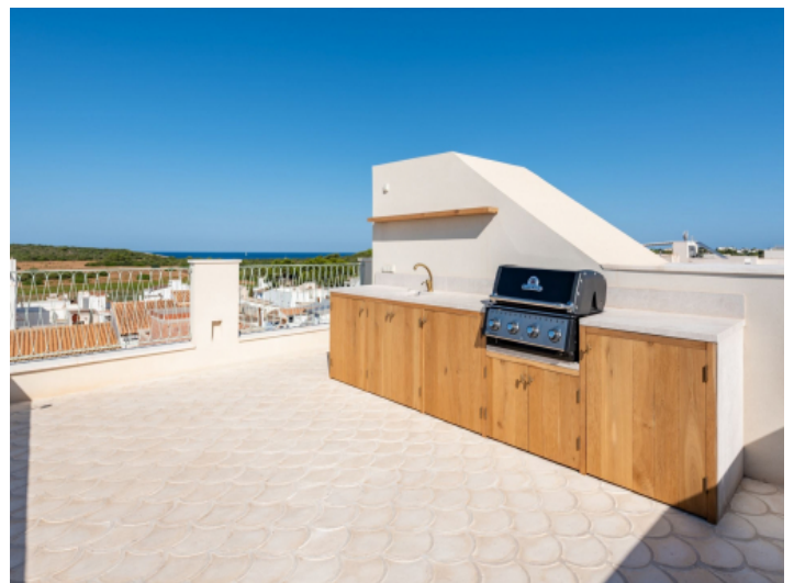
Rooftop Terrasse mit Meerblick