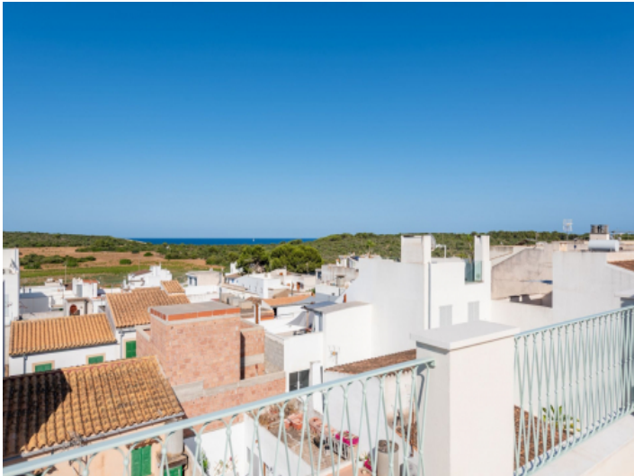
Weitblick bis zum Meer