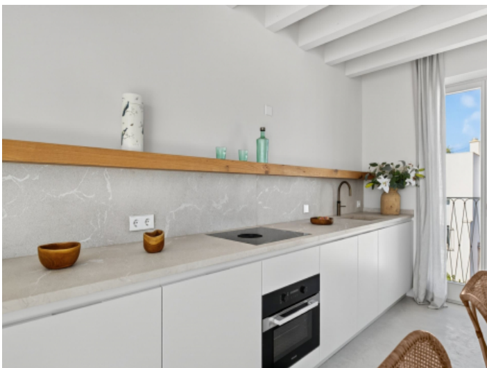
Küche mit Naturstein