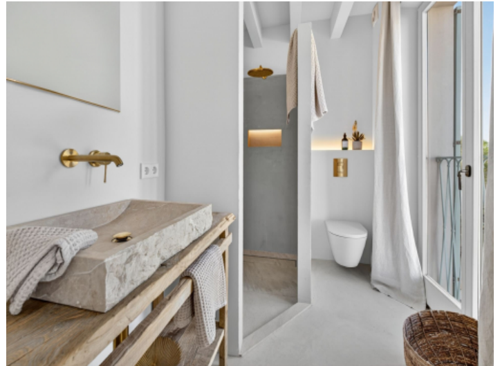
Badezimmer in Microzement