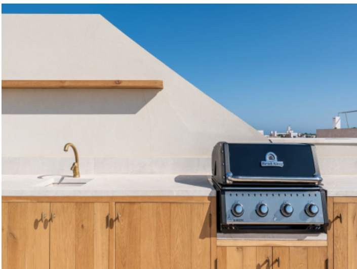
Dachterasse mit BBQ