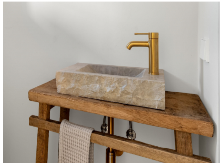
Badezimmer mit Natursteinbecken