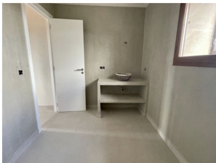
Bad en suite zweites Schlafzimmer