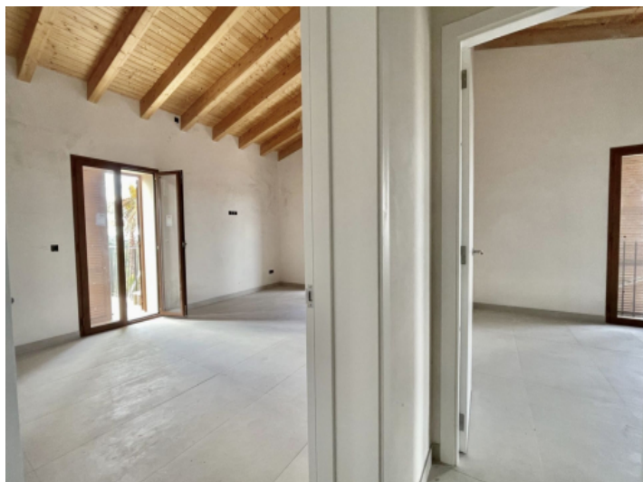
Links Masterbedroom und rechts drittes Schlafzimmer