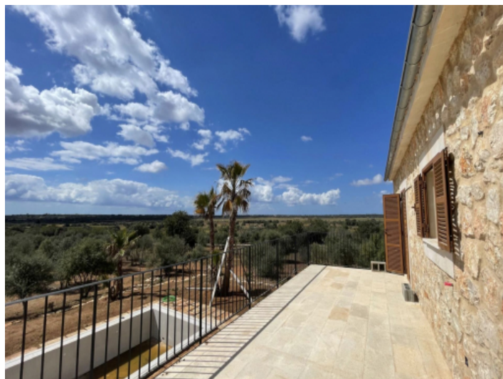
Aussicht von der Terrasse