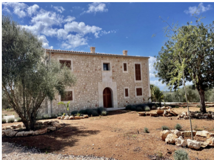
Neubau Finca in Santanyi