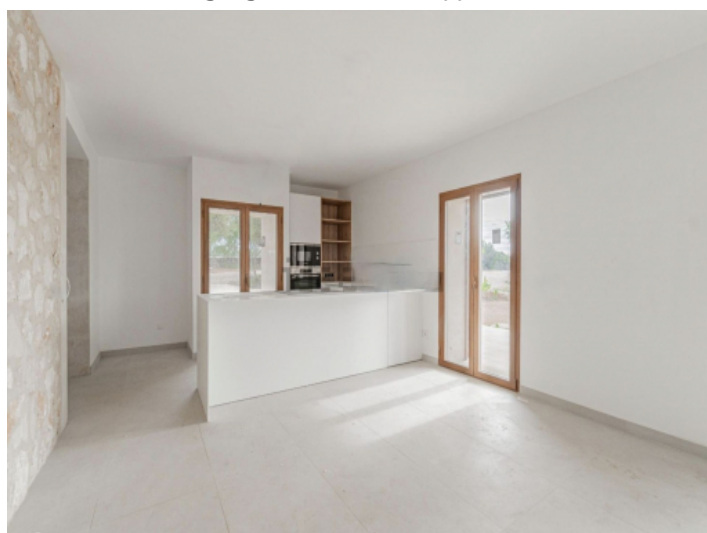
Küche mit Kücheninsel