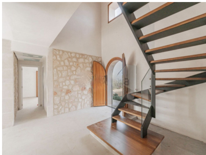
Eingangsbereich und Treppenhaus