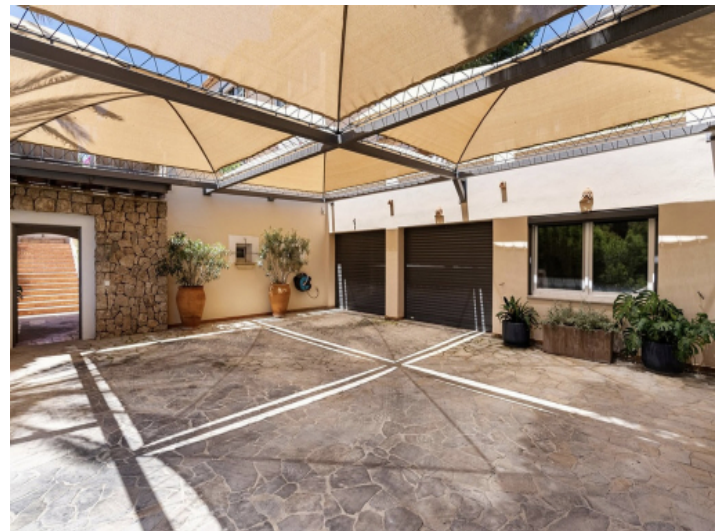
Einfahrt und Garagen