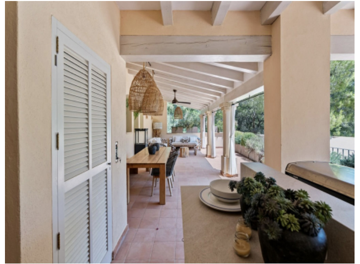
Eine von vielen Terrassen