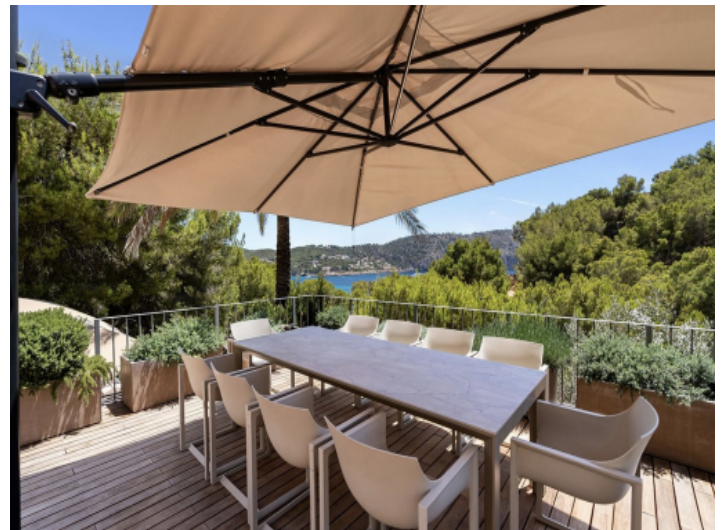
Terrasse mit Meerblick