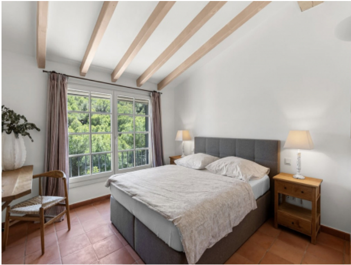
Eines von 6 Schlafzimmern