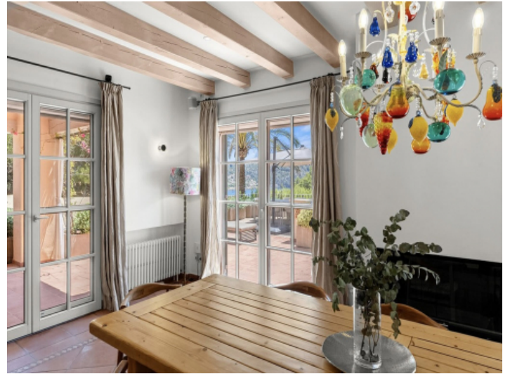
Essbereich mit Blick