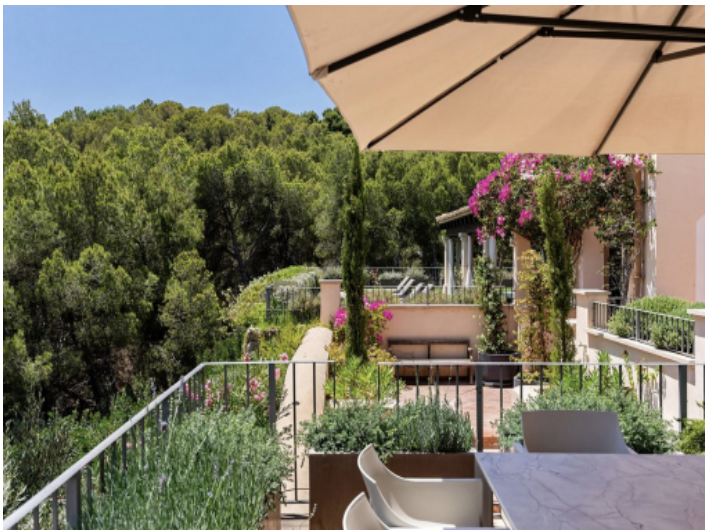
Blick ins Grüne und Privatsphäre