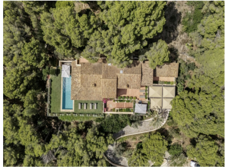
Vogelperspektive der Finca