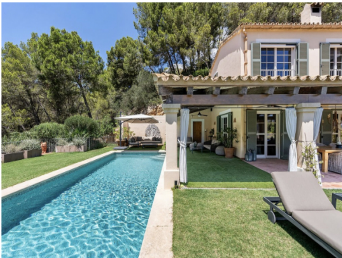
Pool und Gartenbereich