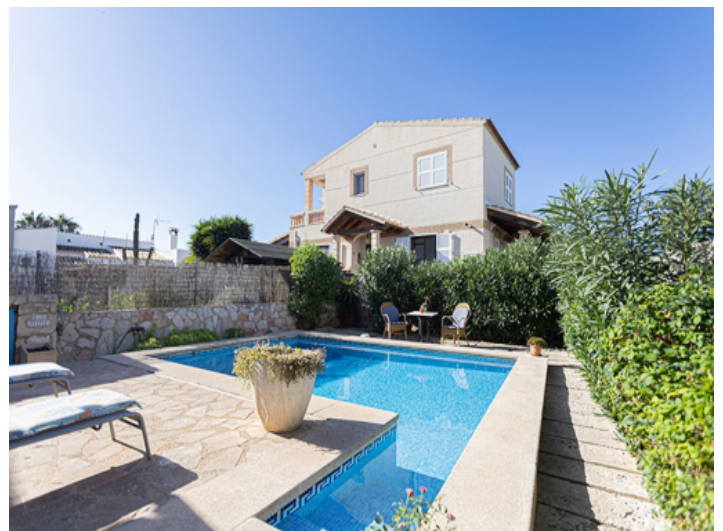
Gepflegtes Haus mit Pool