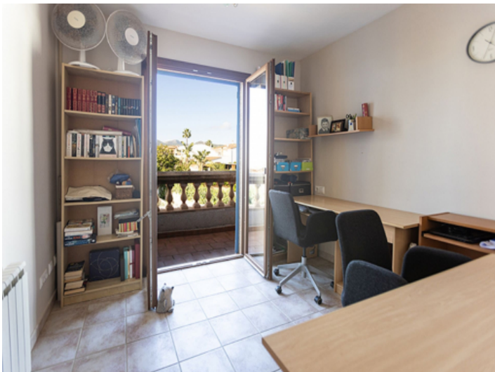
Ein weiteres Schlafzimmer mit privatem Balkon