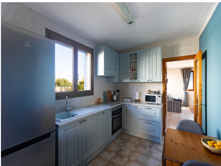
Komplett ausgestattete Küche