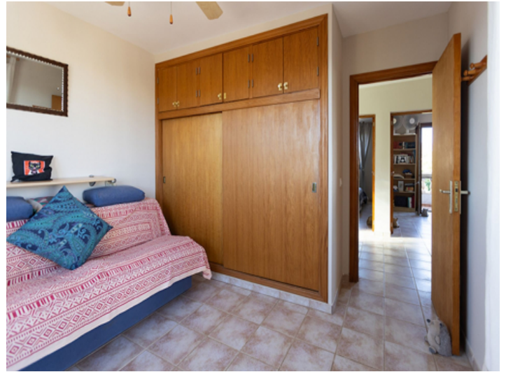
Ein weiteres Schlafzimmer auf der oberen Etage