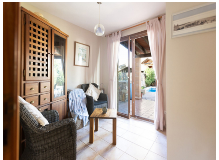
Dieses Zimmer im Erdgeschoss kann auch als Schlafzimmer genutzt werden