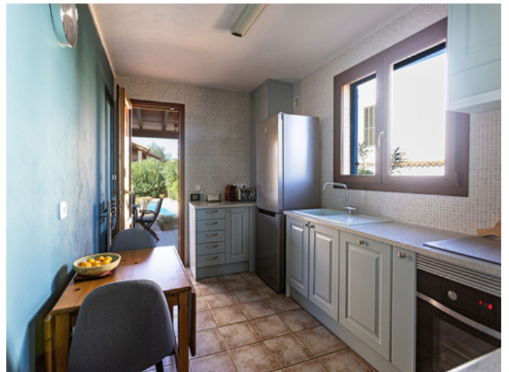
Küche im Landhaus Stil