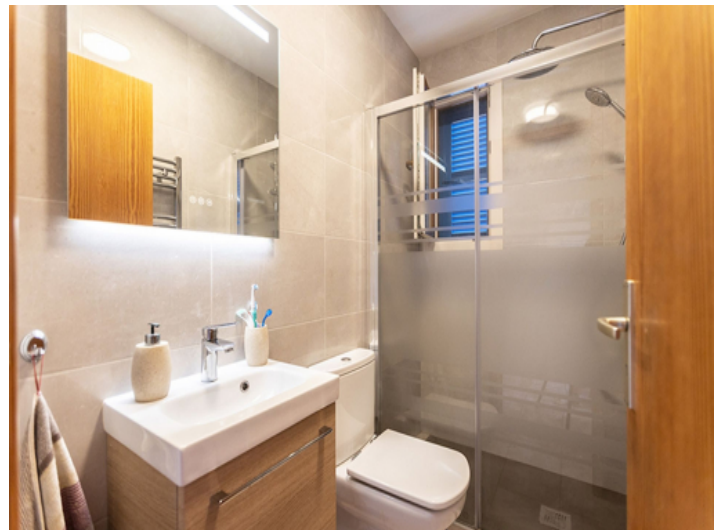
Eines von 2 Badezimmer