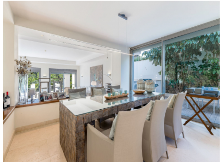
Essbereich mit Terrassenzugang