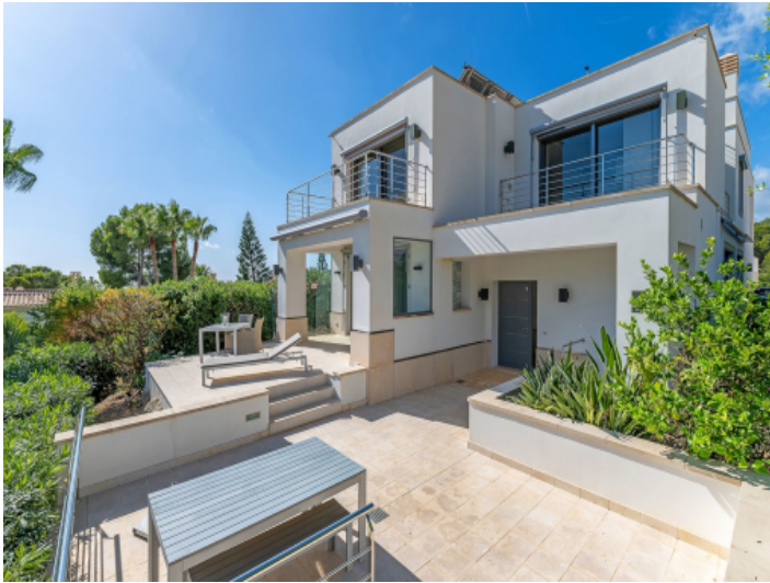
Moderne Villa mit Terrassen