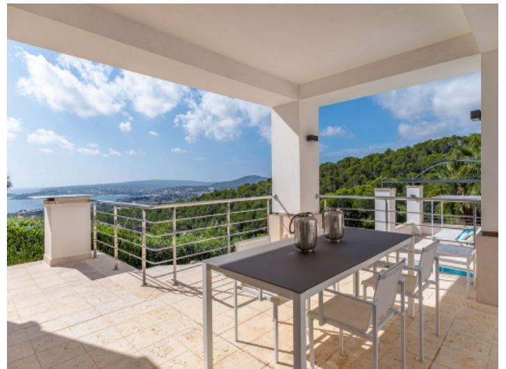
Überdachte Terrasse mit Essbereich