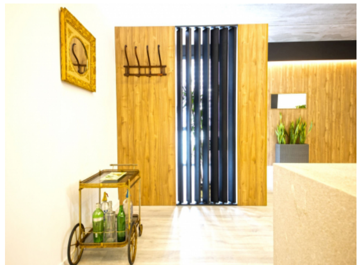
Eingangsbereich des Reihenhauses