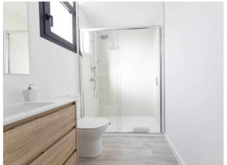
Badezimmer mit Tageslicht