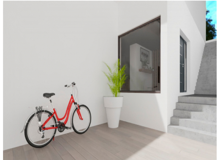
Terrasse vor dem Haus