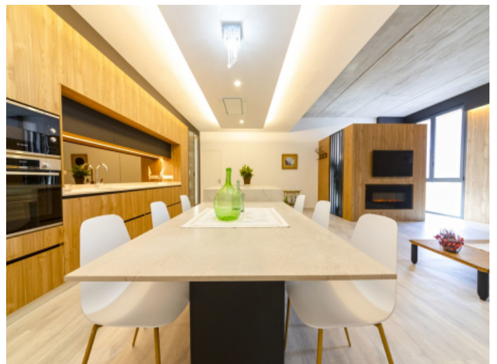
Essbereich mit Blick in die Küche