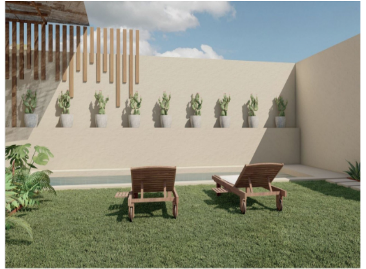
Garten mit Pool