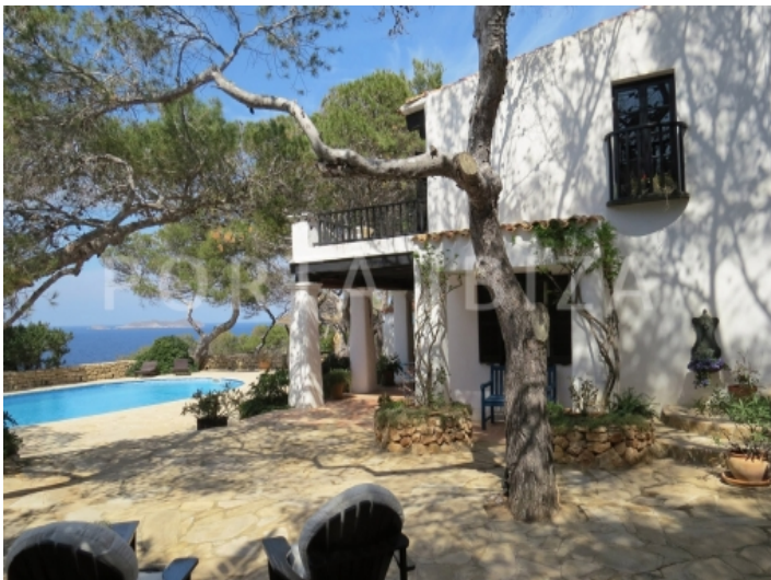
pool terraces-villa-cala vadella-ibiza