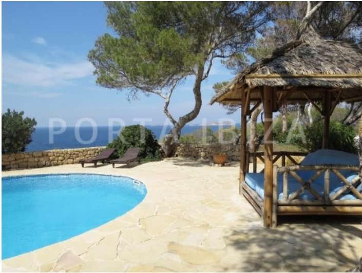
pool & terrace-villa-cala vadella-ibiza