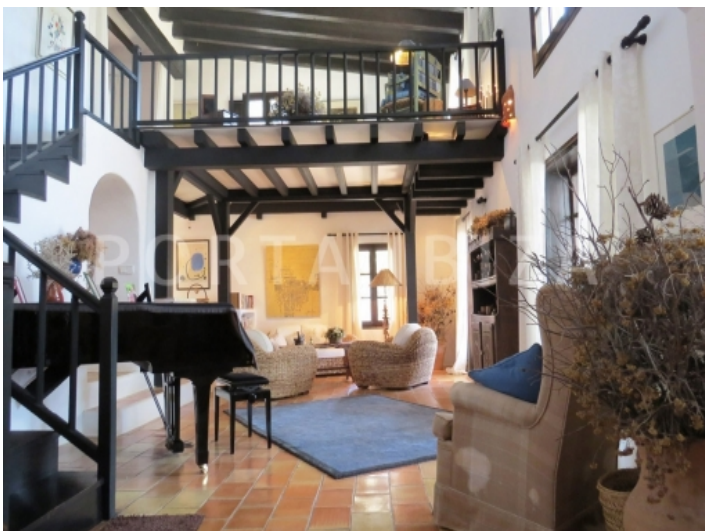
2floor livingroom-villa-cala vadella-ibiza