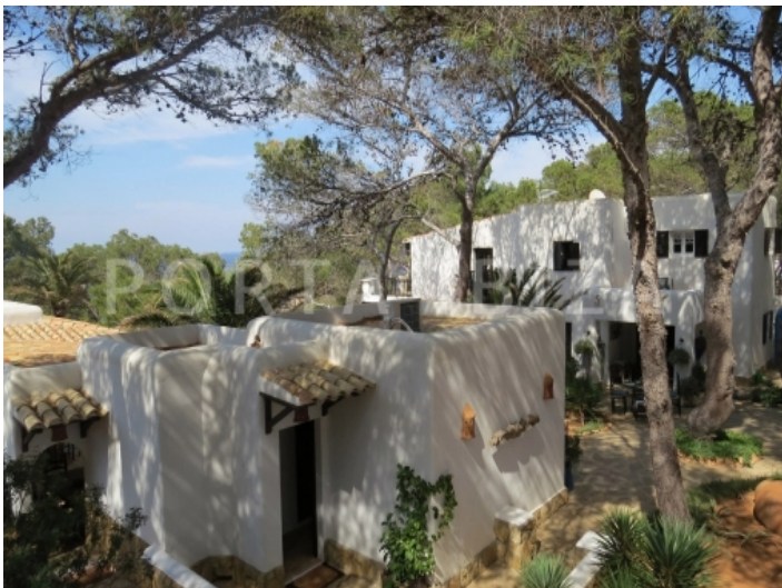
village-guest houses-villa-cala vadella-ibiza