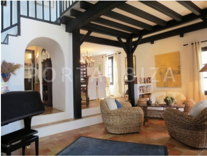
piano & living-villa-cala vadella-ibiza