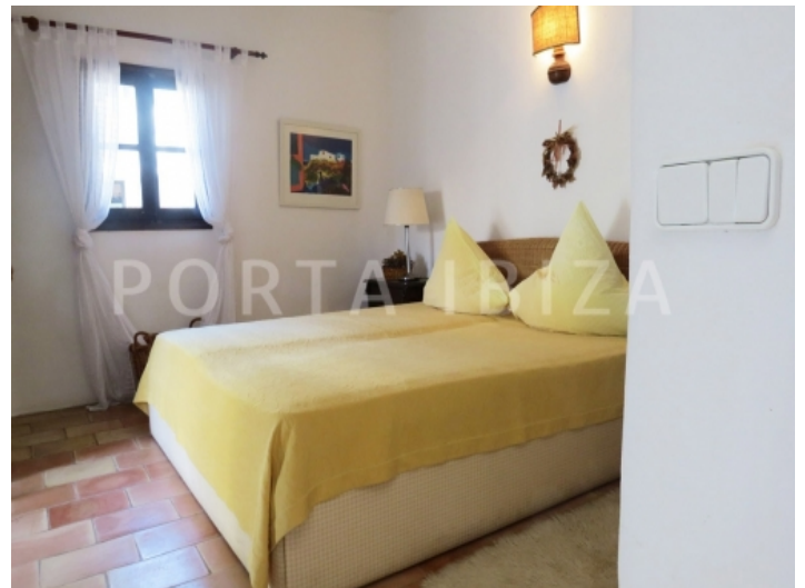
bedroom2 guest-villa-cala vadella-ibiza