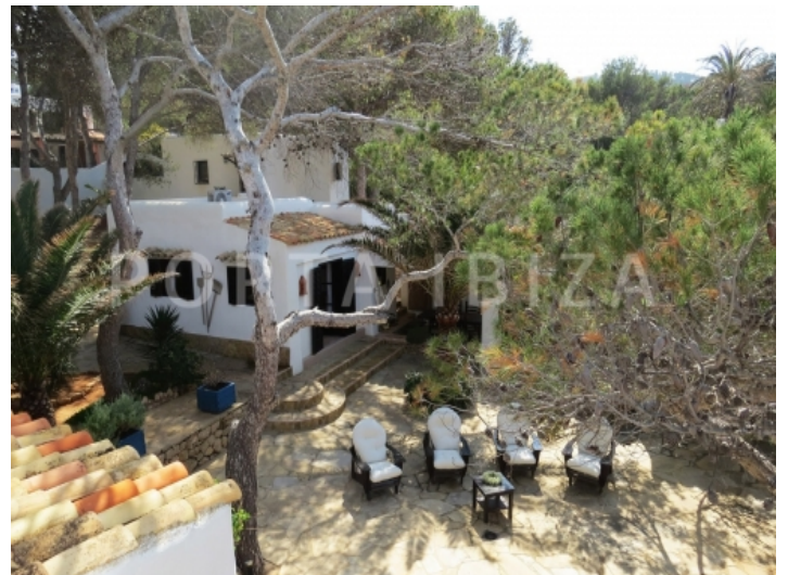
little village view-villa-cala vadella-ibiza