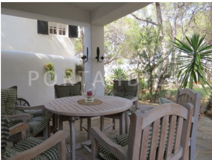
breakfast terrace-villa-cala vadella-ibiza