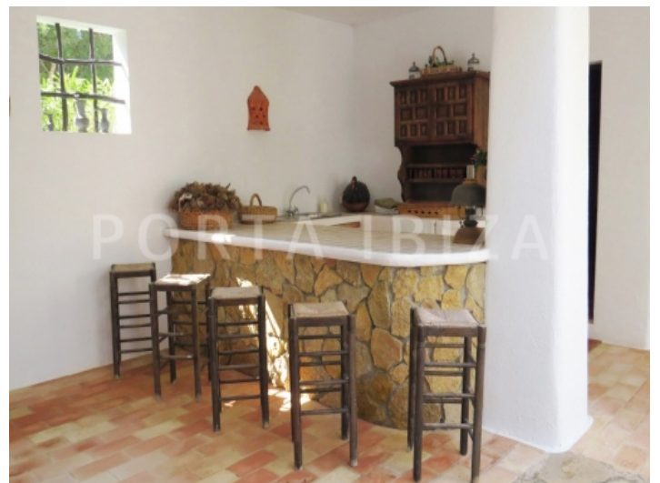
kitchen outdoor-villa-cala vadella-ibiza