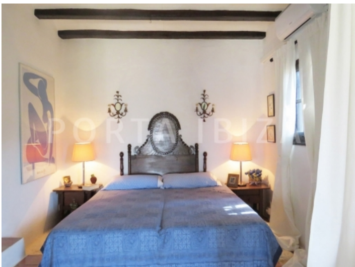
master bedroom-villa-cala vadella-ibiza