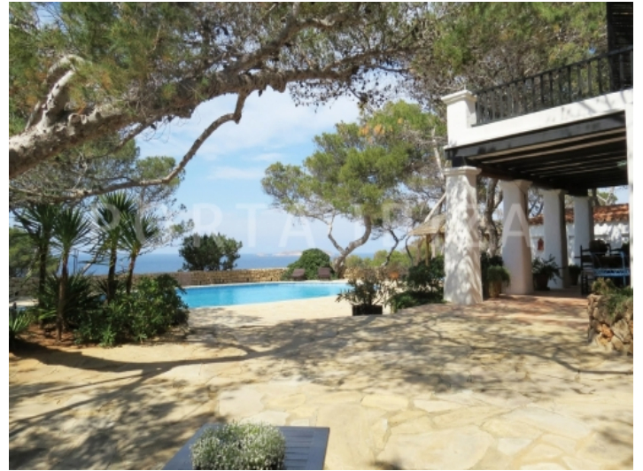
pool terrace seaview-villa-cala vadella-ibiza