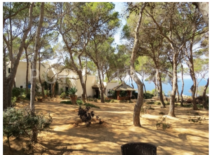
big garden-villa-cala vadella-ibiza