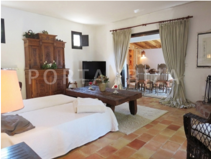
guest bedroom1-villa-cala vadella-ibiza