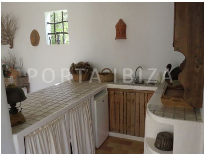
outdoor kitchen-villa-cala vadella-ibiza