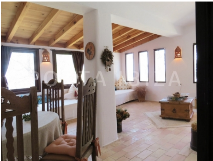
guest livingroom-villa-cala vadella-ibiza