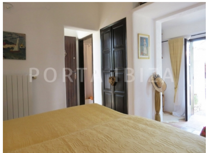
guest bedroom2-villa-cala vadella-ibiza