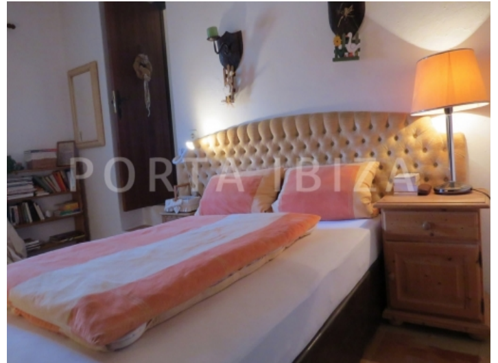
guest bedroom4-villa-cala vadella-ibiza