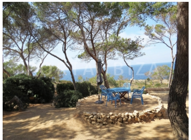
terrace view-villa-cala vadella-ibiza