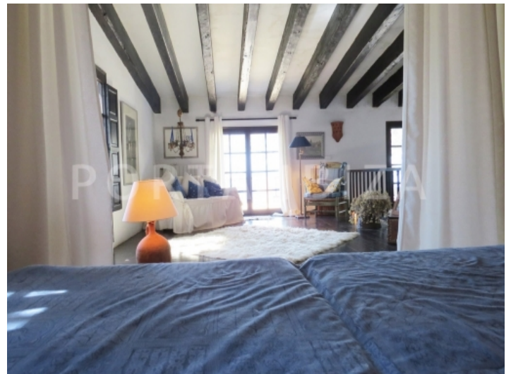
masterbed view-villa-cala vadella-ibiza