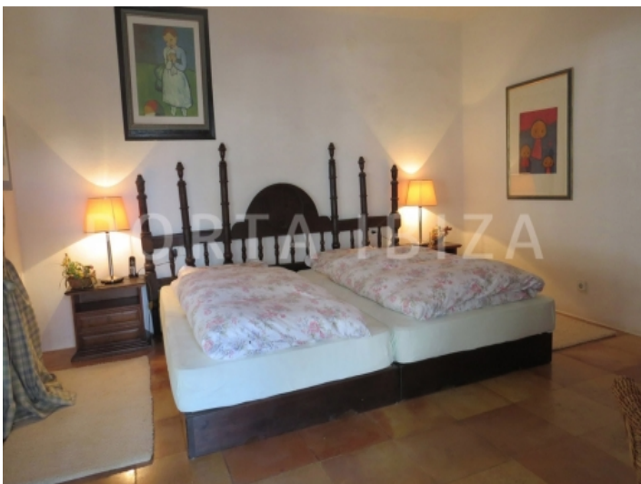
guest bedroom3-villa-cala vadella-ibiza