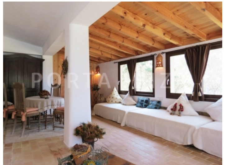
livingroom guest apartment-villa-cala vadella-ibiza