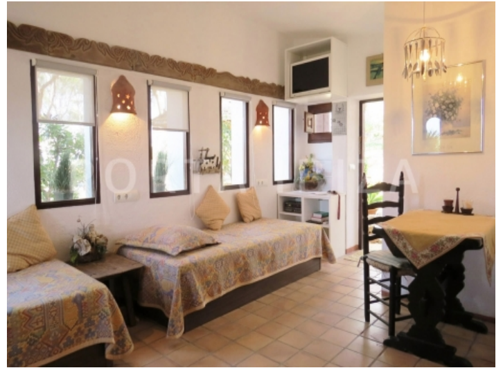
guest apartment-villa-cala vadella-ibiza