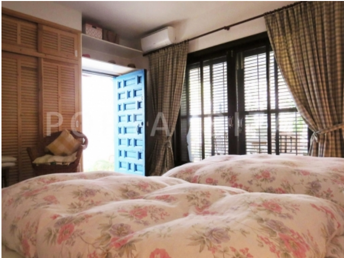
bedroom3 guest-villa-cala vadella-ibiza