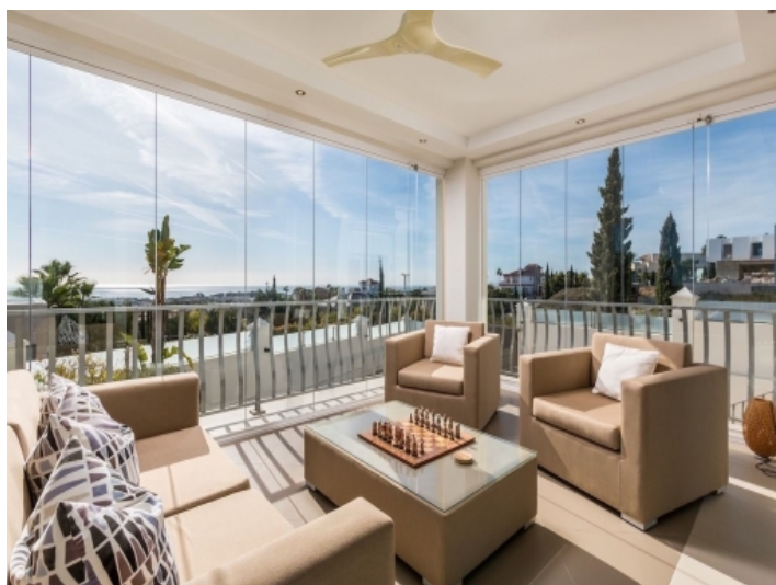
Gästepartment mit herrlichem Meerblick