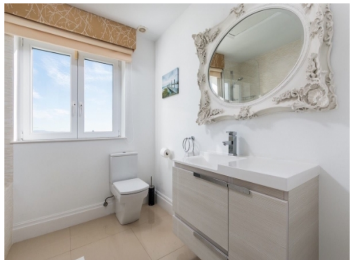
Eines von 6 Badezimmern