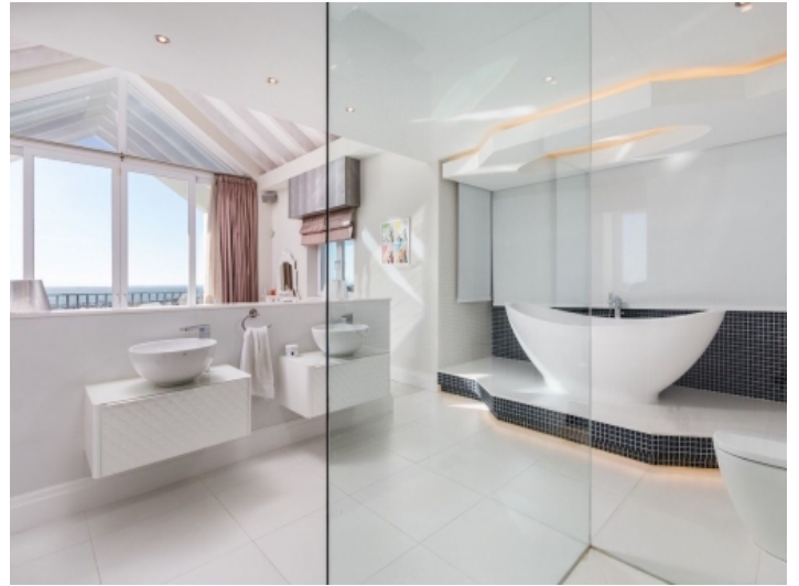
Eines von 6 Badezimmern