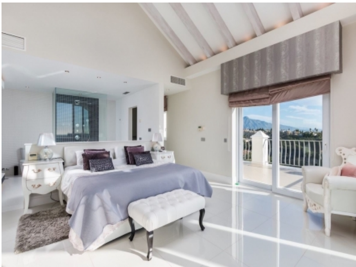
Eines von 9 Schlafzimmern