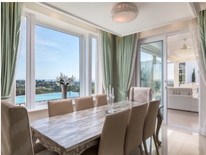
Der Essbereich bietet Platz für bis zu 8 Personen