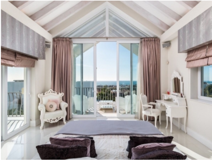
Eines von 9 Schlafzimmern