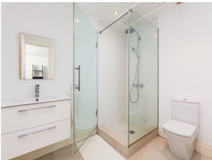
Eines von 6 Badezimmern