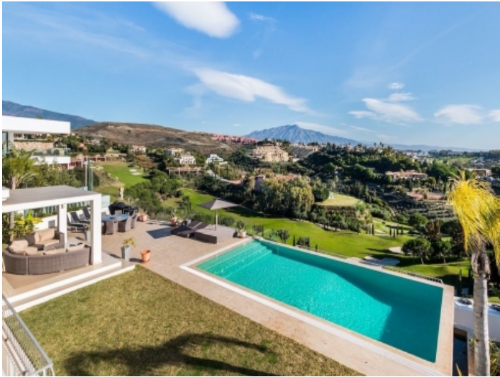
Fantastischer Blick auf die Berge