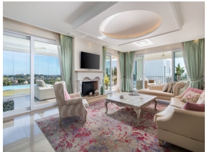
Gemütlicher Wohnbereich mit Kamin