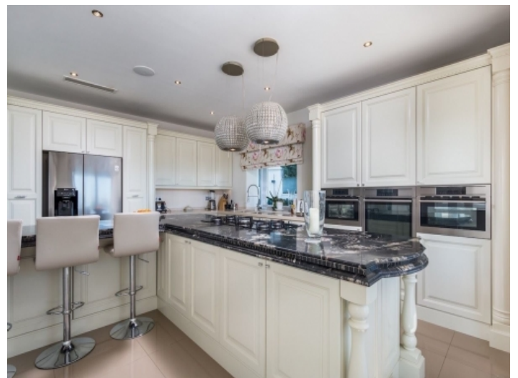
Moderne und voll ausgestattete Küche