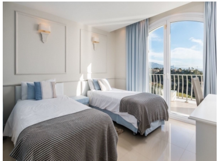
Eines von 9 Schlafzimmern