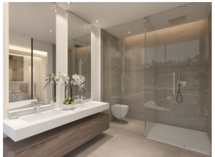
Badezimmer mit ebenerdiger Dusche