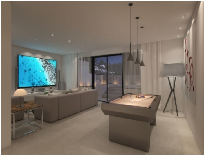
Heimkino und Billardraum