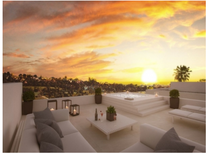
Dachterrasse mit Whirlpool und beeindruckender Aussicht