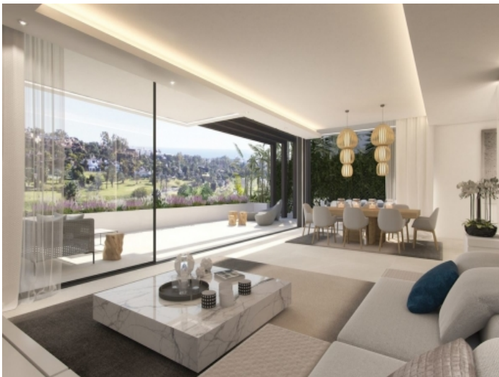
Lichtdurchfluteter Wohn- und Essbereich