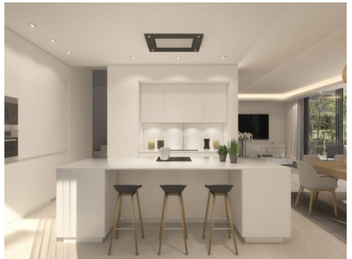
Moderne und voll ausgestattete Küche