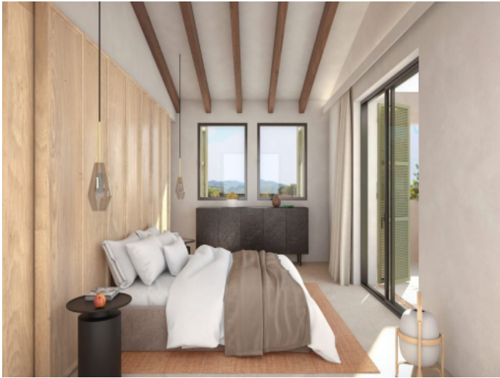
Eines von vier Doppelschlafzimmer