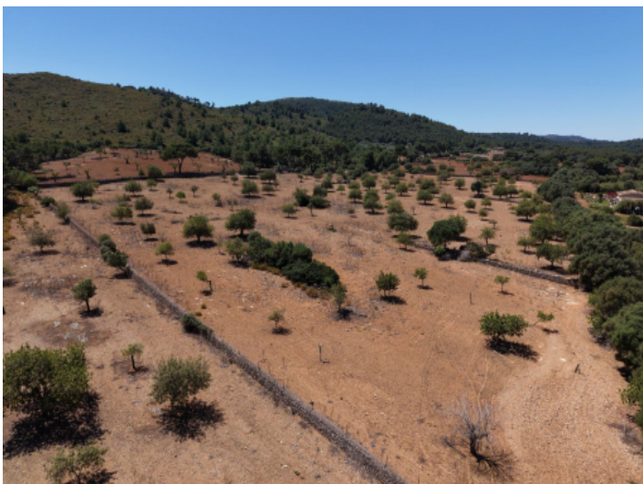
Am Fuße einer Bergkette