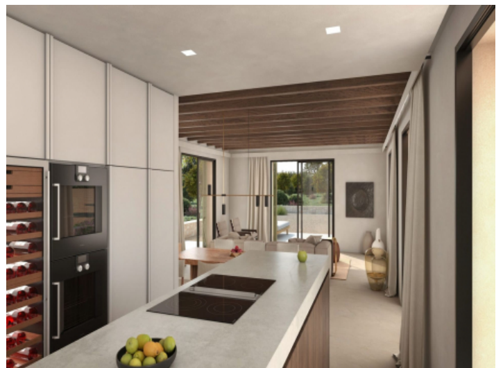
Küche mit angrenzendem Essbereich