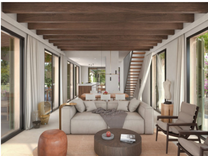
Lichtdurchfluteter Wohn und Essbereich