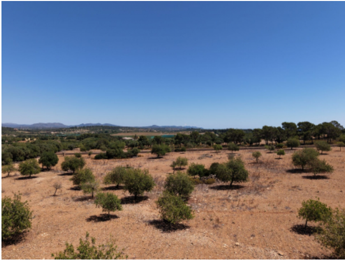
Grundstück in erhöhter Hanglage