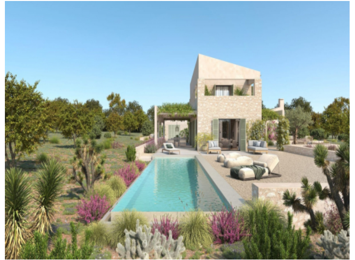
Poolbereich mit schöner Sonnenterrasse