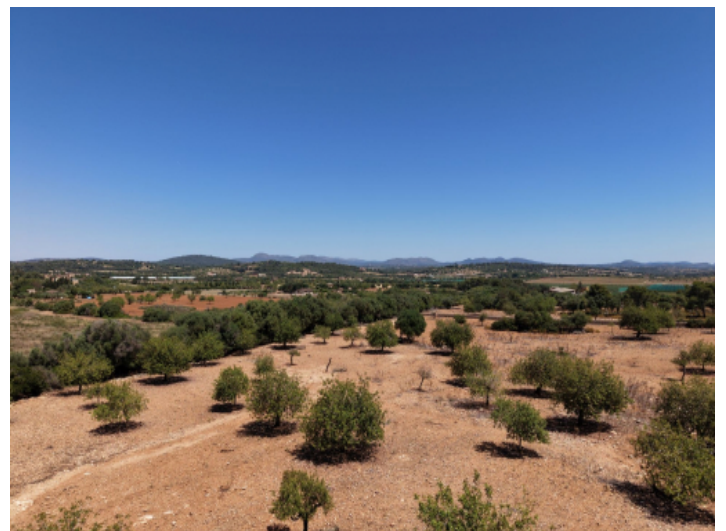
Weitblick über die ganze Insel