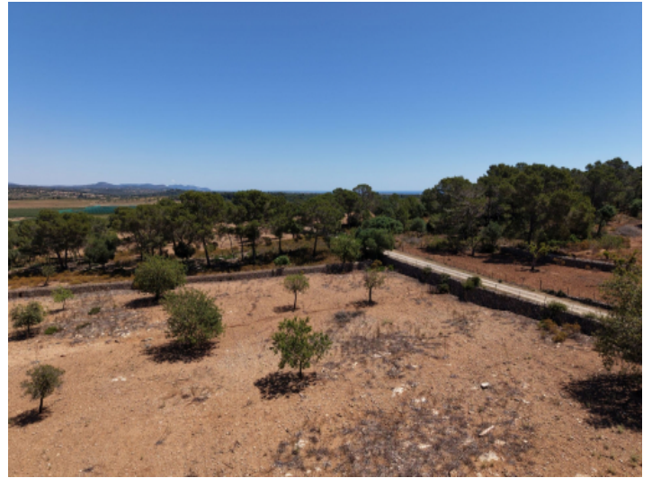
Meerblick von der ersten Etage