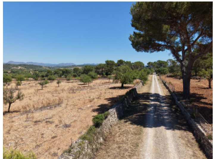
Zufahrt zum Grundstück