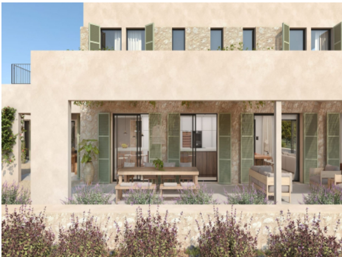
Überdachter Außenbereich der Finca